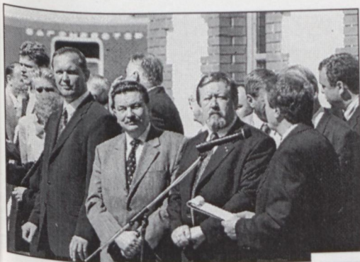
NŐGÁRDI FERENC KÖZLEKEDÉSI MINISZTER A MEGNYITÓN, MÁV-VEZÉREK TÁRSASÁGÁBAN

Avasútbarátok kitörő örömeire 2000. július 14-én megnyitotta kapuit a Magyar Vasúttörténeti Park Budapesten, az Északi Fűtőházban. A jeles napról készült beszámoló – Nagy Tamás tollából – a skanzen tervezésének múltját is felidézi lapunk 39–43. oldalán. Képriportunk fotóit Máthé Zoltán készítette, a fűtőház panorámaképét a Zékány–Máthé képes-lapkiadó jóvoltából közöljük.