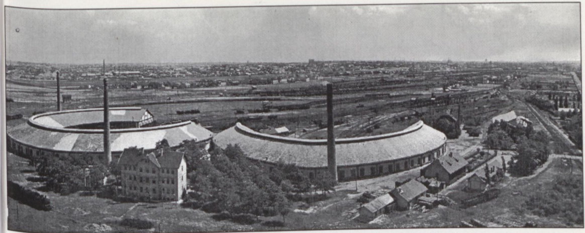
AHOL A SKANZEN MEGVALÓSULT – A MÁV ÉSZAKI FŰTŐHÁZ AZ 1930-AS ÉVEKBEN