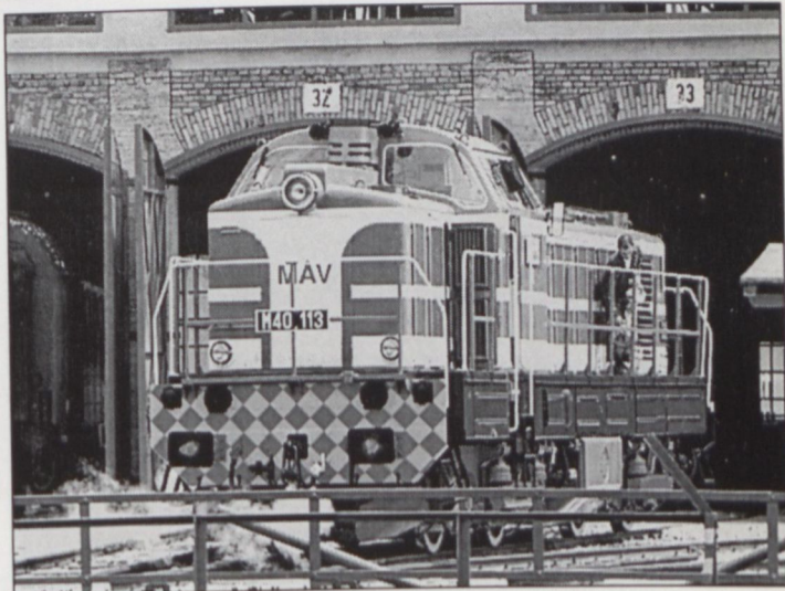
A SZÍNPOMPÁS „OLAJBÁRÓK” EGYIKE: A BÉKÉSCSABAI PÚPOS