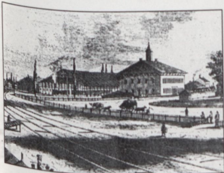
AHOVÁ A SKANZENT TERVEZTÉK – Ó-SZOLNOK PÁLYAUDVAR KORABELI (1847) METSZETEN