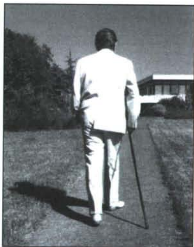
TITO EGYIK UTOLSÓ FÉNYKÉPE...

A gyász hosszúnak ígérkezett. És ennek keretében megerősödő Tito-imádat lett úrrá az embereken. Versek, dalok születtek, amelyek a vezérre emlékeztek. Ilyen volt a „ družbe Tito mi ti se kunemo, da sa tvoga puta nikad ne skrenemo... ” (Tito elvtárs, mi megígérjük neked, hogy a te utadról soha le nem térünk)