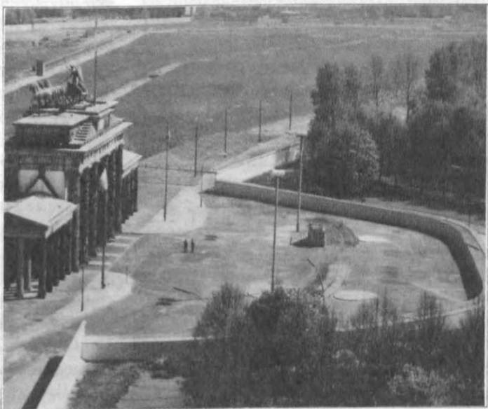
2. ábra. A FAL A BRANDENBURGI KAPUNÁL

1987. június 12-én Ronald Reagan , az USA akkori elnöke a Brandenburgi kapunál felszólította Gorbacsovot , az SZKP főtitkárát,