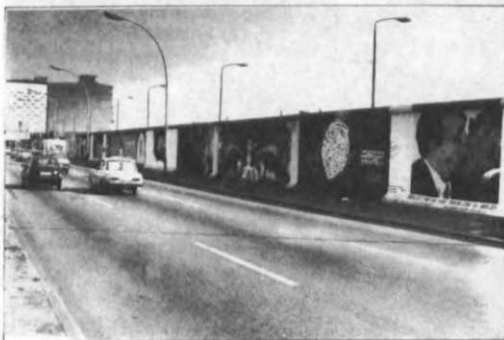
3. ábra. EAST-SIDE-GALLERY

Június 27-én Horn Gyula magyar és Alois Mock osztrák külügyminiszter Sopron mellett egy erdőben, egy kis részen jelképesen lebontotta a vasfüggönnyt. A következő hetekben az NDK-menekültek rohama Magyarország és Ausztria felé felgyorsult.