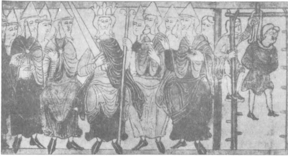
A SZÁSZ KIRÁLY ÉS A TANÁCS

képviselt elegendő erőt. Az angol seregek felszerelése is gyengébb, mint a vasat használó vikingeké. Az átlag harcos dárdával, bőrruhában állt ki csatára. A mozgósítás lassúságát fokozta az, hogy maga a sereg sem volt képes gyors mozgásra.