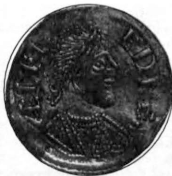
NAGY ALFRÉD EGY KORABELI ÉRMÉN

A béke azonban nem sokáig tartott: a dán porlyák, kisebb összecsapások tovább foly-