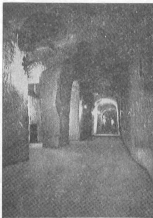
A KŐBÁNYAI SZIKLAPINCÉK EGYIK TÁRNÁJA

Az ötödik serfőzde 1911-ben indult a Maglódi u. 25-ben. 12 A budafoki Haggemacher család építette, így már két serfőzdéjük működött a fővárosban, illetve közvetlen szomszédságában. (Budafok akkor még nem tartozott a fővárosához). A Haggemacher Sörgyárak Rt. kőbányai sörgyára nem volt nagy kapacitású sörgyár (évi 300 ezer hl), de rendkívül korszerű. Sajnos, az I. világháború a söripart rendkívül megrongálta, a piac teljesen beszűkült, ezért a gyárat 1923-ban leszerelték és Nagyváradra szállították. Helyén fonoda létesült Haggemacher Textilművek néven, melyből az államosítás után a kőbányai textilgyár lett, és levált a sörgyárról.