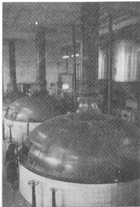
A KŐBÁNYAI SÖRGYÁR FŐZŐHÁZÁNAK RÉZÜSTJEI MÉG A DREHER-IDŐKBŐL VALÓK