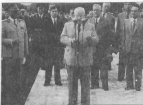
TITO NAGY NAPJA: HIVATALOS BOCSÁNKÉRÉS BELGRÁDBAN

1950 augusztusától októberig az országban 7136 munkástanácsot választottak, több mint 150 ezer taggal. A gyárakban a dolgo-