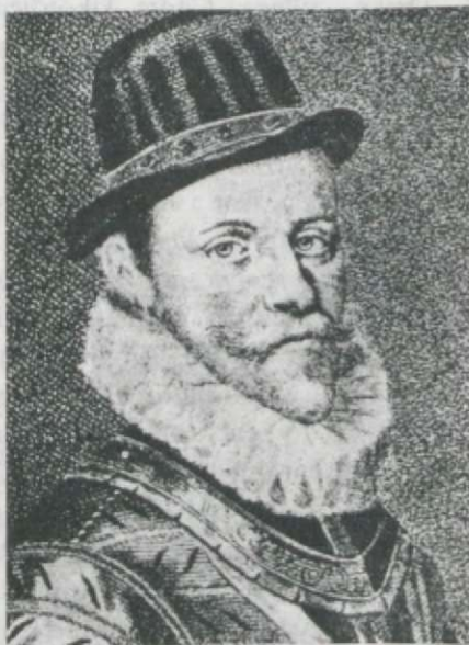
Sir John Hawkins rabszolgakereskedő, kalózkapitány és az Angol Királyság tengernagya

Anglia királynője I. Erzsébet az angolok tengeri hatalmának megalapozója. 1562-1563-ban Sir John Hawkins mint rabszolgakereskedő, kereskedelmi ügyeletet bonyolított le Hispaniola szigetén, ahol rabszolgákat adott el. San Domingóban szállította partra első rabszolgaszállítmányát ezzel megvetette alapját annak az élénk és haszonhajtó összeköttetésnek, amelynek során a spanyol telepesek és az angol kereskedők együttesen igyekeztek kikerülni a kormány hadihajóit és a vámhatóságokat. „ Hawkins mint az »angol királynő« öfelségének kapitánya szabadon kereskedett a spanyol szigetekkel, annak kormányzóit felszólította erre, és amikor megtagadták az engedélyt erőszakkal kényszerítette őket »titkos szerződések« kötésére. ” 26 1565-ben Hawkins újra bejárta az Antillákat. Rendkívül sikeresen tevékenykedett egyedül Cartagena előtt nem ért el sikert. 1568-ban vereséget szenvedett a