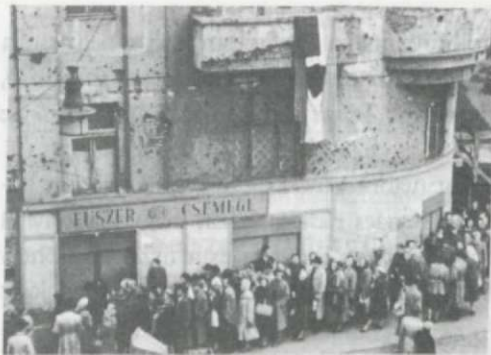
A forradalom „hétköznapijai”: romok, sorbanállás kenyérért, gyászlobogók

Konyev és Zsukov szerint: „ Budapest a felkelők hatalmában van. Eluralkodott az anarchia. A reakció felülkerekedik. A megoldás: megszállás... ” 54