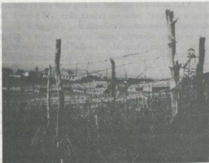
1954 tavaszán a tábor kerítését már felverte a gaz

tartott a táborban. „A táborparancsnok hegyi beszédet tartott, melynek lényege az volt, hogy a közbiztonság Magyarországon ma már annyira megerősödött, hogy az összlakosság segítségével bárkit el tudnak fogni, a szervezett összműködésre ez a példa is jellemző. Hét aljas szökevényt fogtak el, a nyolcadik sem érte el célját, nyugati megbízóit. A határon szökés közben agyonlőtték, így szerencséje volt, mert nem kerülhetett ide vissza, hogy ő is elnyerje méltó büntetését.