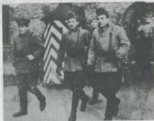
Egy „forradalmi tisztii osztag” – pufajkások

A fegyveres ellenállást jórészt megtörték Budapesten, hogy lehetséges az, hogy az egyik kerület mégis dacol az orosz erőfölénnyel? Ebben szerepet játszhat a földrajzi fekvése – azaz sziget –, továbbá itt volt az ország talán legnagyobb gyárkomplexuma, nagy létszámú, és radikalizálódott munkássággal. A Magyar Néphadsereg 9318 sz. légvédelmi alakulatának 6. ütegeből 20 katonája felkelőkkel tüzelőállást foglalt Csepelen az Imre téren. Még 4-en kilőttek egy páncélos szállítójárművet és egy tankot; 6-án egy IL-28-as repülőgépet, a Kikötő utcánál egy harckocsit. 7-én robbantanak a Vámmentesi úton és a Kikötő utcában, hogy a szovjet csapatok ne juthassanak be a szigetre. 8-án egy vasúti szerelvényt tolnak a harc-koesioszlop elé. Zsukov november 10-én keletkezett jelentésében említi a makacs ellenállást, és 3 harckocsi veszteséget. 89 A csepeliek ellenállását november 11-én török meg.