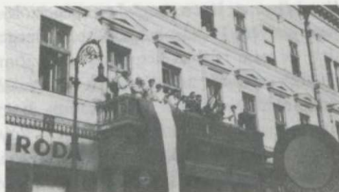
Nagygyűlés Szegeden 1956-ban