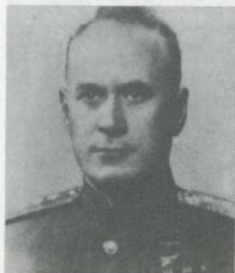
Ivan Szerov, a KGB főnöke, aki letartóztatta a magyar delegációt

költöznek. 69 Bécsi jelentések szerint az osztrák–magyar határt a szovjet egységek hermetikusan lezárták. Hevenyészett táborot állítottak fel a feltartóztatott személyeknek, akiket szovjet katonák őriznek. 70