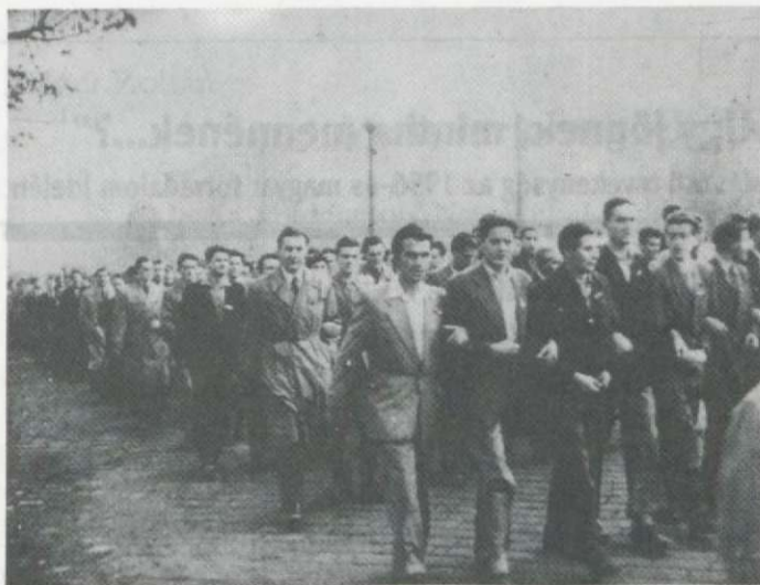
„Békés tüntetésnek indult...”

mányzati szervek nem számoltak a véres ortvámadásokkal s ezért fordultak a Varsói Szerződés értelmében a Magyarországon tartózkodó szovjet alakulatokhoz. A szovjet alakulatok a kormány kérését teljesítve részt vesznek a rend helyreállításában. 9