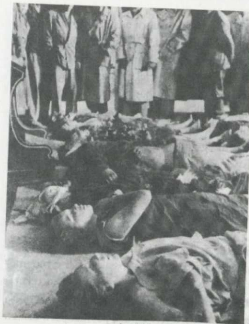
A gyilkos sortűz áldozatai

ladva kb. 8-10 méterre volt a fegyverektől, a tömegben levő BM tiszt jobb kezét felemelve „sapka a kézben” jelzést adott, és ezt követően a katonák löni kezdtek... Kb. 20-30 perc után tisztult a helyzet, csak a halottak maradtak vagy örvönen, nemzeti színű zászlóval letartva. A katonaság visszavonult a laktanyába... Idővel mind több ember érkezett a területre, ezek a laktanyát körülvették, felszólították a katonákat, hogy a sapkájukról vegyék le a vörös csillagot. A közlegények 4-5 fős csoportokban tárgyalták maguk közt az eseményeket, tanácsatlanná váltak, s miután a lakosság felszólította őket, hogy tagadják meg az engedelmességet a tiszteknek, a laktanyán belül látható volt a szakadás. A lövések során az egyik kiskatona is megsérült, a bal oldali géppuskaállásban nyakon lőtték. A BM szerint a felvonulók közül valaki meggyőződése, hogy az egyik tiszt lőtt a fiúra. Feltehető, hogy nem teljesítette a parancsot.”