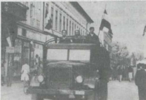
Fellobogozott teherautó a szegedi Kárász utcán