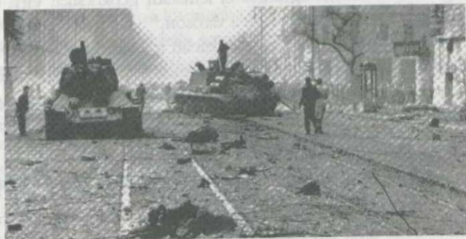
A pesti utcákon kiégett szovjet páncélosok

A nap utolsó katonai jellegű hírért a Rádió Miskolc röpfői fél 23.54-kor, miszerint kéri Miskolc város lakóit, hogy ne hallgassanak a rémhürekre! Felsőzsolcánál és a görömbölyi útel-