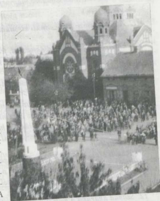
A művet előkészületlenül, vontatottan és ügyetlenül folyt...

A gimnázium előtti téren más indulatok uralkodtak, mint a diákok körében. A szovjet emlékmű ledöntésére gyűlt össze néhány száz fős tömeg. A művet előkészületlenül, vontatottan és ügyetlenül folyt. Az obeliszkre egy kötelet kötöttek és 50-60-an megpróbálták kézzel megdönteni, a kötelet azonban alacsonyra tették, a „mű” meg sem rezdült emberi húzásra. Ekkor a hagymakutató állomás traktora próbálkozott, sikertelenül, az első kerekei a levegőbe emelkedtek. Ezután két, sínen futó létrát szereztek, ezeknek tetejére állva a kötélhurkot az obeliszk felső harmadára helyezték, az alsó tag fölött az oszlop megadta magát, a létrákat szétfeszítve zuhant a földre. A város szeptember 26-i felszabadításának évfordulójára elhelyezett koszorúkat elégették. Az oszlop alsó egységének és a bronzköpenynek eltávolítása nagy küszködés árán valósult meg. A bronz domborművet előbb a Marosba kívánták hajítani, végül a közeli MÉH-telepre került, a vörös csillaggal együtt (amely az emlékmű tetején volt).