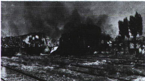
A Tisza teherpályaudvar a bombázás után

Az első valós légiriadó, az első bombázás június 2-án érte Szeged városát. Először 7.55-kor jelentették a budapesti Légórtalmi Központba a kötelék észlelését, a légialarmot 8.12-kor rendelték el Szegeden a kötelék azonban elvonult, a riadót lefűjták. Mintegy két óra múlva újra elrendelték a riadót, s 10.20-kor megkezdődött a bombázás, melyet a 304. bombázóezred 454. bombázócsoportja hajtott végre, 38 db B-24 típusú nehézbombázó bevetésével. A Vezérkari Főnökség 1. osztályának jelentése szerint: „ Szeged: rendező pályaudvar több találat. Részletes jelentés nincs ” –, de ezen kívül az Alsóvárost érte komolyabb rombolás. Találatot kapott az utászraktanya és a szennyvíztelep,