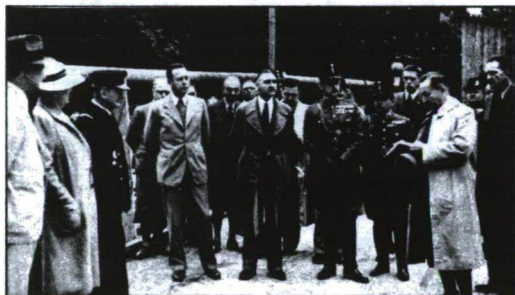
Horthy Miklós látogatása Budafapusztán 1938-ban

számú kút először 1937. november 21-én termelt olajat. A B-2 jelű kút termelési eredményeire alapozva alakult meg 1938. július 15-én a magyarországi EUROGASCO cég jogutódaként a Magyar Amerikai Olajipari Részvénytársaság (MAORT) 14 357 000 pengős részvénytőkével, s a részvények 90 %-át a Standard Oil Co. of New Jersey tartotta kezében. A MAORT gyorsan és ésszerűen terjeszkedve a piacon 1939-ben az ország kőolajszükségletének 80 %-át, 1940-ben 100 %-át fedezte. Magyarország a MAORT révén már nem szorult többé kőolajimportra, sőt kőolajtermelő orszaggá lépett elő! A MAORT tevékenysége persze ezután sem merült ki a feltárt mezők kiaknázásában, tovább folytatták az utánpótlást biztosító kutatást, melynek eredménye 1940-ben a lovászi , 1941-ben a lendvaijfalvi mező feltárása és termelésbe állítása. 1941-ben az olaj finomítókba szállításának gyorsabbá és hosszú távon olcsóbbá tétele érdekében megépítették a Bázakerettyét Budapesttel összekötő kőolajvezetékét, mely akkoriban a leghosszabb volt Európában. Gyorsan kiépítették a MAORT magyarországi szervezetét: központja Budapesten volt, Nagykanizsán területi központot hoztak létre, és központi laboratóriumot építettek a vegyészeti munkák elvégzésére. Ezenkívül Bázakerettyén műhelyt létesítettek a gépi berendezések javítása és alkatrészutánpótlás biztosítása céljából, s felállították a Tervezési és Építési Osztályt, melynek feladata a gyors ütemű üzem-, lakás-, út-, és hidépítés szervezése volt.