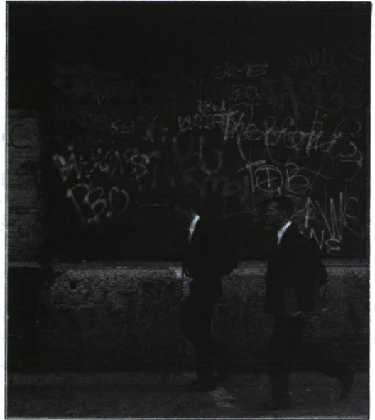
Mormon aktivisták Bronxban