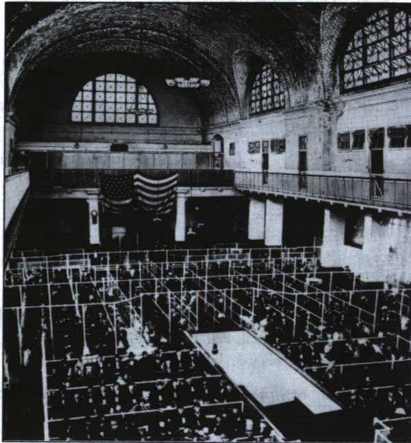
A kétségekkel teli végállomás: Ellis Island

A kivándoroltak nagy része a keleti partot részesítette előnyben. A leggyakoribb végcélnak New York, Philadelphia és New Jersey számítottak. A kijutottak helyzete nehéz volt, aki nem akart végleg kint letelepedni, annak is három, négy évig kint kellett dolgoznia. Az első keresetet elvitte a jegy útiköltség-törlesztése. A másodikat az otthoniak adósságának rendezése, és csak ezután lehetett hozzájárulni a gyűjtögetéshez. A kint dolgozók zöme csekken küldte haza keresetét. Valakinek sikerült annyit összeszednie, hogy meg tudta alapozni további életét otthon; volt, akinek többször vissza kellett jönnie. A kivándorlás legnagyobb hatása, a népességsökkenés mellett a munkaerőhiány lett. Ez azonban együtt járt a munkabérek emelkedésével, és fokozatosan emelkedett a munkások élet-színvonala az Óhazában, a megnövekedett munkaerőkereslet miatt.