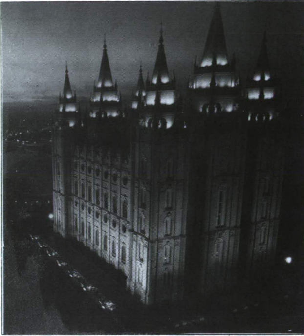
Mormon templom Salt Lake Cityben

Napok Szentjeinek Jézus Krisztus Egyháza tanítása és szövetségéi), valamint a „Pearl of Great Price” (Értékes gyöngyszem).