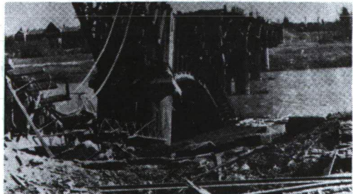
A híres szegedi vasúti híd a bombázások után