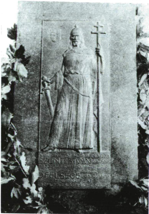
A hajó jelképe, a Szent Istvánt ábrázoló bronzplakett

A csatahajót több ország búvárai felkeresték már az elmúlt években. Merültek itt 1974-ben és 1979-ben jugoszláv, 1990-ben olasz, 1994-ben osztrák búvárok. Magyar búvárok 1994 októberében keresték fel a Szent István csatahajót első alkalommal. Az expedíció a horvát és a magyar műemléki felügyelőség hivatalos megállapodása alapján 1995. május 1-12-e között végezte a feltárást. Az expedíció központja Ilovik szigetén volt.