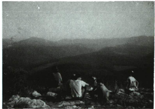
A Tar-kővön.

Másnap reggel az Őserdőn és az Istállós-kőn át Bánkút felé vettük az irányt. Másfélszáz éves, érintetlen bükkös az Őserdő, amelyben – a hegységnek nevet adó – fákat az erdészek szabadon hagyják születni, élni és elkorhadni. A sűrű lombok között a báyadt, reggeli napsütés ellenére esti sötétség honolt. Tízre túljutottunk a Bükk legmagasabb csúcsán, az Istállós-kőn (959 m), amely inkább őstörténeti, mint turisztikai nevezetesség, hiszen semmiféle kilátást nem nyújt, és csak egy-két méterrel emelkedik a környező hegyek fölé. Barlangjából a crómagnoni ősember kárpát-medencei rokonának leletei kerültek elő. A későbbi korok embere télen állatait tartotta a barlangban, a hegy neve is innen eredeztethető.