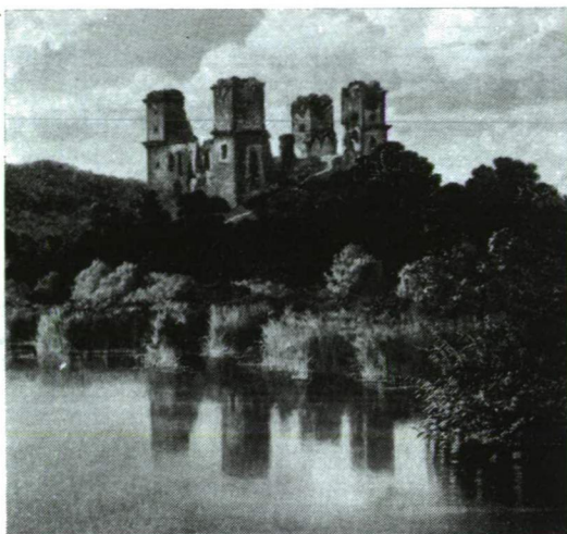
A diósgyőri várom Telepy Károly olajfestményén (részlet)

Diósgyőr és környéke az Anjouk korában tovább virágzott. Az 1360-as években Nagy Lajos pompás palotát épített a várhoz. Állandó harcaiban szerzett sebeit az uralkodó szívesen nyalogatta a győri palotában, és – Árpád-kori elődeihez hasonlóan – edzéseként bölényre vadászott a Bükkben és az Upponyi-