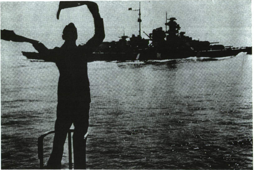
A Bismarck 1941 májusában kifut utolsó útjára

Paul Kennedy : Nagy hatalmak tündöklése és bukása. Bp., Akadémiai, 1992.