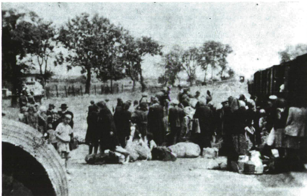
Deportolták bevagózása egy Kecskemét környéki községben, Soltvadkerten.

A neológ zsinagógát is helyrehozta az állam, és most a „tudománynak és technikának” ad otthont. A városunkban ma élő zsidók létszáma igen kevés. Ha nagyobb ünnepet tartanak, akkor átmennek a nagykőrösi zsinagógába. Van egy klub, ahol minden pénteken összegyűlnek, beszélgetnek, figyelemmel követik az izraeli és hazai eseményeket. A legnagyobb fájdalom az, hogy nincs egy megszentelt házuk, templomuk, ahol megtarthatnák a szertartásaikat. A másik pedig az, hogy létszámuk lassan, menthetetlenül csökken.