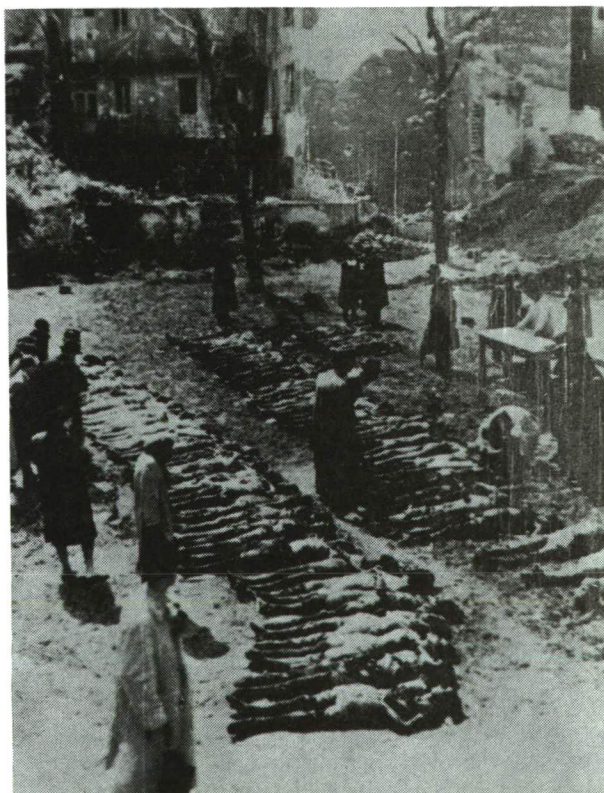
1945. január 18-a, a gettó felszabadulása után, a Dohány utcai zsinagóga kertjében talált tetemek