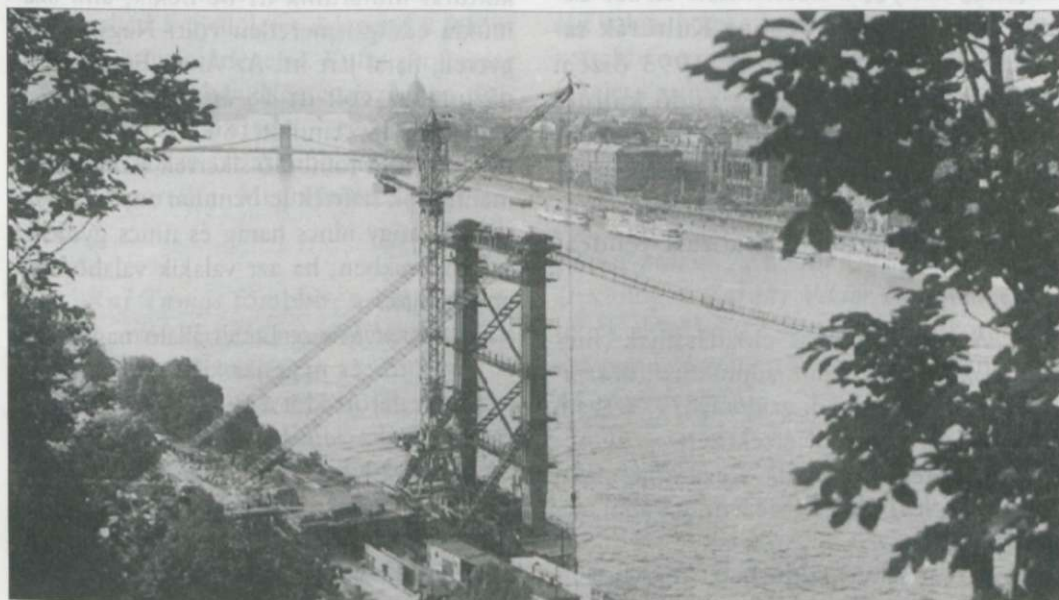
Az épülő Erzsébet-híd az 1960-as évek elején.