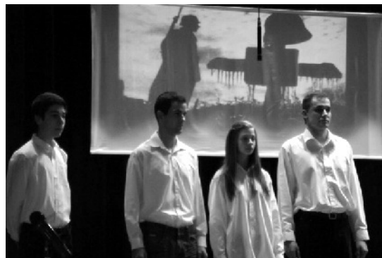
Megemlékezés a Don-kanyarban elesett katonákra, 2013. január 11.