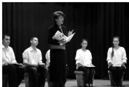
Magyar Kultúra Napja, 2013. január 25.