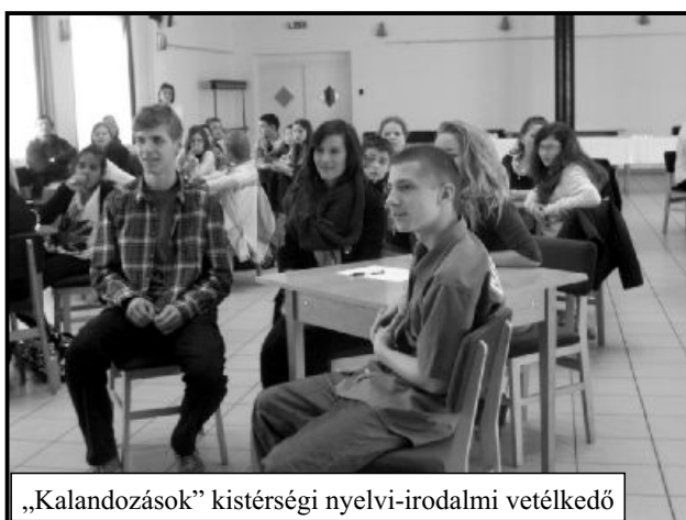
„Kalandozások” kistérségi nyelvi-irodalmi vetélkedő