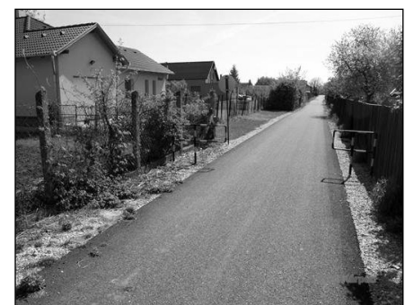
A "kisvasút" út felújítása