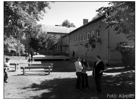
Benedek Elek Tagiskola nyílászáróinak cseréje