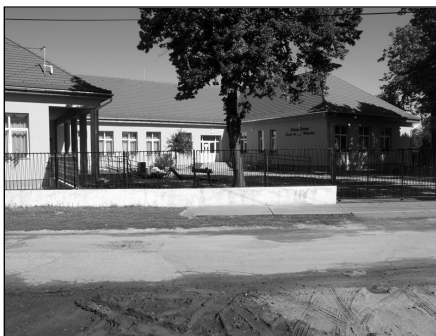
Fekete István Óvoda bővítés, felújítás és bölcsőde kialakítása