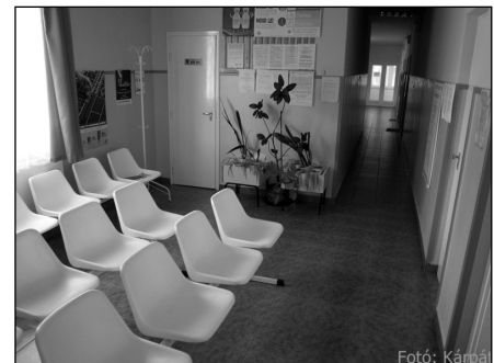
Orvosi rendelők váróinak a felújítása a társulajdonosokkal közösen