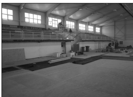
Sportcsarnok felújítás, kivitelezési hibák javítása