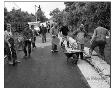
Árvízvédelem a Sajón