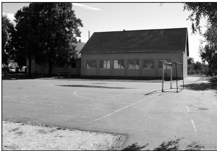
Herman Ottó Általános Iskola és Alapfokú Művészetoktatási Intézmény napközi épületének felújítása