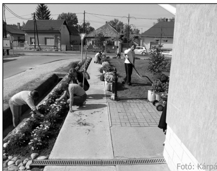
Folyamatos település szépítés, parkosítások