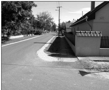
Vay-telepi utak felújítása