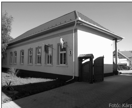
ÖNO épület felújítása