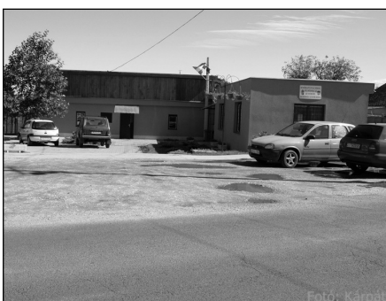
Rendőrségi KMB Iroda megnyitása