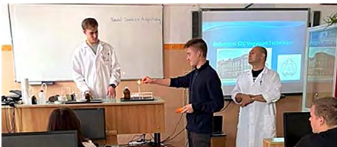
Pillanatképek a Vegyipari technikum bemutatójából

Látványos kísérletek bemutatásával népszerűsítették diákjaink körében intézményüket a Debreceni SZC Vegyipari Technikumát képviselő tanulók és az őket kísérő pedagógus.