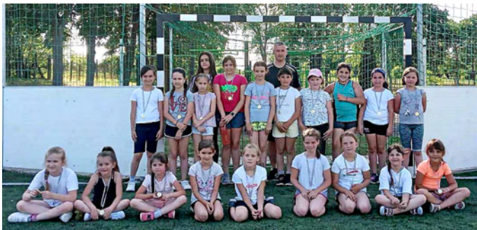
FOTÓK: LÉTAVÉRTES SC '97

Kézilabda szakosztályunkban is befejeződtek az edzések. A gyerekek egész évben szorgalmasan dolgoztak és szép sikereket értek el a versenyeken.