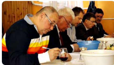
Dolgozik a zsűri