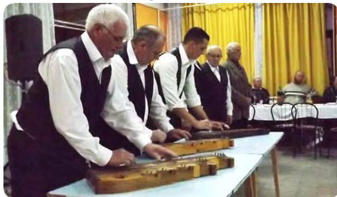
Létavértesi citerások másora