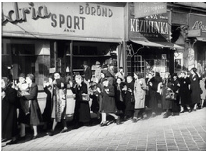
1944. október 16.: menetelő zsidók a Rákóczi úton.

nem mondtam el. De nem én voltam a legrosszabb az osztályban, voltam nálam sokkal rosszabbak is. Lehet, hogy tőlük tanultam.