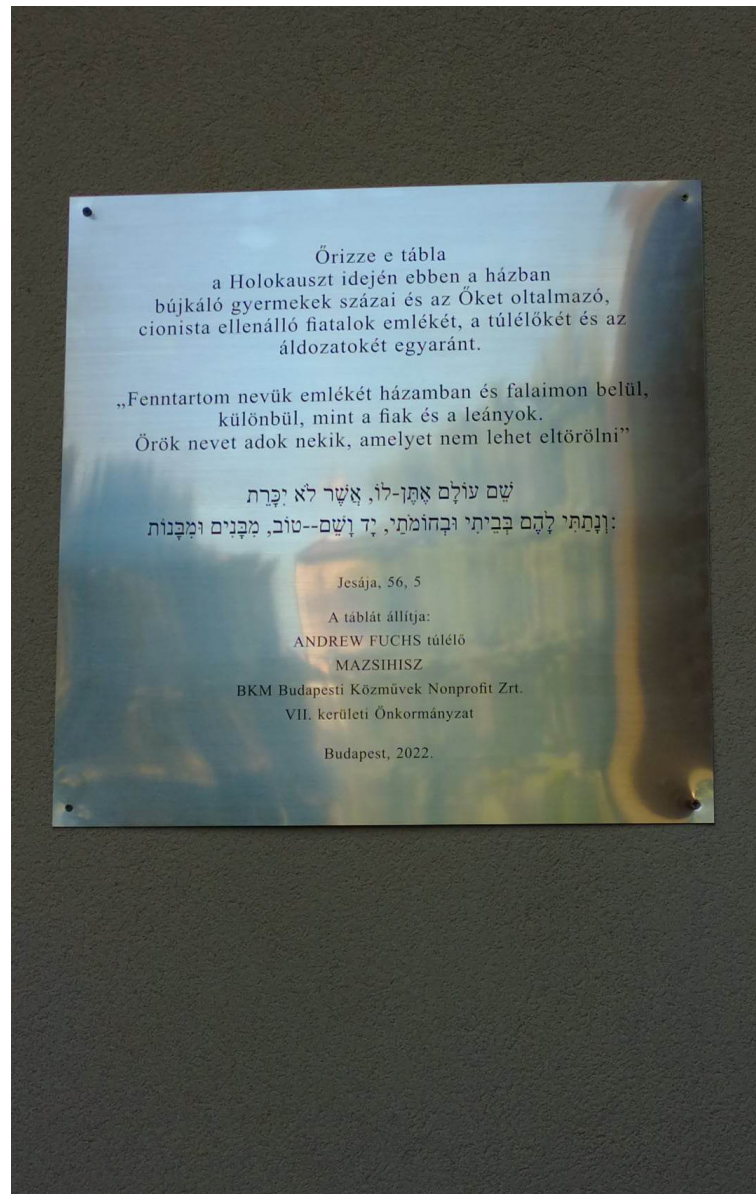
Az egykori (mára eltűnt) emléktábla az utcafronton és a mai emléktábla az udvaron.