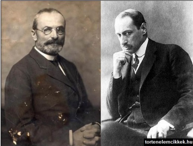
A nagy ellenfelek: Tisza István és Károlyi Mihály

A békediktátum előzményei (1918 október - 1919 augusztus)