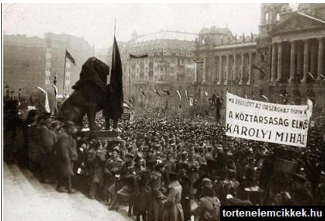
Az őszirózsás forradalom: 1918 október 28 - 31

ta az ország elszakadását a Monarchiától, ám ugyanakkor nem tudta megvalósítani a földosztást, nem tudta talpra állítani a gazdaságot és legnagyobb kudarcként nem volt képes korrekt fegyverszünet megkötésével garantálni az országot támadó román, szerb, cseh és antant csapatok megállítását!