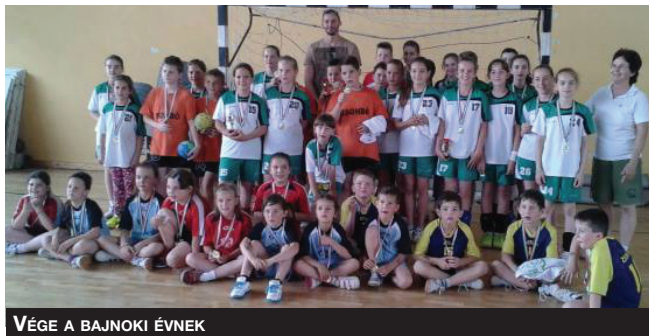
VÉGE A BAJNOKI ÉVNEK

Mindenkinek köszönet a segítségért, most is jó csapat voltunk!