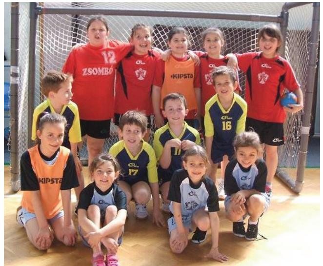
KISSÉ HIÁNYOSAN, DE ANNÁL LELKESEBBEN