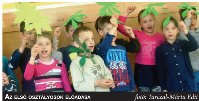
AZ ELSŐ OSZTÁLYOSOK ELŐADÁSA

GYURISNÉ KEREKES JUDIT MUNKAKÖZÖSSÉG-VEZETŐ SZIKAI