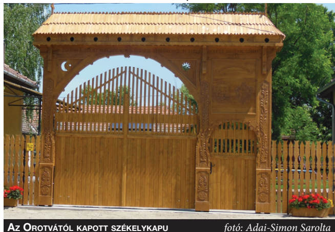
AZ OROTVÁTÓL KAPOTT SZÉKELYKAPU

A zsombói képviselő-testület a 2006-os választások után tudatosan keresett olyan testvértelepülést, ahol valamely elszakított országrész magyarjaira talál. A keresés sikerrel járt, és 2008. június végén Orotvával (Székelyföld, Románia, román neve: Jolotca – a szerk.) aláírtuk a testvértelepülési szerződést. A hivatalos kapcsolatokon túl arra törekedtünk, hogy valódi tartalommal töltsük meg a szerződésben foglaltakat. Azóta sok baráti kapcsolat alakult ki és működik az orotvaiak és a zsombóiak között, de a sport és a gazdaság területén is vannak összekötő szálak. Az évek alatt sokszor ellátogattunk egymáshoz, sok él-ménnyel gazdagodtunk közösen. Az iskola több évfolyamának sikerült megnézni Orotvát és a környékbeli nevezetességeket. Néhány éve egy amatőr színdarabot láthattunk a falunapon orotvai emberek előadásában. Idén június 4-én, a nemzeti össze-