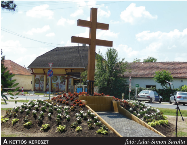
A KETTŐS KERESZT