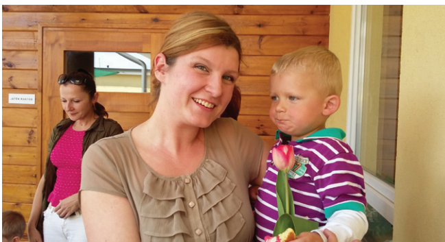
ANYA CSAK EGY VAN

Anya, anya, anya – a legtöbbször kiejtett szó, ami a kicsi gyerekek száját elhagyja. Egy szó, de jelentése tengernyi: szeretet, ölelés, biztonság, öröm, vigasz, játszótárs, tanító... és ahány ember, annyi gondolat.