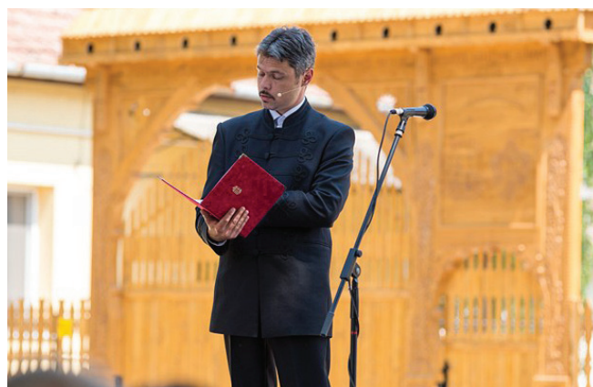
GYURIS ZSOLT BESZÉDE