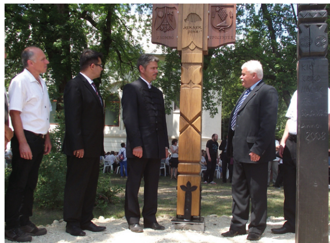
IPOLYNYÉK POLGÁRMESTERE ÁTADJA A KOPJAFÁT

Körülbelül kétéves előkészítést követően idén májusban kötöttünk testvértelepülési szerződést a Temes megyei Máriaföldével (Teremia Mare – a szerk.), ahol a magyarság aránya sajnos már 8% alatti, és vészesen csökken. Tavaly először megvendégteltük egyhetes nyári táborra – a magyar nyelv gyakorlásának szándékával – a máriaföldi gyerekeket. A körülbelül egy órányi autóútra lévő, a magyarság szempontjából szórványnak mondható településen az utóbbi években újraindult az iskolában a magyar nyelv oktatása, és ha minden jól megy, lesz a magyarságnak egy közösségi épülete is. Az említett közösségi épület a katolikus egyház tulajdonába szállt vissza, és sok év huzavona után alaposan kibebevezte kapta vissza a helyi egyházközösség. Abban igyekszünk segítséget nyújtani a helyieknek, hogy mielőbb használható állapotba kerüljön az épület, és meg is tudják tölteni tartalommal.