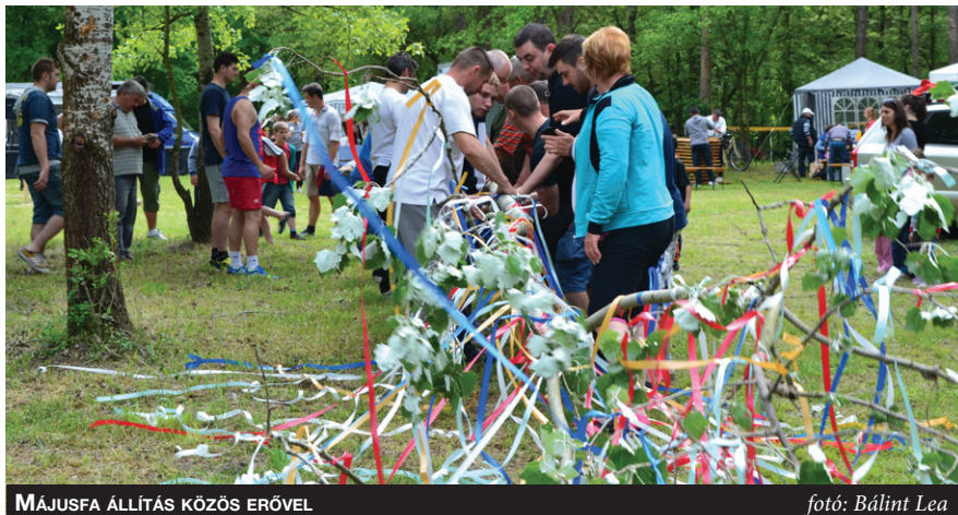
MÁJUSFA ÁLLÍTÁS KÖZÖS ERŐVEL

előkészültek a pörköltfőzéshez, hallgatták a retro slágereket, tollasoztak, fociztak, egyszóval jól érezték magukat. Délelőtt a rátermett férfiak közös erővel felállították a májusfát, majd délután a Stihl Timbersports tartott sportfavágó bemutatót. Aki eddig nem tudta, hogy a favágást lehet sportszerűen végezni, most igazán igényes és izgalmas ízelítőt kaphatott