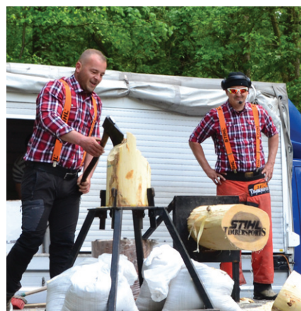
A FAVÁGÓK BEMUTATÓJA