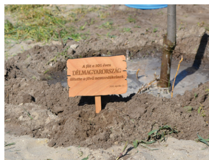
A DÉLMAGYARORSZÁG EMLÉKTÁBLÁJA ÉS AZ ISKOLÁSOK FAÜLTETÉSE