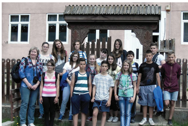
AZ OROTVAI TESTVÉRISKOLA ELŐTT