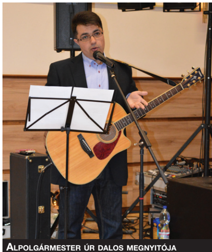
ALPOLGÁRMESTER ÚR DALOS MEGNYITÓJA