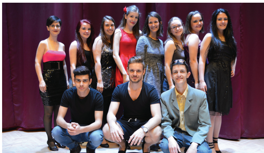
CSOPORTKÉP A FELLÉPÉS ELŐTT