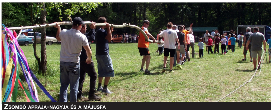
ZSOMBÓ APRAJA-NAGYJA ÉS A MÁJUSFA