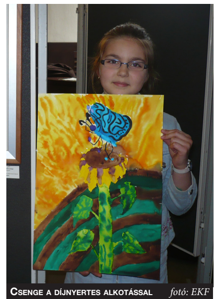
CSENGE A DÍJNYERTES ALKOTÁSSAL