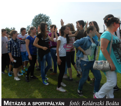
MÉTÁZÁS A SPORTPÁLYÁN

Öt település fiataljai találkozájának adott otthont településünk