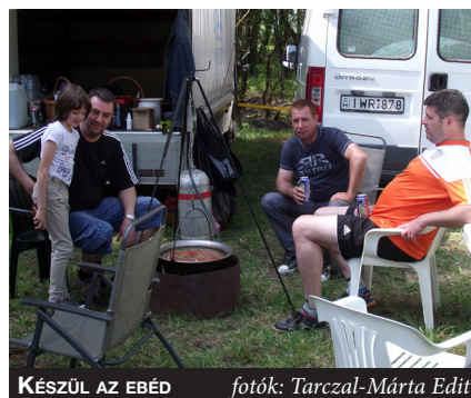
KÉSZÜL AZ EBÉD