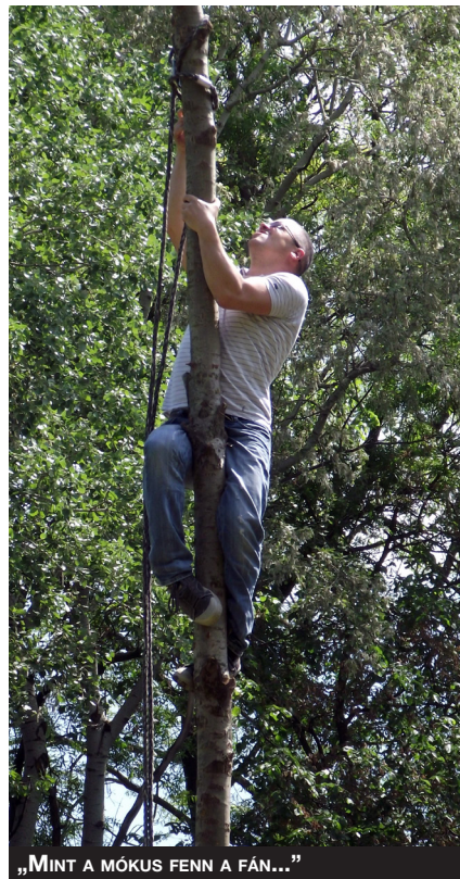
„MINT A MÓKUS FENN A FÁN...”