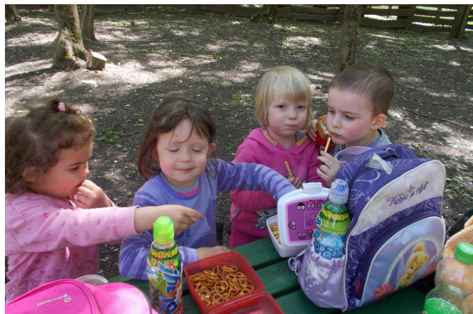
MI VAN A HÁTIZSÁBÁN?