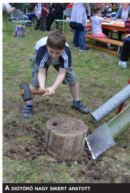
A DIÓTÖRŐ NAGY SIKERT ARATOTT