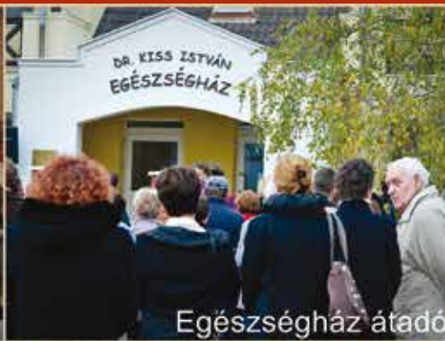
Egészség ház átadó