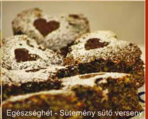
Egészség hét - Sütemény sütő verseny