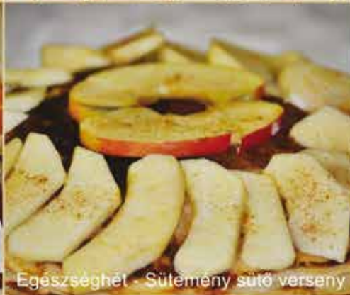
Egészség hét - Sütemény sütő verseny