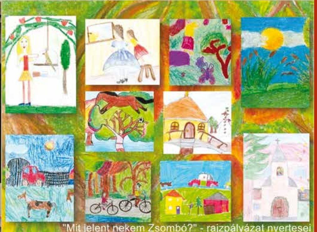
"Mit jelent nekem Zsombó?" - rajzpályázat nyertesei