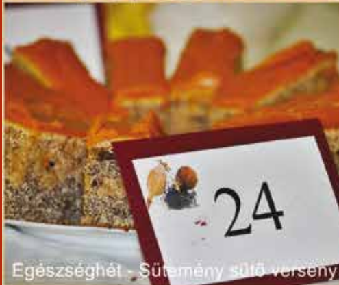
Egészség hét - Sütemény sütő verseny