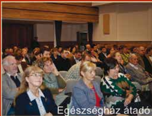
Egészség ház átadó