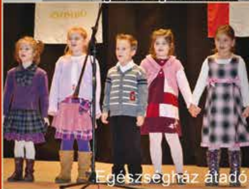
Egészség ház átadó