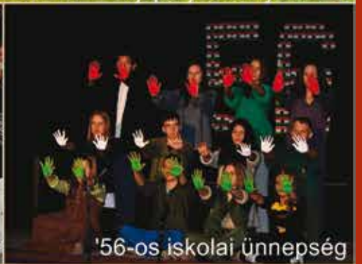
'56-os iskolai ünnepség