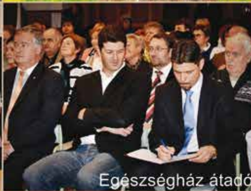
Egészség ház átadó