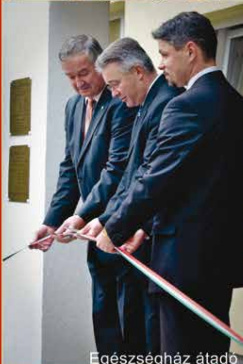
Egészség ház átadó