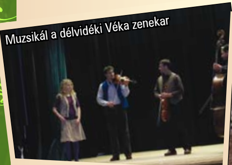
Muzsikál a délvidéki Véka zenekar