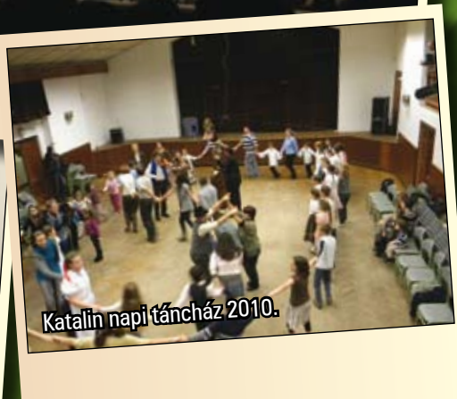
Katalin napi táncház 2010.

További képek elérhetőek a www.kultura.zsombo.hu weboldal galériájában