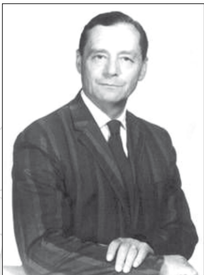
Wass Albert: Karácsonyi üzenet