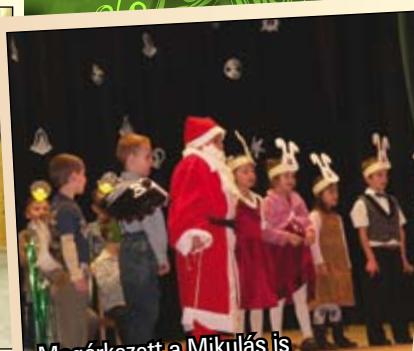
Megérkezett a Mikulás is