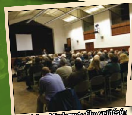
Teltház a Mindszenty film vetítésén