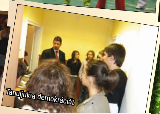
Tanuljuk a demokráciát