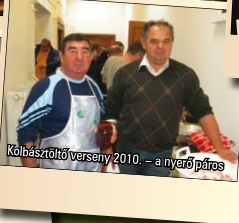
Kölbásztöltő verseny 2010. – a nyerő páros