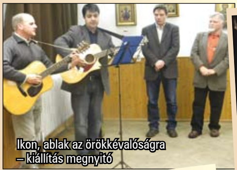
Ikon, ablak az örökkévalóságra – kiállítás megnyitó