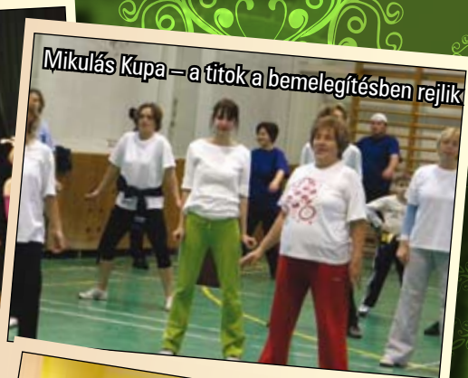
Mikulás Kupa – a titok a bemelegítésben rejlik