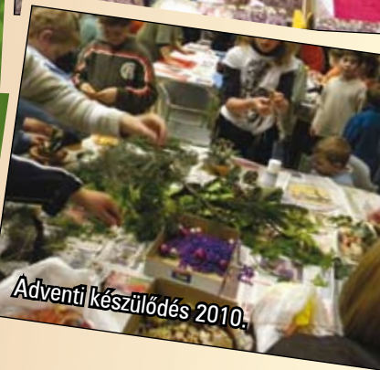
Adventi készülődés 2010.