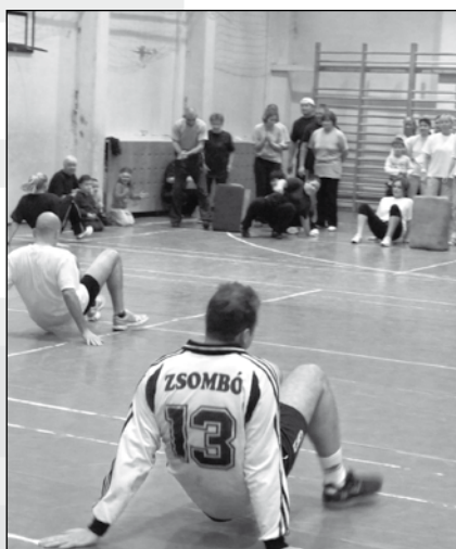
„Mikulás napja... Gyerekkorunkban tél volt ilyenkor;”

A József Attila Községi Ház 2010. december 4-én - hagyományteremtő szándékkal - első alkalommal rendezte meg a Mikulás Kupa elnevezésű sportdélutánt.