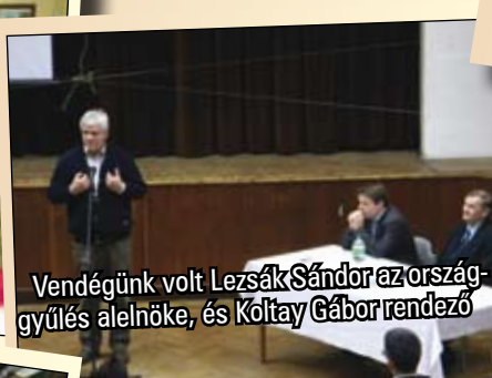
Vendégünk volt Lezsák Sándor az ország- gyűlés alelnöke, és Koltay Gábor rendező