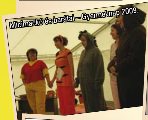
Micimackó és barátai – Gyermeknap 2009.