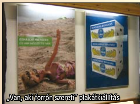
„Van, aki forrón szereti” plakátkiállítás