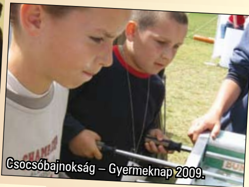
Gsocsóbajnokság – Gyermeknap 2009.