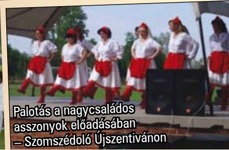
Palotás a nagycsaládos asszonyok előadásában – Szomszédoló Újszentivánon