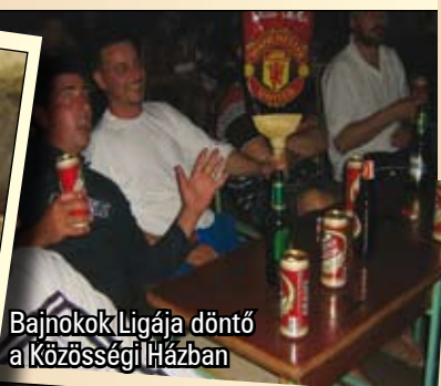
Bajnokok Ligája döntő a Községi Házban