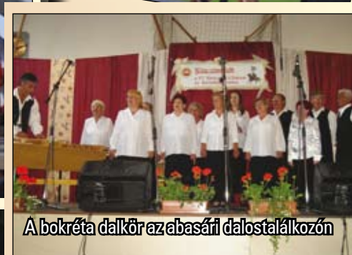
A bokréta dalkör az abasári dalostalálkozóon