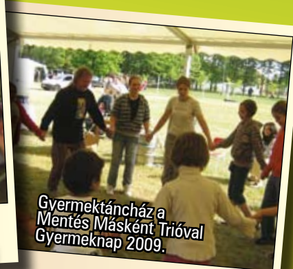
Gyermektáncház a Mentés Másként Trióval Gyermeknap 2009.