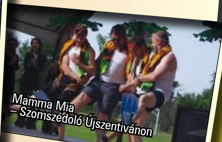
Mamma Mia – Szomszédoló Újszentivánon