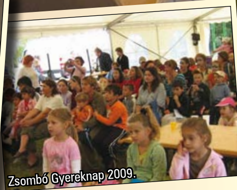
Zsombó Gyereknap 2009.

További képek elérhetőek a www.kultura.zsombo.hu weboldal galériájában