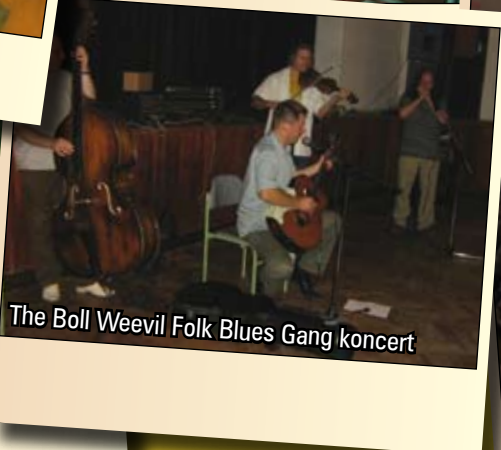
The Boll Weevil Folk Blues Gang koncert