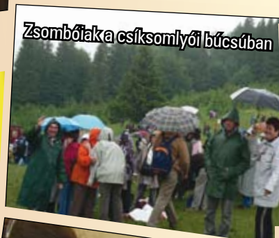
Zsombóiak a csíksomlyói búcsúban