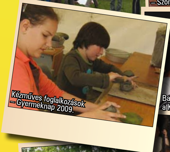
Kézműves foglalkozások – Gyermeknap 2009.