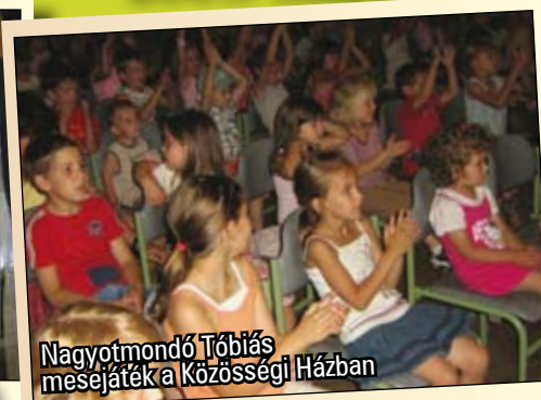
Nagyotmondó Tóbiás meséjüket a Községi Házban