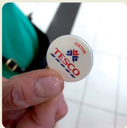
Ilyen zsetonokkal lehet szavazni.

Örömmel számolunk be két nyertes pályázatunkról. Sikerrel jártunk a madárbarát mintatelepülés felhíváson, melyet idén ősszel fogunk megvalósítani. A Magyar Madártani Egyesület és az Őrségi Nemzeti Park kőszegi szakemberei koordinálásával a helyi élővilágot bemutató tanösvényt és fecskespanziót telepítünk a Pós-patak partjára, madáretetőket és madárodúkat helyezünk ki a parkban, előadásokat tartunk, kiadványt készítünk. A pro-