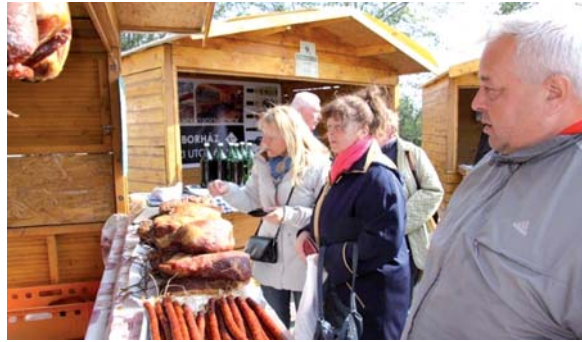
A részletek olvashatók a plakátokon, illetve a visitbuk.hu, a csepreg.hu és a naturpark.hu honlapokon. A rendező szervek az időpont- és a műsorváltoztatás jogát fenntartják.

Július 3-án, 10-én, 17-én, 24-én és 31-én pénteken 15 órától Bükön, a Koczán-házban és az előtte lévő rendezvényterén (Széchenyi u. 42.): Termelői Piac.