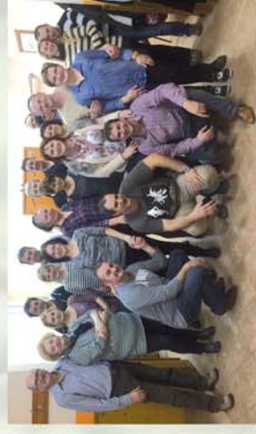
■ Táncolnak a iörmördiek