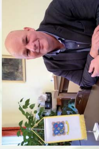
■ Ahol mernek nagyot álmodni