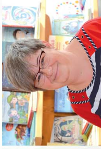
■ A munka szakmai elismerése