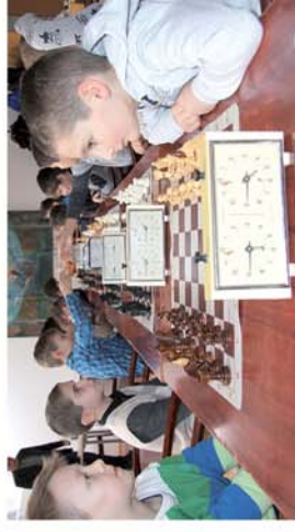
■ V. Répce ifjúsági kupa

Naponta friss híreka www.repcevidek.hu weboldalon!