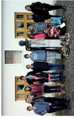
■ Határtalanul a Fejvidéken