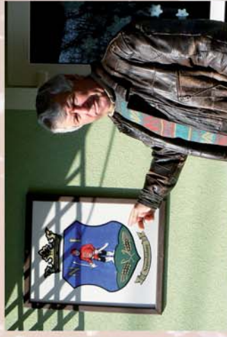
■ Kis falu sok tujával és nagy fervekkel