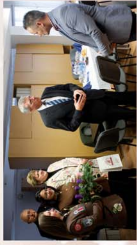
■ Adventre hangolódva