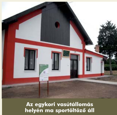
Az egykori vasútállomás helyén ma sportöltöző áll

1918 után két évig szünetelt a forgalom, majd mint határátkelő-forgalom indult meg újra. 1933-ban a határátkelő vasúti forgalom véglegesen megszűnt. Ezután a vonat Répcevis és Sárvár között közlekedett. 1974-ben egy kormányhatározat értelmében több vasútvo-