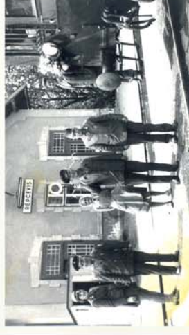
■ 100 éves lenne a Sárvár-Bük- Répcévis-Közégy vasútvonal