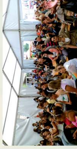
■ Simaság falunap