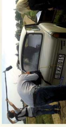
■ Filmforgatás Gyálakán és Répcévisen