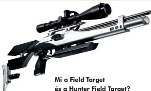
Mi a Field Target és a Hunter Field Target?

A verseny augusztus 25-én 10 órakor vette kezdetét a Zsirai lőtérén, és a kora délutáni órákban ért véget, szerencsére az időjárás is csak ezután fordult rosszabbra. A versenyszámok a következőkből álltak: Field Target, Hunter Field Target, valamint sziluet kategória. A szervezők felállítottak egy egész nap használható élmény lövészpályát is ahol bárki, versenyen kívül kipróbálhatta az ügyességét teljesen ingyen. Az ország különböző pontjairól érkeztek nevezők a versenyre. A résztvevők, illetve a különböző kategóriák első öt helyezettje között díjazás is volt, köszönhetően a támogatóknak. A fődíj egy Weihrauch HW97K légpuska volt, ami a verseny végén került ki-sorsolásra. Ezen kívül az angol Sportsmatch, a cseh JSB Diabolo és az amerikai Crosman cég is ajánlott fel díjakat. Minden nevező emléklapot, minden kategória első három helyezettje érmet és oklevelet kapott. Ezen kívül tombola-sorsolással sok-sok ajándék közül választhattak a szerencsések.