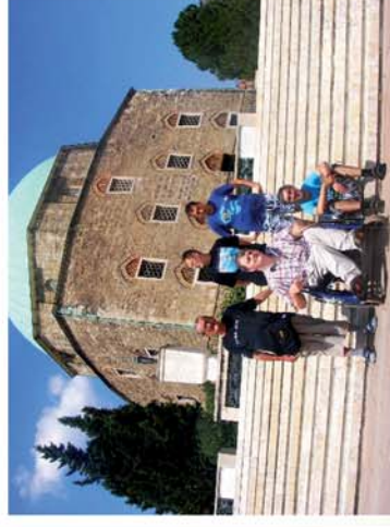
■ Zsirai nyár 2013

Naponta friss hírek a www.repcevidek.hu weboldalon!