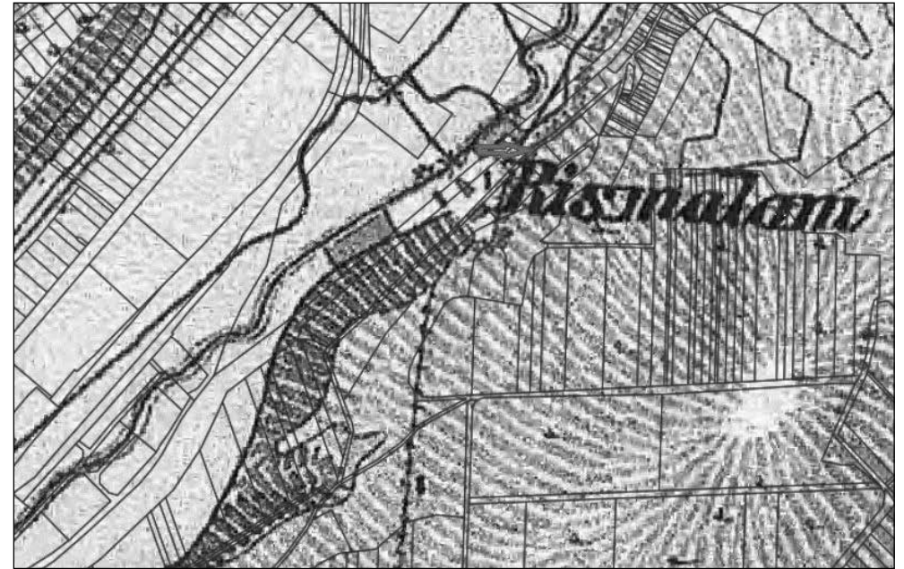
A malom a Második Katonai Felmérés térképén