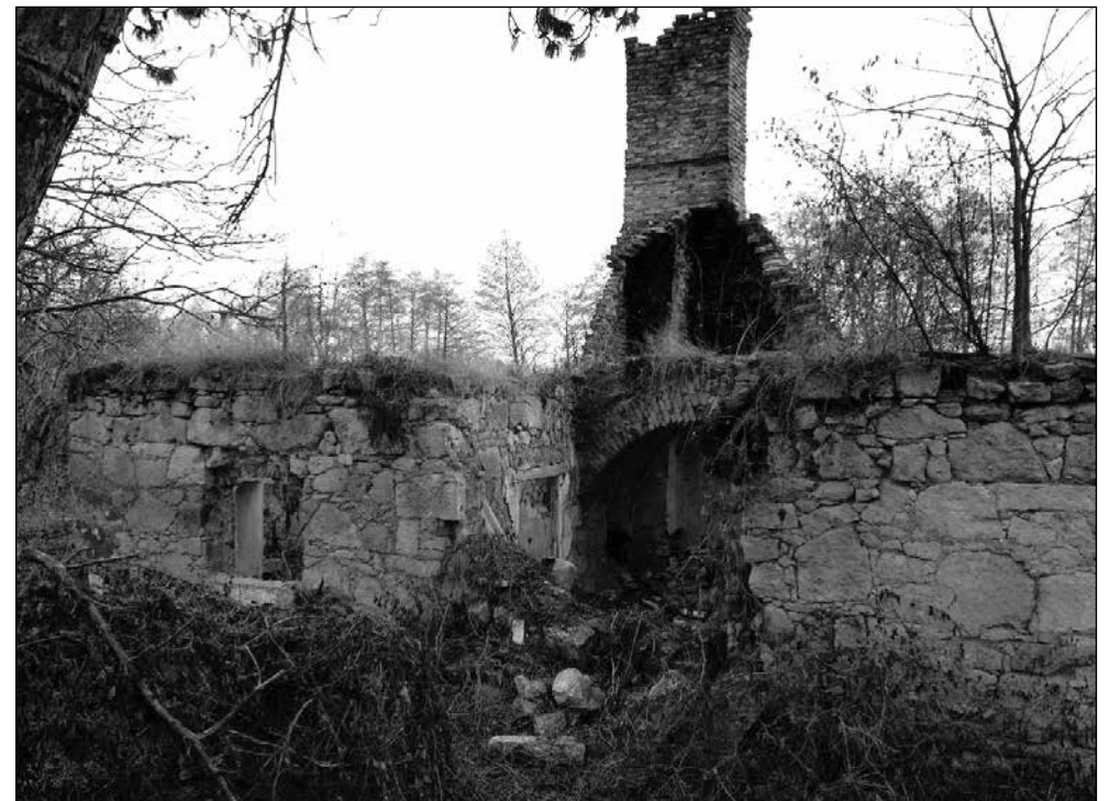
A malompépület romjai 2013-ban