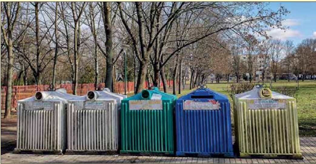
A városban több mint 20 szelektív hulladékgyűjtő sziget található

Sokan igyekeznek Békéscsabán tudatosan odafigyelni a környezetükre, részben azzal, hogy próbálnak kevesebb hulladékot „termelni”, részben pedig úgy, hogy a hulladékot szelektíven gyűjtik. Az önkormányzat fejlesztéseinek is köszönhetően a városban évről évre bővülnek a lehetőségek a szelektív hulladékgyűjtésre.