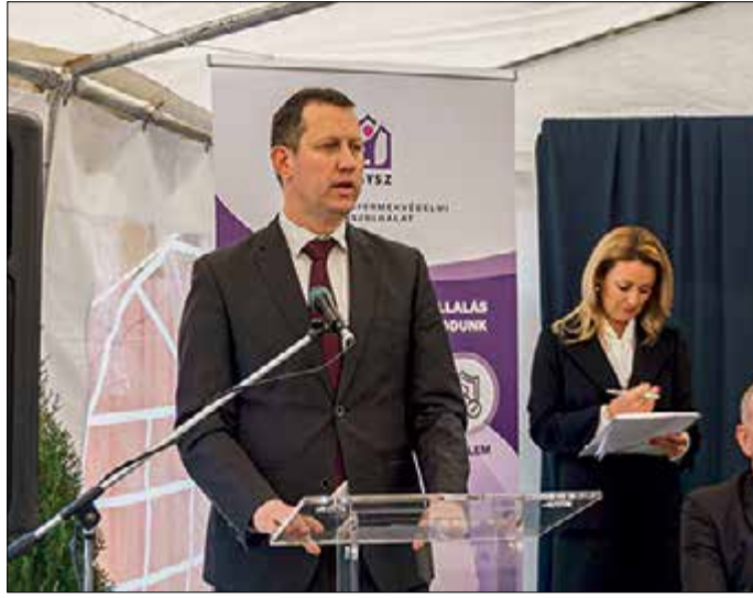
Fülöp Attila gondoskodáspolitikáért felelős államtitkár (képünkön) hangsúlyozta, hogy a gyermekvédelemre nagyobb szükség van, mint valaha. Mindenképpen meg-

Görgényi Ernő, Gyula polgármestere emlékeztetett, hogy egy-egy kihallgatás vagy tanúvallomás a felnőtteknek is komoly próbatételt jelent, nem hogy egy gyermek számára. Így különösen fontos, hogy azt megfelelő körülmények között tegyék meg. Kovács József, a térség országgyűlési képviselője arról beszélt, hogy a parlament 2021-ben módosította az 1997-ben elfogadott gyermekvédelmi törvényt, többek között azért, hogy a terápiás központok megfelelően működhessenek.