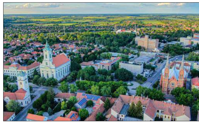
Országosan kiemelkedő Békéscsaba ösztámogatása