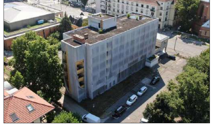
„Azon dolgozom, hogy a szállót ősz végéig elbontsák”

– Múlt évben 1,38 milliárd forint kormányzati segítséget kapott az önkormányzat a járvány miatti bevételkiesések kompenzálására, emellett mintegy 603 millió