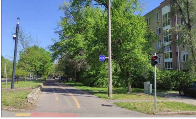
Tíz újabb térfigyelő kamerát helyeztek el

– A lomtalanításkor – mivel veszélyes hulladék – nem viszik el az elektronikai eszközöket, tehát nem is volt szabad azokat kitenni. A Kétegyházi úton rövidesen épül egy hulladékudvar, ekkor viszont lehetővé válik a veszélyes hulladékok kulturált, és a jogszabályoknak megfelelő elhelyezése. Azért, hogy a feleslegessé