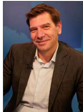
„Az ellenzék együttműködés esetén erőt mutat fel”

Az előválasztáson való indulást firtató kérdésre