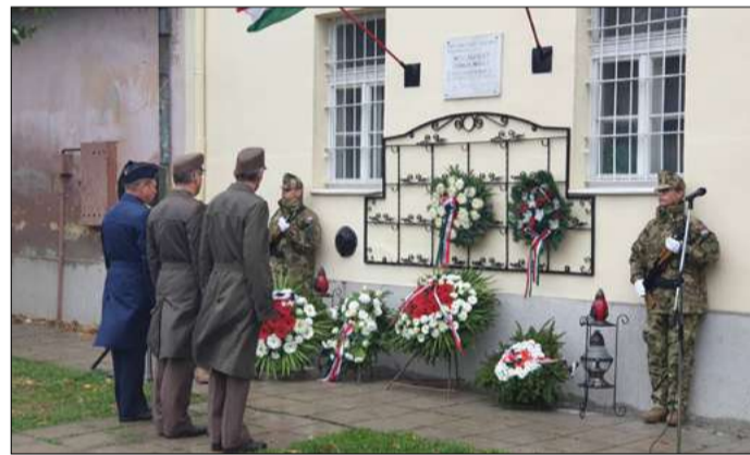
Az egykori laktanya épületénél emlékeztek