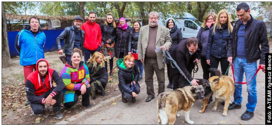
A színházban mindig is kiemelt szerepet kapott a karitatív tevékenység

A Békéscsabai Jókai Színház Lessing úr projekt címmel figyelemfelhívó és adománygyűjtő akciót indított október 30-án délután a Csabai Állatvédők Közhasznú Egyesület munkájának segítésére.