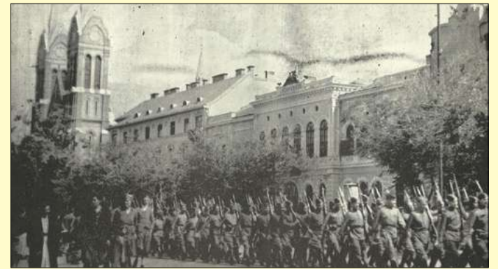
A Szovjet Hadsereg bevonulása Békéscsabára 1944. október 6-án

Mintegy két hét múlva, október 5-én este és éjjel után is pergőtűz adott le a város