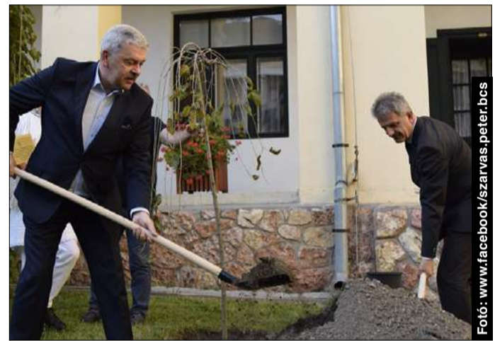
A városháza udvarára emlékfát ültettek az évfordulón