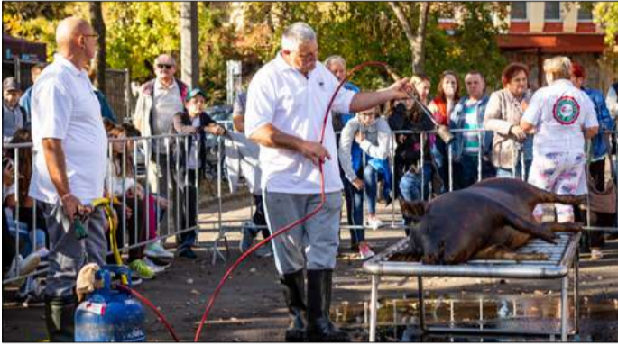
Voltak, akik életükben először itt láttak disznóvágást