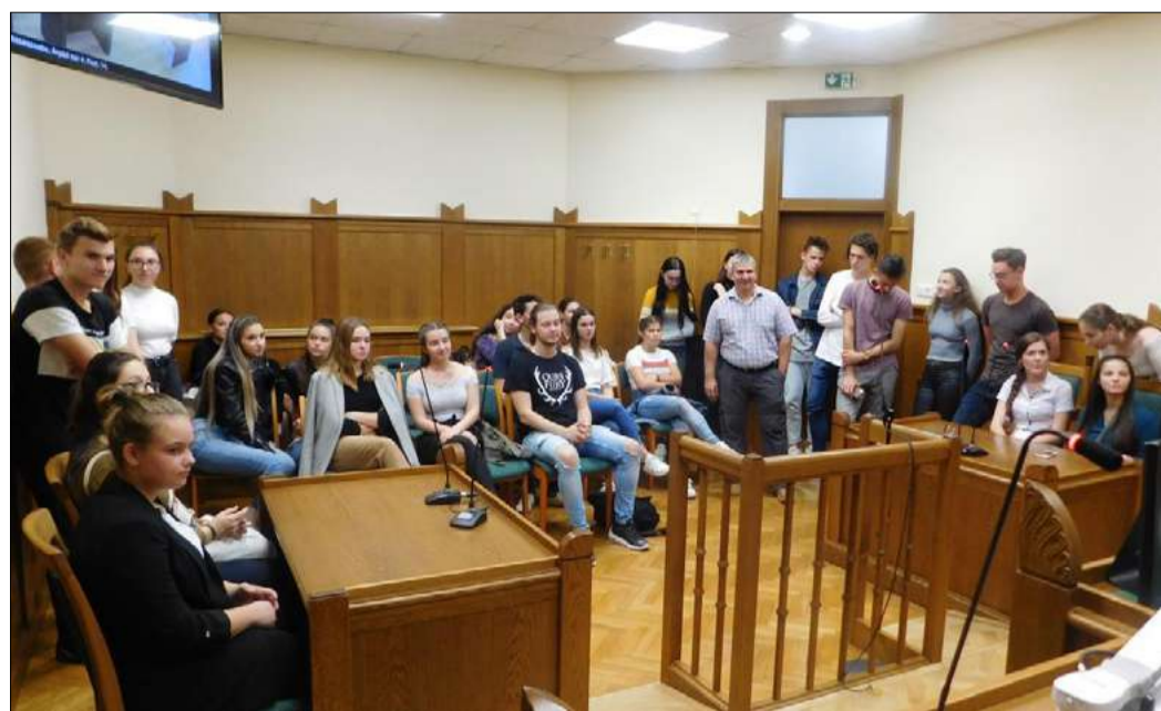
A diákok körbejárhatták a bírósági épületeket, megismerkedhettek értékeikkel

A Gyulai Törvényszék a társadalmi szerepvállalás jegyében kiemelten fontosnak tartja, hogy a diákok hiteles és közérthető tájékoztatást kapjanak a jogi témákban. Ennek megfelelően a rendezvény már évek óta kiváló lehetőséget