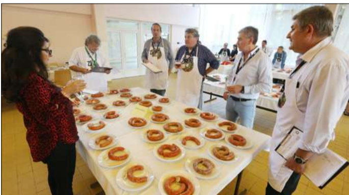
A zsűri kívül-belül megvizsgálta a mintadarabokat