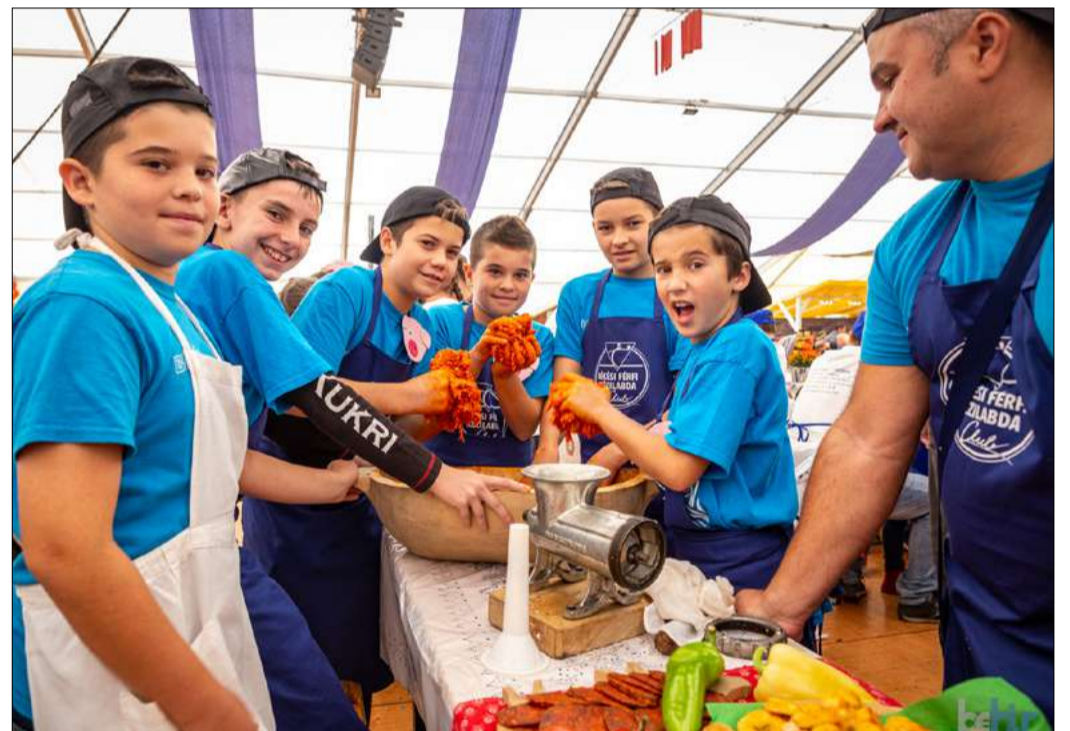
A hagyományok továbbélésének a záloga, hogy itt már a gyerekek is kolbászt készítenek