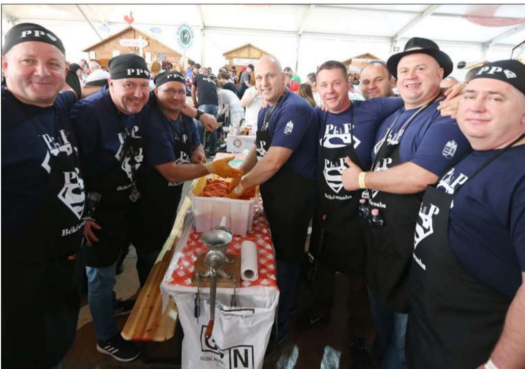
Sporttársak, baráti társaságok, cégek, családok adták össze tudásuk legjavát