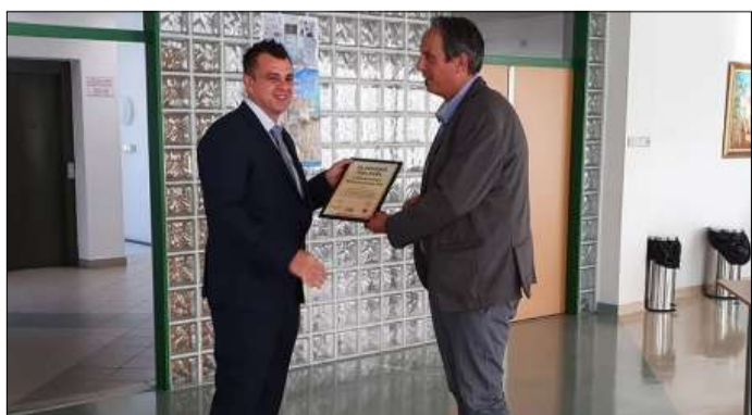
A Békéscsabai Médiacentrum is oklevelet kapott