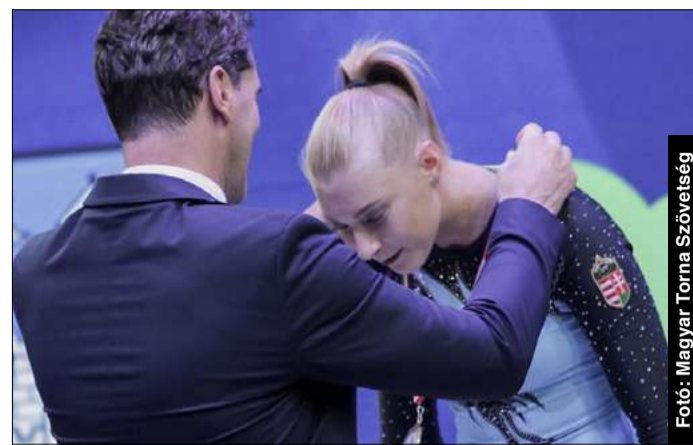
A szombathelyi Világkupán gerendán nyert aranyérmét

– Nagyon nagy összhangban tudunk dolgozni, és segítjük egymást. Egy jó kis csapat utazott ki a világbajnokságra. Sajnos nem sikerült, amit elterveztünk, mert a