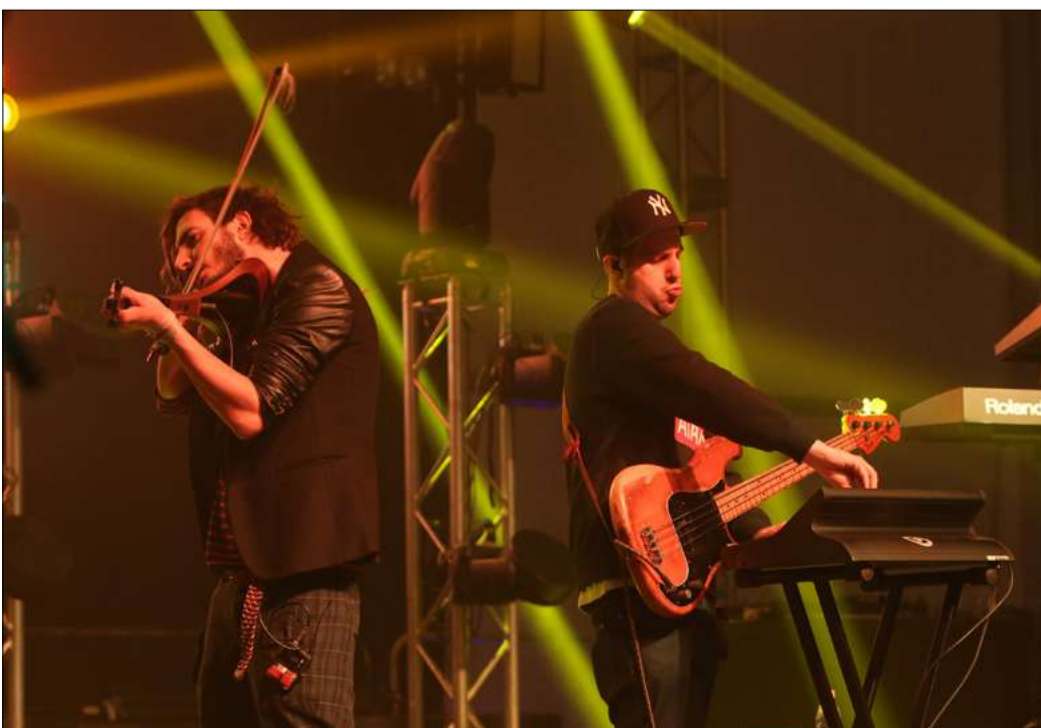
A fesztiválon igen gazdag volt a programkínálat is, koncertet adott például a Punnany Massif