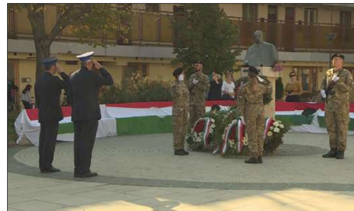
Koszorúzás a Nagy Imre téren