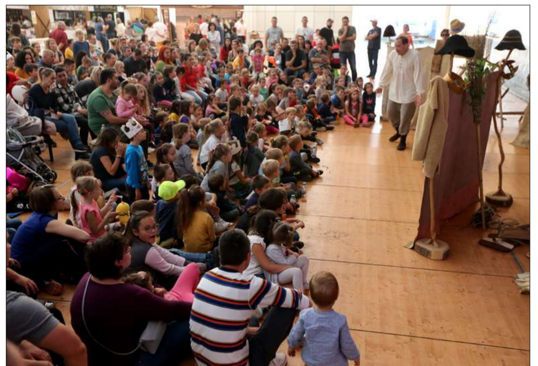
A vasárnap a gyerekek és a családoké volt, bábszínházzal koncertekkel és programokkal várták őket