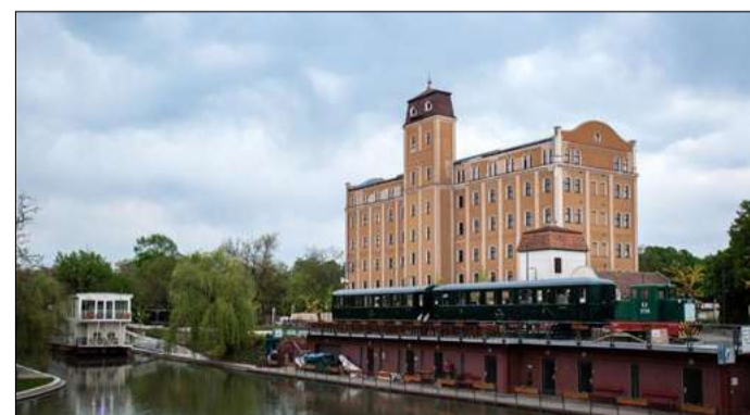
Tiit Tamme fotója egyik kedvencéről az István malomról