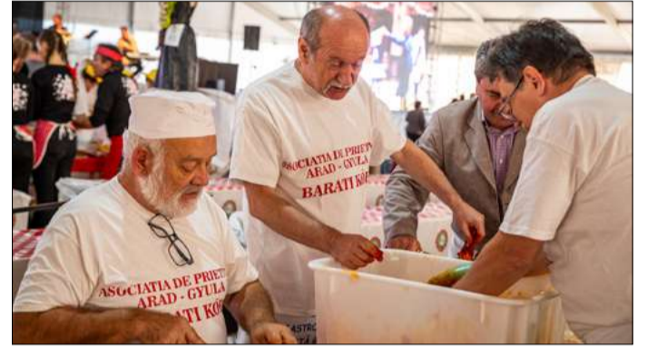
A nyugdíjasok és a civilek is kolbászt töltöttek