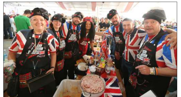
A Bristol Bangers tagjai Bristolból jöttek gyűrni