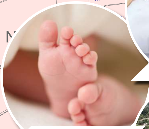
CSABABABA PROGRAM BEVEZETÉSE