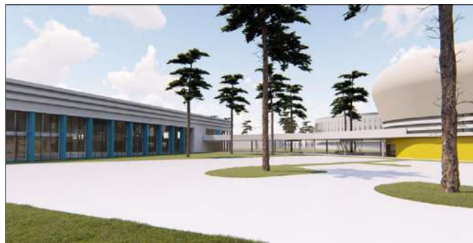
Új sportcsarnokot és sportuszodát is terveznek