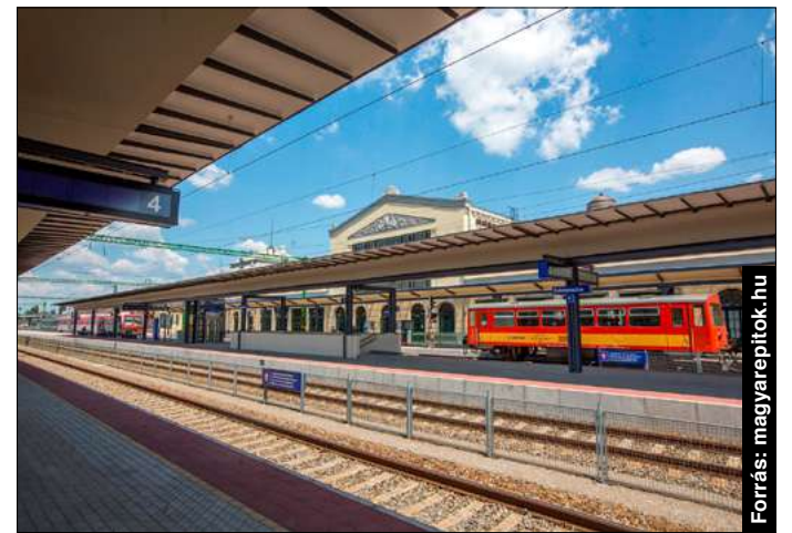
Kiemelt fontosságú volt a vasútfejlesztés

dasági igényt is szolgál az M44-es gyorsforgalmi út megépítése. Hosszú évtizedes várakozásokat követően ma már eredményekről tudunk beszámolni. 2019. október 2-án egy jelentős, mintegy 62 kilométer hosszú szakaszt helyeztek forgalomba Tisza-