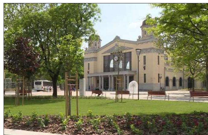
Könnyű volt megszokni a megújult vasútállomást