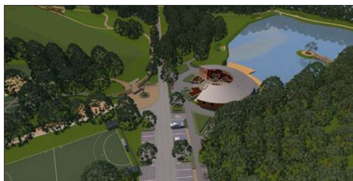
A Körte-sor felőli tóra látványosságokat is terveznek