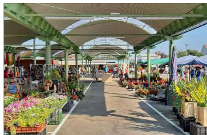
TOP-keretből szépült meg a csabai piac