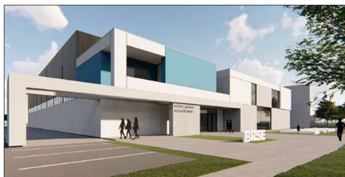
A röplabda akadémia látványterve