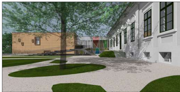
A Békéscsabai Napsugár Bábszínház új helye