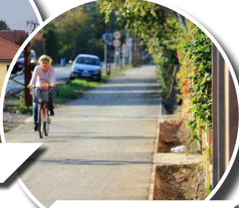
KERÉKPÁRÚT FÉNYES FELÉ