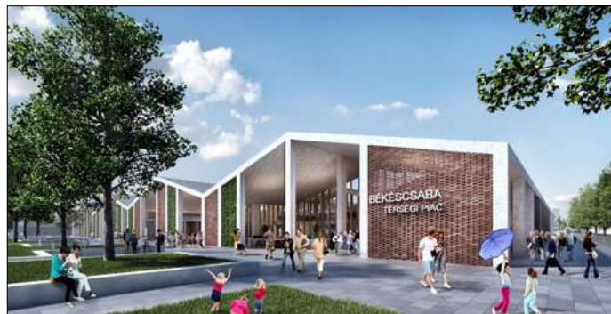
Ilyen lehet a térségi piac pár év múlva