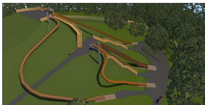
A CsabaPark csúszdaparkjának látványterve

Szarvas Péter polgármester szerint a sok-sok kemény munka eredményeként a most lezárult ciklust (2014–2019) a fejlesztések jellemezték. A polgármester röviden így értékelt: