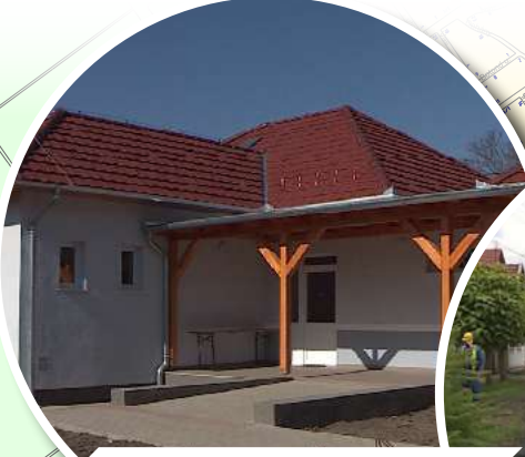
KOSSUTH UTCAI IDŐSEK KLUBJA