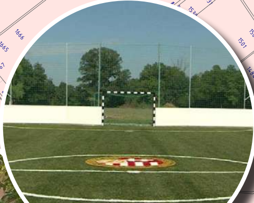
LENCSÉSI ÁLTALÁNOS ISKOLA MŰFÜVES PÁLYÁJA