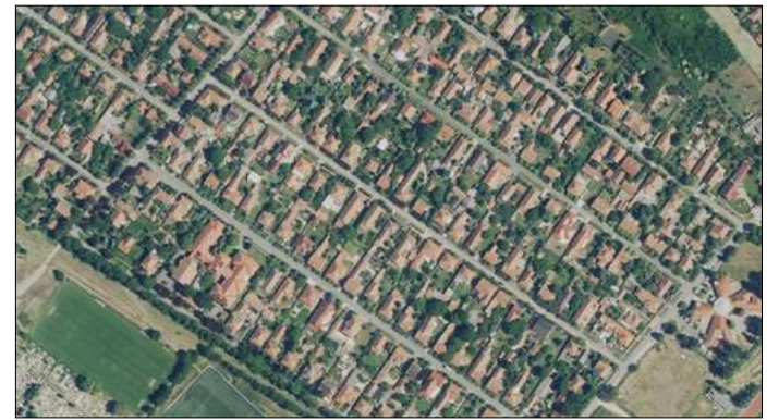
A mai lakótelep 2017-ben készült légi felvételen

A Széchenyi liget mögött a körgát tövében 1926-tól új városrész, a Bakucz-telep kezdett épülni a város VI. kerületében. Napról napra kisebb-nagyobb családi házak nőttek ki a földből. A Bakucz-telepen az első szakaszban 117 ház épült fel. Az ideépítkezők azt remélték, hogy az új városrész hamarosan a város büszkesége lesz. Csakhogy az új telepen a közművek bevezetése nem tartott lépést az építkezéssel. Az új városrésznél 1928-ban még nem volt közvilágítás. Este éjjel a lakosság sötétben botorkált hazafelé, vagy lámpásokkal világította meg maga előtt az utat. A Bakucz-telep utcáin járda sem volt, így egy kiadós