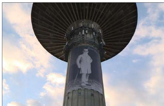
Békéscsaba Munkácsy városa, ezt molinó is hirdeti