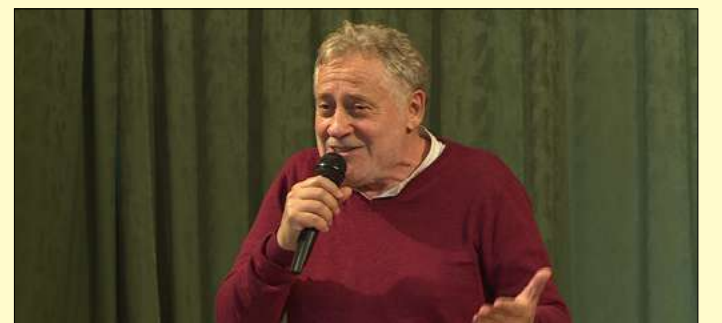
Koltai Róbert Jászai Mari-díjas színművész