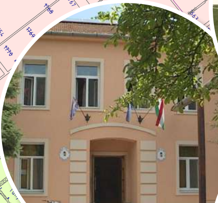
JANKAY ÁLTALÁNOS ISKOLA