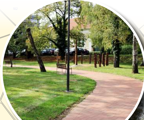
ARADI VÉRTANÚK LIGETE