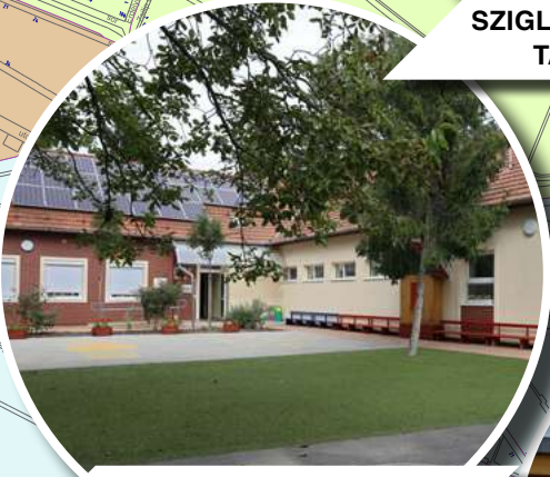
KÖLCSEY UTCAI ÓVODA