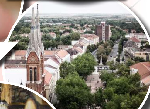
BÉKÉSCSABA HAZAVÁR PROGRAM BEVEZETÉSE