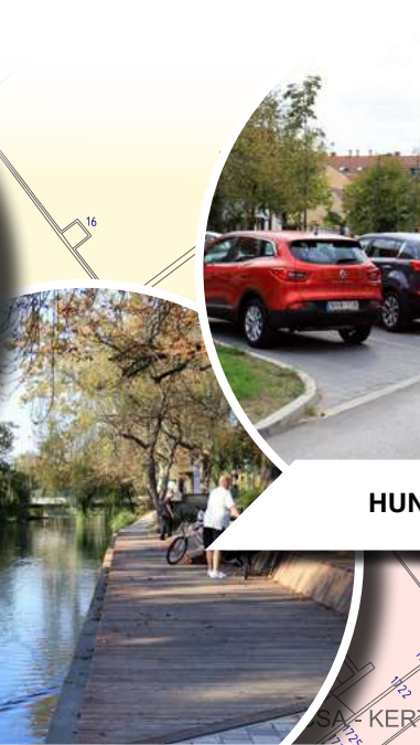
ÁRPÁD SORI KIÜLŐ