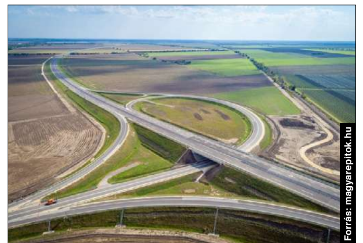
2021-ben elkészül a Kondoros–Békéscsaba szakasz is

Összegezve az elmúlt önkormányzati ciklust, elmondhatom, rengeteg kemény munka áll mögöttünk, jelentős eredményekkel.”