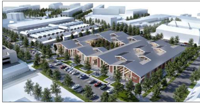
Az MVP részeként még ötmilliárdot szánnak a piacra