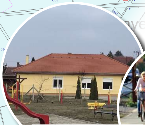
FÉNYESI JÁTSZÓTÉR ÉS FITNEZSPARK