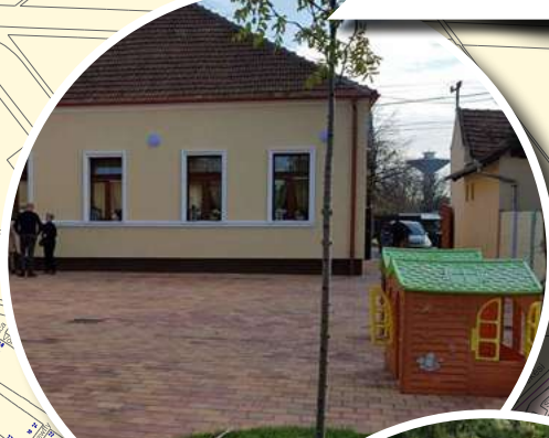
LENKEY UTCAI ÓVODA