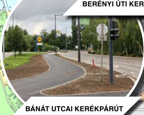
BÁNÁT UTCAI KERÉKPÁRÚT