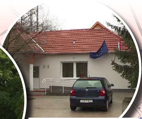
GERLAI JÁZMIN UTCAI IDŐSEK KLUBJA