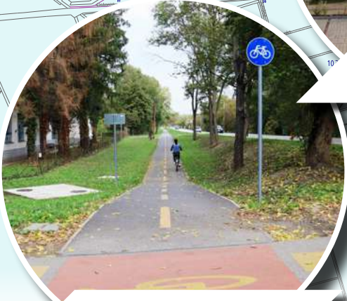
KÖRTE SORI KERÉKPÁRÚT