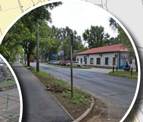
SZABOLCS UTCAI KERÉKPÁRÚT