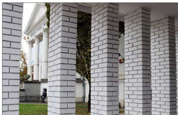
Új közösségi színtérrel bővült a múzeum