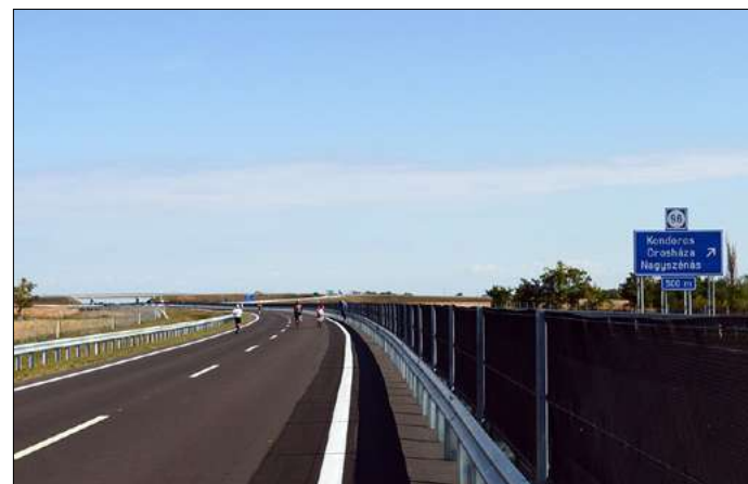
Az M44-es Békés megye legjobban várt beruházása