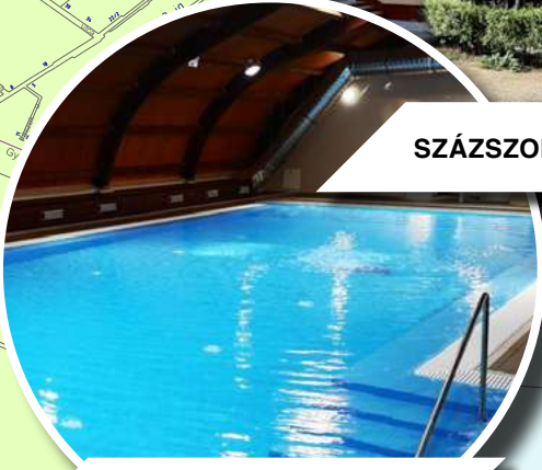
SZIGLIGETI UTCAI ÓVODA TANMEDENCÉJE