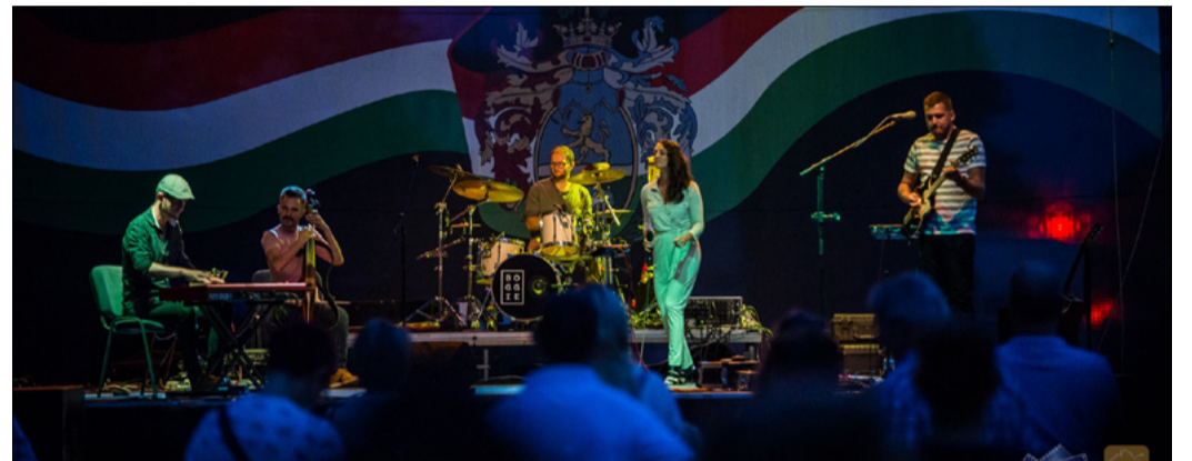
Csemer Boglárka „Boggie” énekes, dalszerző évek óta a hazai zenei élet szereplője