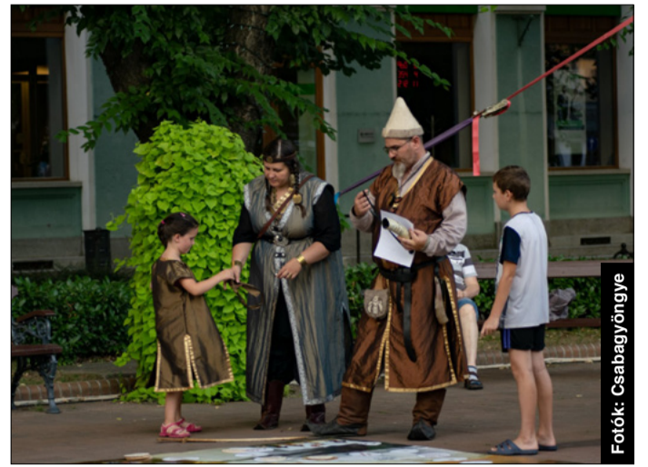
Az Arany János művelődési ház játszójához

A küldetés sikerült, sokan voltak kíváncsiak a programokra, amelyek pezsgést, színt vittek idén is a nyári estékbe.