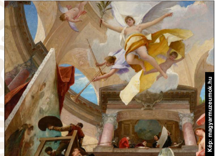
Munkácsy A reneszánsz apoteózis című művét a bécsiek rendelték

A két – nagyformátumú gondolkodással és érzelmi felfokozottsággal jellemezhető – művész, Munkácsy Mihály és Liszt Ferenc barátságának alapja az a szellemi rokonság volt, amelyet Zichy Mihály egy levelében lényegre törő egyszerűséggel így foglal össze: Munkácsy = Liszt. Barátság és tisztelet fűzte őket egymás-