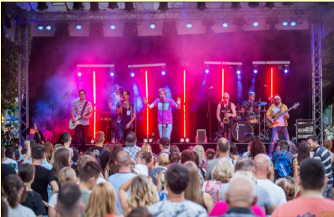
The Biebers-koncert Puskás Petivel