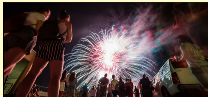
A rakétákat a családsegítő tetejéről lötték fel