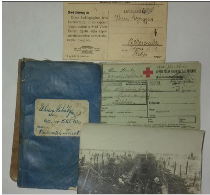
Az orosz hadifogság emlékei 1920-ból

Családi hagyatékkal gyarapodott a múzeum