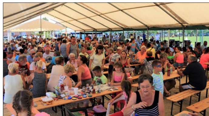
A hőség ellenére egész nap nagy volt a nyüzsgés