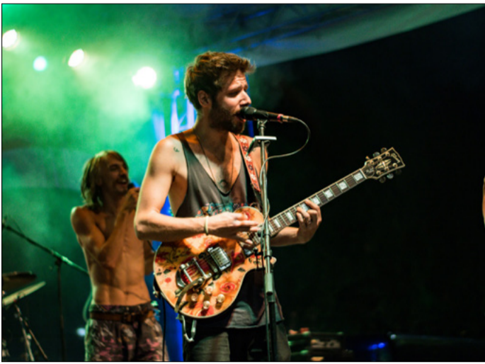
A Bohemian Betyars speed-folk-freak-punkos estje

Közel negyven program két helyszínen: idén is változatos programokat kínált a csabaiaknak és az ide-érkezőknek július 18-a és augusztus 30-a között a Főtéri Nyár a Szent István téren, illetve a Csabagyöngye melletti stégszínpadon.