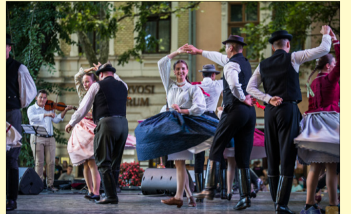
A Csaba Nemzetiségi Néptáncgyűttes is fellépett