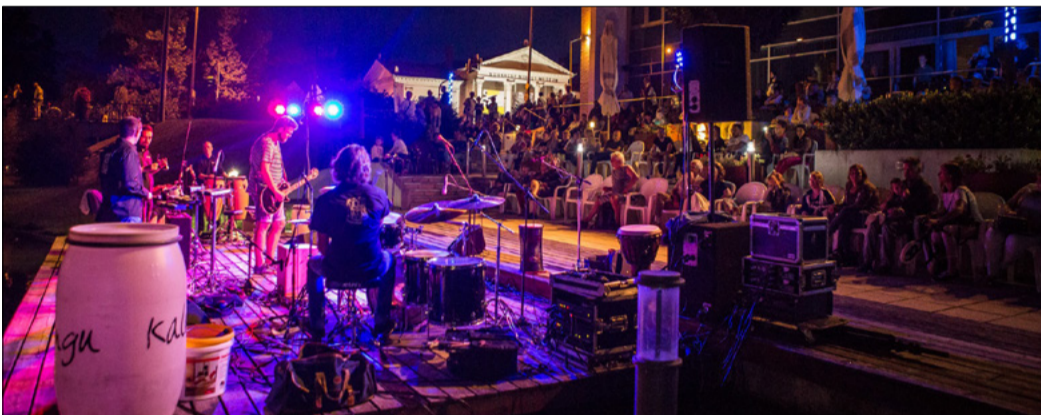
A Csabagyöngye melletti stégszínpad a fellépőknek is különleges élményt adott