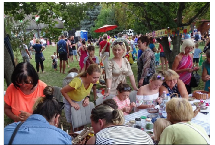
Mindenki talált magának elfoglaltságot a rendezvényen