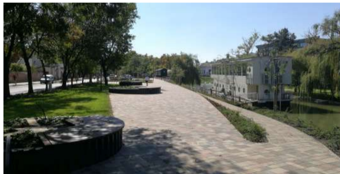
A Gőzmalom téren nőtt a pihenésre szolgáló terület