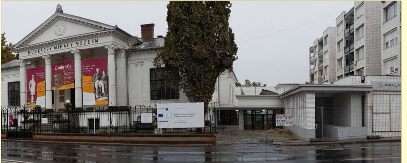
Az utolsó simításokat végzik a múzeum régi és új épületét összekötő impozáns, új kiállítóter építésén

Októberben ismét lesz tortamustra, és néprajzi konferenciát is tartanak