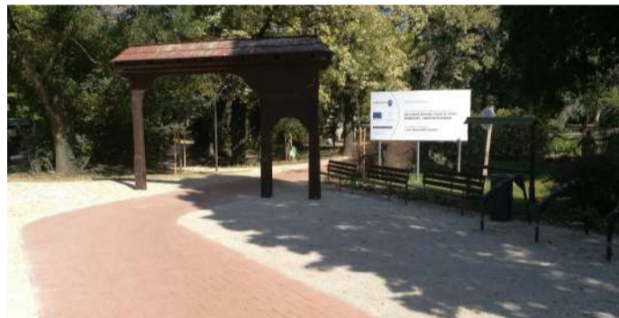
A Széchenyi liget és környezete teljesen megújult