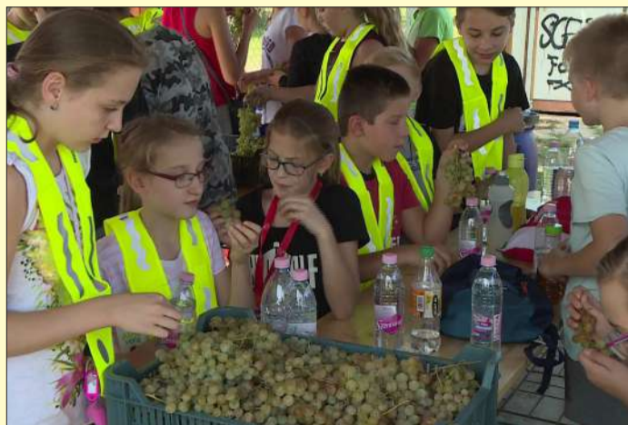
A gyerekek meg is kóstolhatták a szőlőt

Az Ismerd meg a Csabagyöngyét program keretében az Erzsébethelyi iskola diákjai látogattak el szeptember közepén a Csabagyöngye szőlőültetvényre a Békéscsabai Turisztikai Egyesület szervezésében.