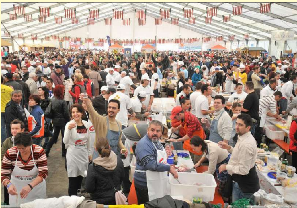
A legnagyobb attrakció az október 20-án tartandó nagy gyúróverseny lesz

Előrehozták a szárazkolbászok versenyét, hogy minél többen odafigyeljenek erre is