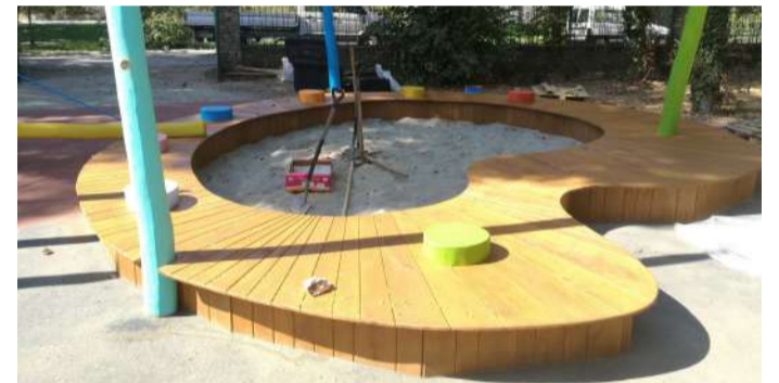
A paletta homokozó is átadásra vár