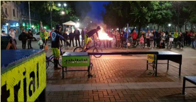
Extrém Triál bemutató a Szent István téren

Szeptember 21-én és 22-én rendezték meg Békéscsabán a Szent István téren és a Csabagyöngye Kulturális Központban a városi mobilitási napokat a kerékpározás jegyében.