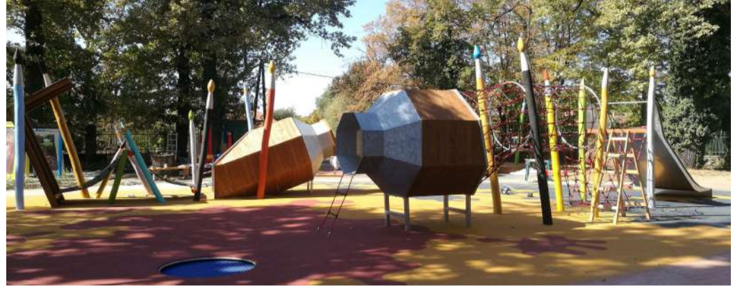
Munkácsy Mihály emlékét idézi a tubus mászóka is az új játszótéren

nyek telepítést, a parkban lévő sétautak rekonstrukcióját, tanösvények kialakítását, rekreációs elemek építését. Talán a leglátványosabb része a fejlesztésnek a meglévő játszótér felújítása és bővítése volt, színes, Munkácsy Mihály festői munkásságára emlékeztető elemekkel, például paletta alakú homokozóval, krétahintával, festéktubus alakú mászókkal, képkerekekkel. A Gőzmalom téren a