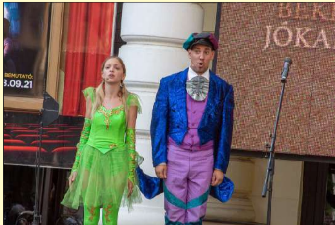
Nagy sikert arattak a zenés ízelítők