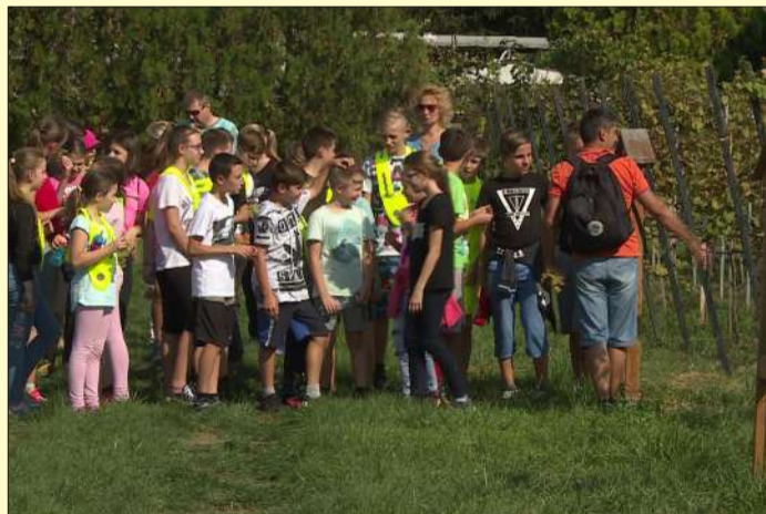
Az Erzsébethelyi iskolából negyvenen érkeztek