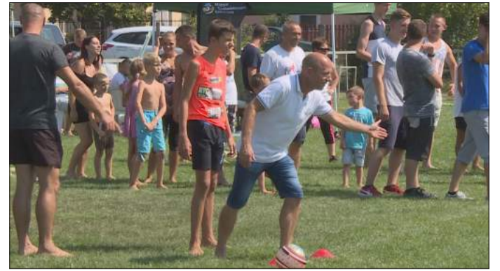
Ki-ki megmutathatta, miben a legügyesebb

Apuka, anyuka, gyerekek, sőt még pocaklakós kismama is részt vett a mezőmgyeri sportnapon azon a sorversenyen, amit kifejezetten a családoknak rendeztek. Persze ezen kívül is rengeteg játék, sport- és szórakoztató program várta a nagy melegben is igen szép számmal összegyűlt érdeklődőket augusztus 19-én a helyi sportpályán.