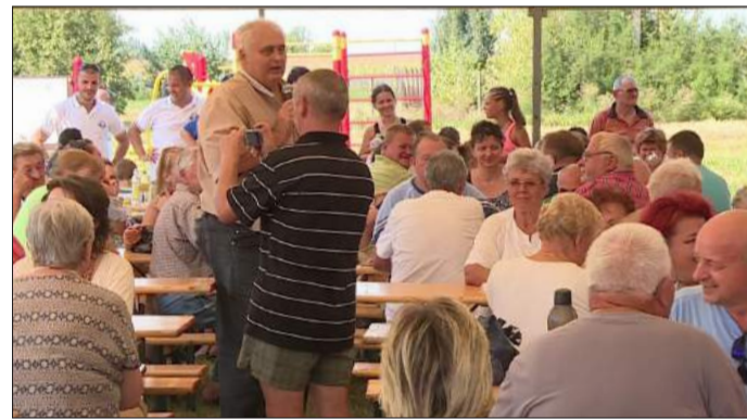
Hanó Miklós: A megyeriek szeretnek sportolni