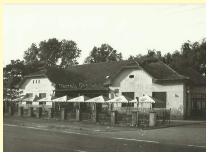
Az egykori árvaház épülete, itt már Veszely Csárdaként

Nyolcvan évvel ezelőtt, 1938 nyarán egy szép ünnepség keretében avatták fel az