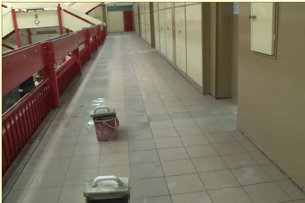
A Lencsési iskolában kicserélték a negyvenéves burkolatot is

Véget ért a nyári szünet, a pedagógusok, a szülők és a diákok már javában az iskolakezdést várják. Az intézményekben a felújítások után a tantermeket rendezték vissza, a családok a nyakukba vették a papírírószer boltokat és a Gyermekélelmezési Intézmény is az új tanévre készült.