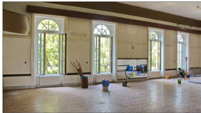
Energiatakarékosabb, korszerűbb lesz az épület

A beruházás 2019 nyár végére fejeződhet be, de a képzések a korszerűsítés közben is zajlanak a Balassiban.