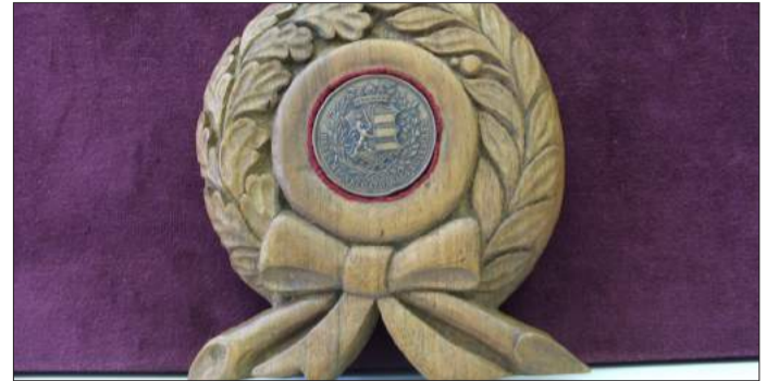
A Békésmegyei Gazdasági Egyesület egyik emlékérméje

Az 1860-as év rendkívülinek számított Csaba életében, hiszen ekkor alapították meg a Békésmegyei Gazdasági Egyesületet. Az alapszabályzatban megfogalmazták a legfontosabb célokat, az ahhoz szükséges szellemi és anyagi eszközöket, valamint kitértek arra is, hogy ki lehet tag és az egyesület hogyan épült fel. Az egyület az akkori Békés vármegye gazdasági elősegítését tartotta szem előtt, és ehhez székhelyül Békéscsabát választották, azonban hatóköre az egész vármegyére kiterjedt. Számos eszközt felsoroltak céljuk eléréséhez, többek között a kölcsönös eszmecsere, a korral való haladásra buzdítás, olvasóörök alakítása, valamint mezőgazdasági és ipari kiállítások rendezése.