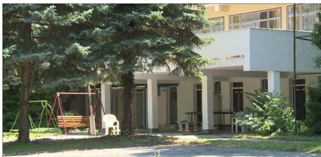
A „Közzé-üdülő” továbbra is a városé marad, a másik szárszói üdülőt értékesítik

Fidesz: A fejlesztést szolgálja az értékesítés