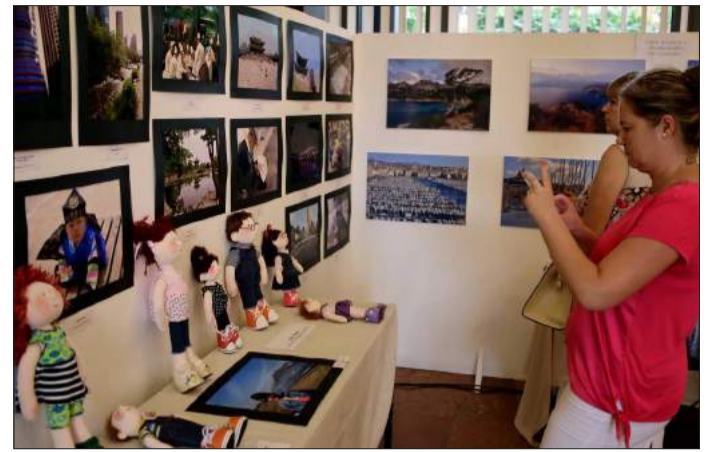
A hivatal tisztviselőinek alkotásaiból nyílt kiállítás

A Békés Megyei Kormányhivatal, a járási hivatalok és a főosztályok munkatársainak alkotásaiból rendezett tárlat nyitotta meg kapuit augusztus 1-jén a kormányhivatal Derkovits sori épületének földszinti aulájában. A kiállítás keretében 21 állami tisztviselő több mint 200 alkotással mutatkozott be a nagyközönségnek. A kiállítást hivatali időben az elmúlt napokig lehetett megtekinteni.