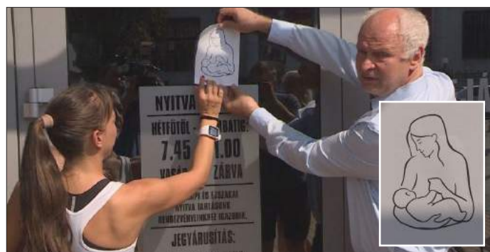
Elsőként a Csabagyöngyére ragasztották ki a matricát