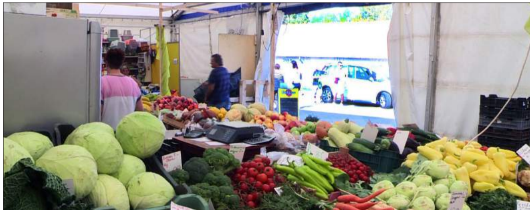
A kinti, pavilonokra osztott sátrat most szokják az eladók és a vásárlók