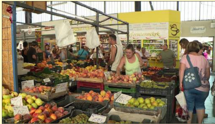
A vásárcsarnokban augusztus 18-án még vásárolhattunk