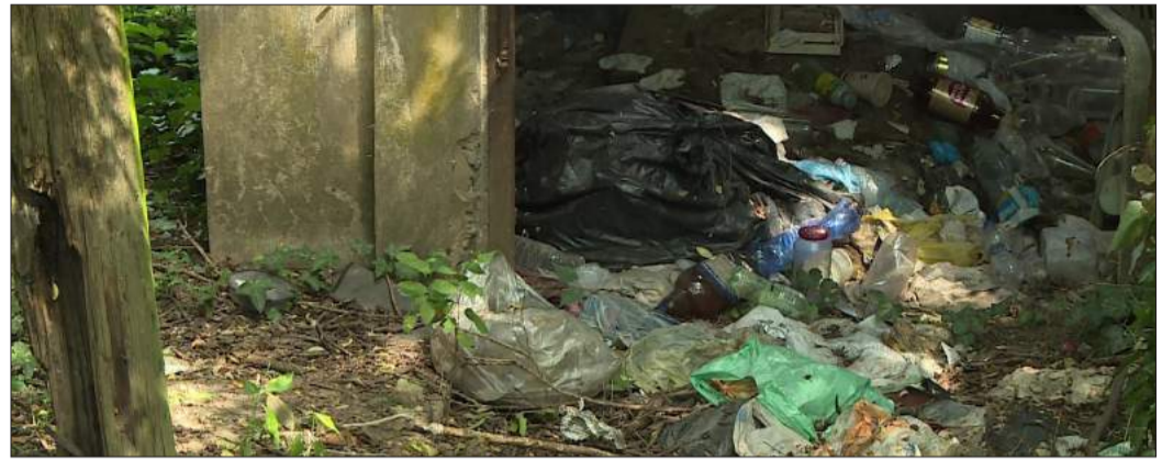
Egyre növekvő szeméthalom az Élővíz-csatorna partján

Zavaró szagok, környezet-szennyezés és szeméthygek – csak néhány azok közül a negatívumok közül, amelyeket egy illegális hulladéklerakó okozhat. Ez a probléma országszerte, így Békéscsabán is egyre nagyobb problémát jelent. Ha valaki illegális lerakót fedez fel, azt a polgármesteri hivatal felé jelentheti.