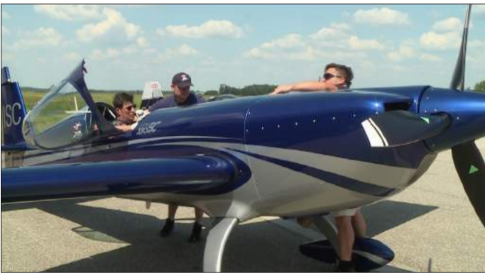
Brit pilóták gyakorlatoztak a csabai reptéren

Műrepülő gépek voltak látványosak augusztusban néhány napig Békécsaba légtérben. A románai Ploiestiben zajlott a Nemzetközi Repülő Szövetség műrepülő világbajnoksága, amelyen öt brit pilóta is indult. A légi akrobaták a bajnokság előtti héten, Csabán gyakoroltak, így bár magyar résztvevője nem volt a versenynek, kicsit belekóstolhattunk a látványosságokba.