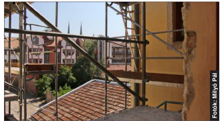
A munkák teljes befejezése jövő nyárra várható