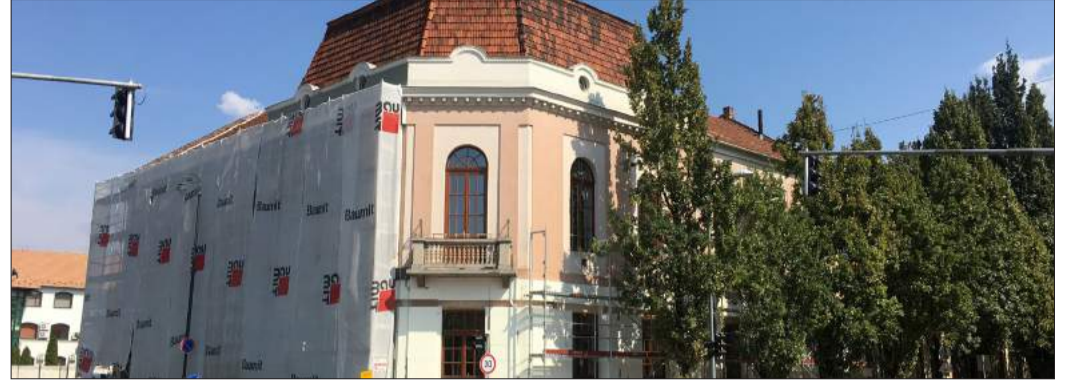
TOP-keretből, 126 millió forintból korszerűsítik a Balassi Művészetek Házát

– A kivitelező a békéscsabai székhelyű Galéria Invest Kft., velük idén májusban kötött szerződést az önkormányzat. Júniusban adtuk át a munkaterületet a részükre, a munkák azóta az ütemterv szerint haladnak. A pályázat keretében most kizárólag az épület energetikai korszerűsítése valósulhat meg,