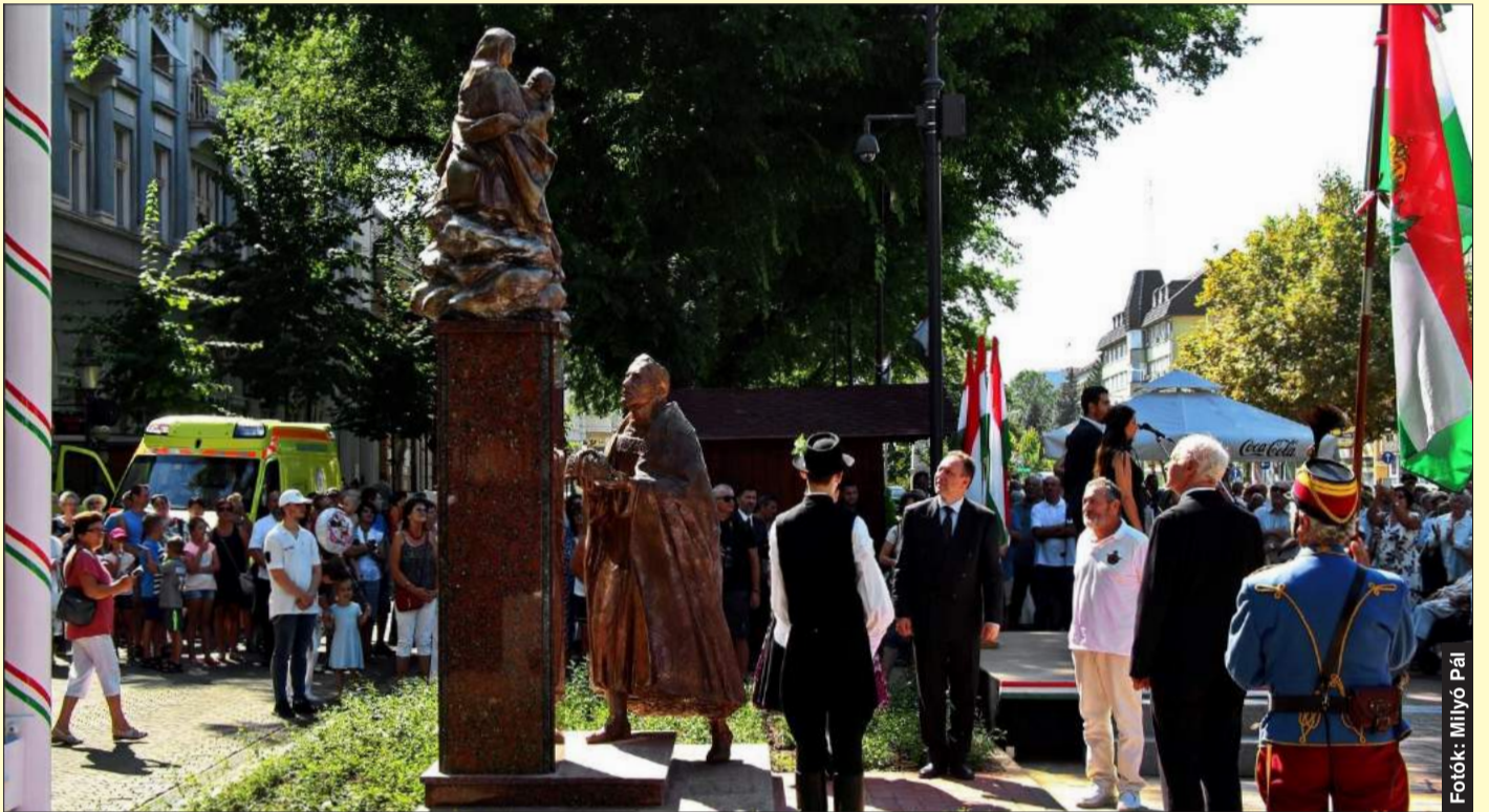
Az alkotás István királyt ábrázolja, aki a kisdied Jézust karjában tartó Szűz Máriának ajánlja fel a pápai koronát