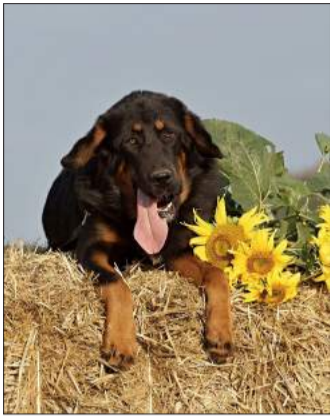
Nemcsak most, 80 évvel ezelőtt is kutya meleg volt

Az égi áldás is bőven hullott Csabára. 1938. augusztus 9-én, kedden fel 4 óra felé nagy eső ömlött a felhőkből, s két óra alatt a város utcái víztengerré váltak, az árkok színültig megteltek. Több utcában a járókelőket kellemetlen kaland érte, a gyalogjárdáról a mély árkokba léptek és hirtelen elmerültek. Ez történt a Horthy