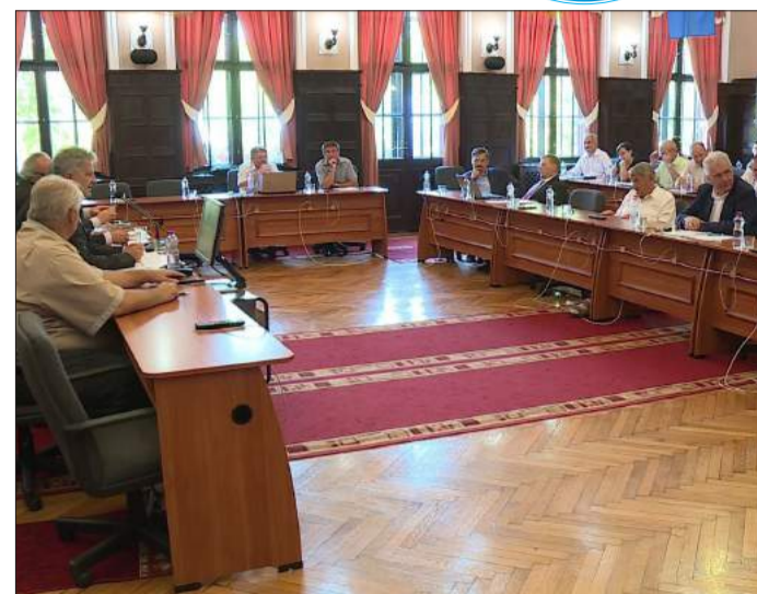
Nyilvános ülésen tárgyaltak az üdülő értékesítéséről is