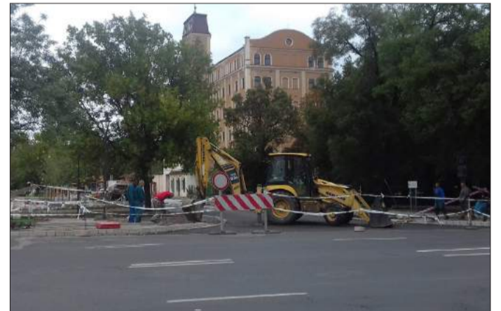
Szeptember 1-jén itt is megindulhat a forgalom