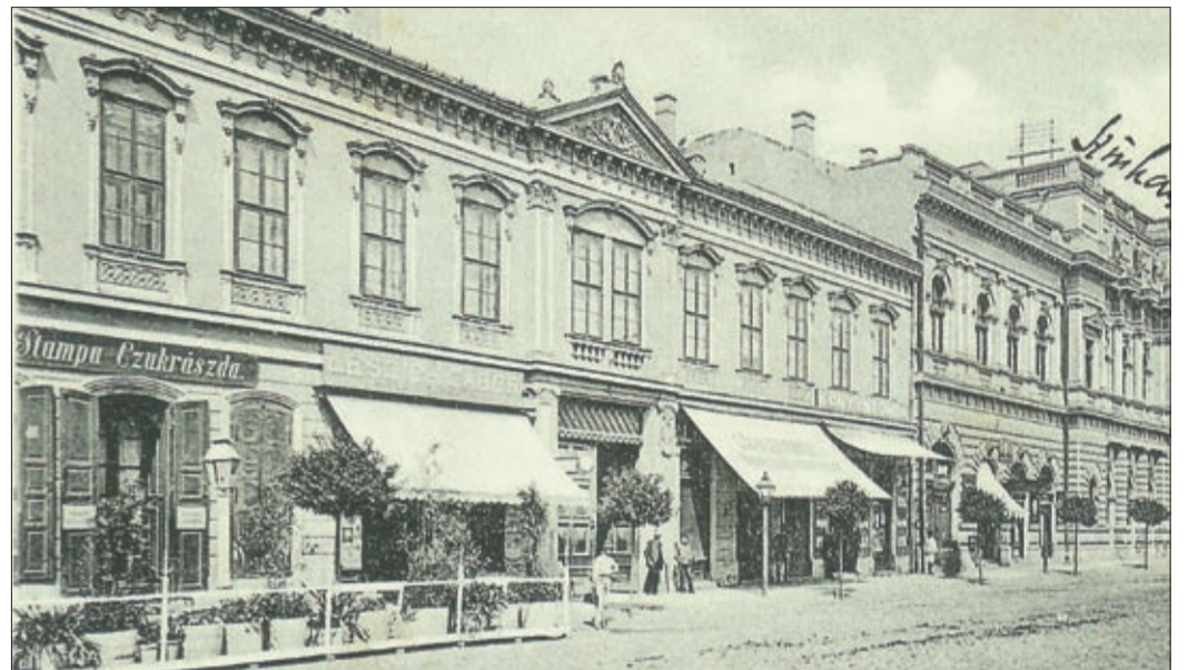
Vasút utcai életkép, 1900

A szilveszterek estjei – a vidámság évbúcsúztató órái –, a nevezetes századfordulók nem minden nemzedéknek lehetett átélhető élmény, amely új korszak kezdete volt. 1899-ben a XIX. század órák múlva már a múlté, a századvég leűnt. S friss erővel lép színre a következő – 1900, a XX. század. Mint a világ, Csaba népe is 1899. szilveszter estjén éjjelkor átélhette az új századba lépés perceit.