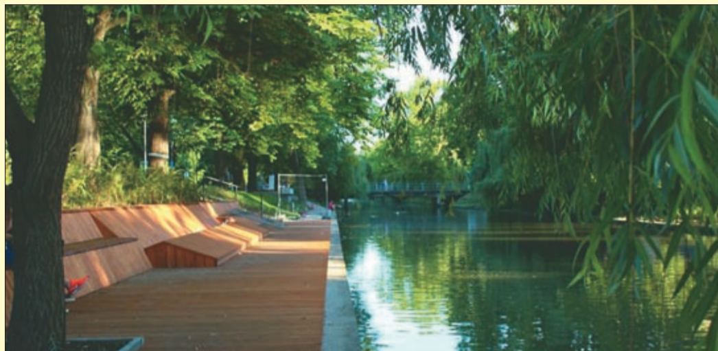
A város kedvelt helyévé válhat az Élővíz-csatorna megújult partja

Összességében hat önálló városrész szerepel a pályázatban. Ezek jobbára egymáshoz közeli, bizonyos értelem-