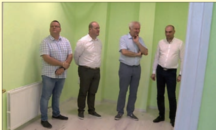
Példamutató összefogás a gyermekekért

Juniálisra várták a gyermekeket és szüleiket a Szigligeti óvodában. Az esemény keretében került sor az elkészült fejlesztőszoba átadására is.