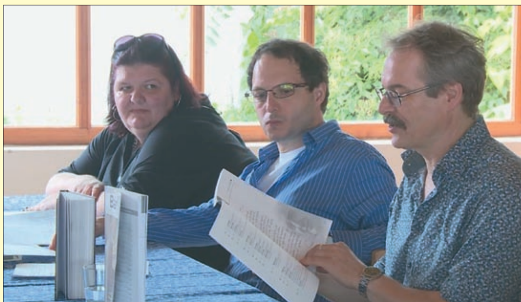
Az irodalmi délutánt a Szlovák Tájháznál rendezték meg

Idén is nagy sikerrel zajlott az Ünnepi Könyvhét, mely sorban a 89. volt. A program záróeseményét a Szlovák Tájház udvarán rendezték meg Könyvhétzáró irodalmi délután címmel, mely a Bárka, a Békés Megyei Könyvtár és a Körös Irodalmi Társaság közös szervezésében valósult meg.