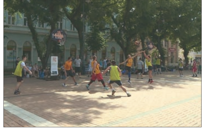
Békéscsabán 21. alkalommal várták a kosárlabda szerelmeseit

Tizenhárom pályán több száz induló mérte össze tudását az idei Streetball Fesztiválon Békéscsabán, ahová még az ország másik feléből és a határon túlról is érkeztek versenyzők. Ennek a stílusnak a népszerűségét az is jól tükrözi, hogy a streetball olimpiai sportággá női ki magát a következő világtérképekre.