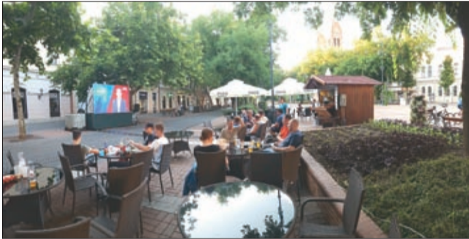
Vb-sörkert a város főtéren

Javában tart az év legnagyobb sporteseménye, a labdarúgó-világbajnokság, melynek először ad otthont Oroszország. A vb-láz kitört Békéscsabán is. Az esemény idejére a város főtéren kialakított Vb-sörkert valóságos közösségi térré vált, a mérkőzések idején megtelik szurkolókkal, akik óriás ledfalon követik az eseményeket. De nemcsak az utca embere követi a világbajnokságot, hanem a helyi közélet szereplői is. Lapunk közvélemény-kutatást végzett közöttük, hogy kit várnak végső győztesként.