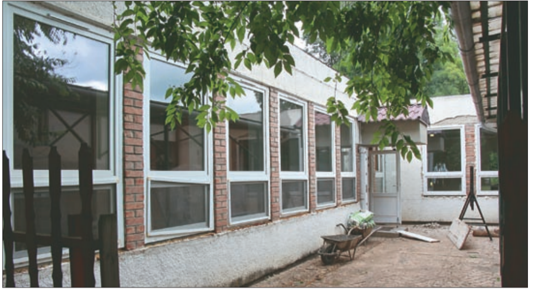
Folyik a munka a Lencsési úti óvodában