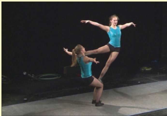
Az Artistaképző Intézet tanulói is bemutatót tartottak

Eddig csak Budapesten járhattak a diákok artista-iskolába, ám a fiatalok az új tanévben már Békéscsabán is jelentkezhetnek a képzésre. Azok a tanulók, akiket érdekel ez a világ, nyílt napon nyerhettek betekintést a kulisszák mögé.