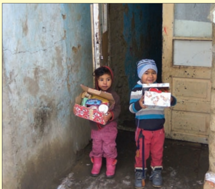
Szegénysorban élő gyerekek kapták meg a csomagokat