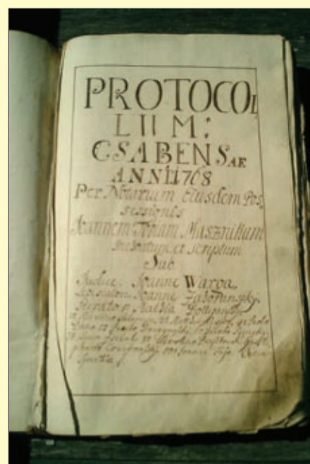
A Békéscsabai Evangélikus Levéltárban őrzött protokollum

A kártékony madarakra vonatkozólag is hasonló rendelet volt. Eszerint Csabának be kellett szolgáltatnia 4008 varjút és csókat, valamint 12 024 verebet. Hasonló rendelkezések Csaba mellett Békés, Sarvas, Orosháza településeken is éltek.