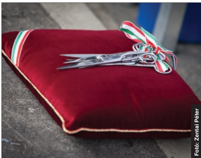
Most több mint 11,5 milliárd forint értékű fejlesztésekről született pozitív döntés

A közös cél, hogy mielőbb aláírt szerződése legyen minden nyertes pályázónak, ezután kezdődhet a munka, indulhat a pályázatok tényleges megvalósítása.