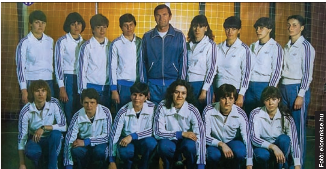
A csabai csapat, amely 35 éve ezüstérmet szerzett a Vasas mögött

Az 1982-ben bajnoki ezüstérmes csapat tagjait is köszöntötték a csabai sportcsarnokban