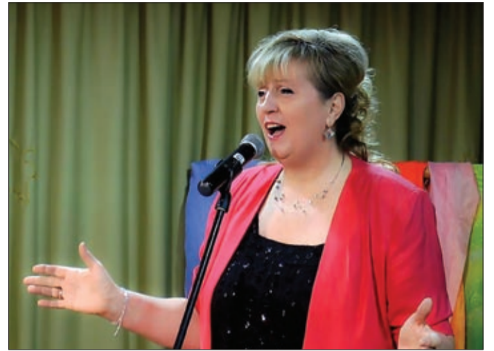
„Az előadó-művészet a lelkem fürdetése”

Közel egy évtizeden át szervezett nyári énekkari táborokat, 1996-ban pe-