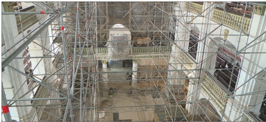
A munkák jelenlegi állása szerint tartható lesz a templom nyár végi átadása

Látványos léptekkel halad a felújítás a békéscsabai evangélikus nagytemplomban, amelynek épületét nemcsak kívül, de belül is teljes magasságban felállványozták. Az időjárás nem akadályozza a munkát, jelenleg tarthatónak tűnik a nyár végi átadás.