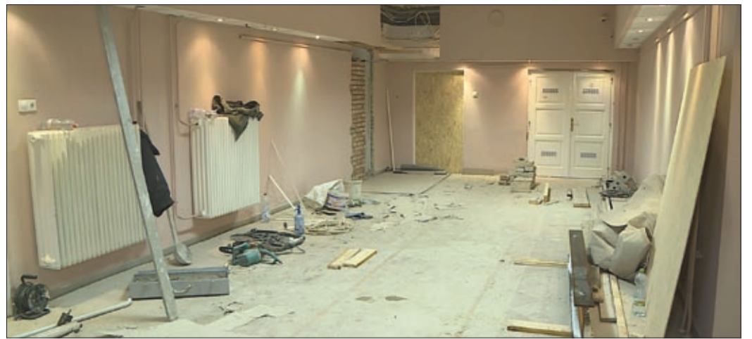
A két épület összekötésén túl a múzeum belsején is dolgoznak