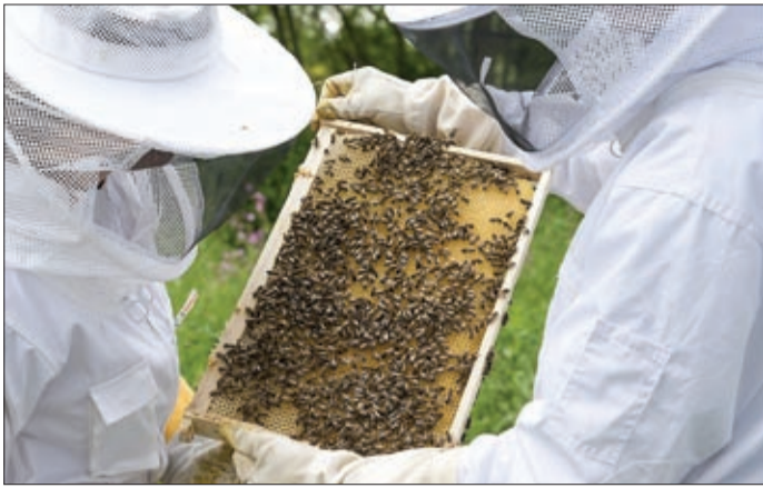
A méz a természet különleges ajándéka

A mézet, a természetnek ezt a különleges ajándékát ma is szívesen fogyasztják az emberek számtalan jótékony hatása miatt. A méz ugyanakkor a gazdasági és környezeti fenntarthatóság biztosítása tekintetében is kiemelt fontossággal bír. A termelésével és forgalmazásával kapcsolatos támogatások rengeteg lehetőséget nyújtanak a megyei méhészeknek.