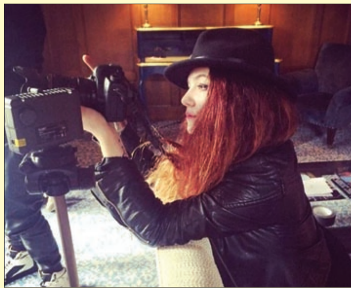
Itthon főként divattervezőkkel, zenészekkel dolgozik együtt

– A MOME-ról mentem ki először Erasmus ösztöndíjjal három hónapra Londonba. Ez az idő arra elég, hogy az ember beleszokjon az új környezetbe. Amikor hazajöttem, lediplomáztam az ELTE-n és a MOME-n, de azt éreztem, hogy visszaszólít London. Ott jelentkeztem mesterszakra, a London College of Fashion-re jártam