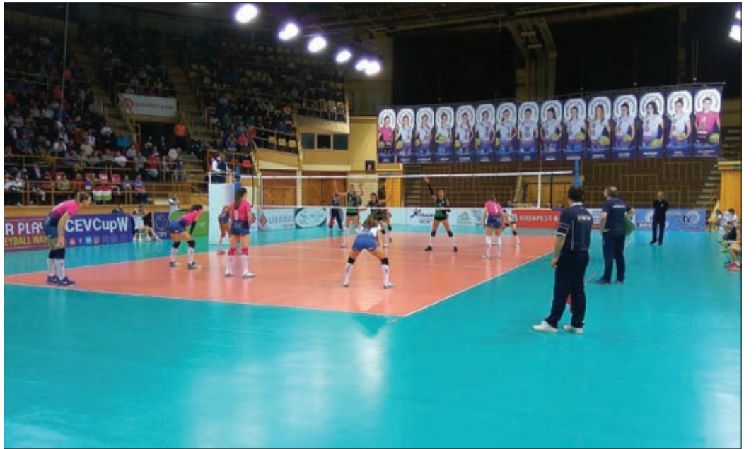
Hajrá lányok! Hajrá BRSE! Szurkol nektek egész Békéscsaba

A Casalmaggiore csapatával játszik a BRSE a 8 közé jutásért