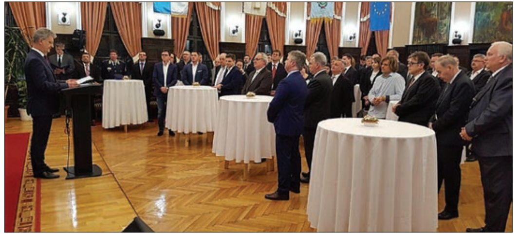
A városháza dísztermében mondtak köszönetet a cégeknek, vállalkozásoknak

A város fejlődéséhez ők is sokat tettek hozzá