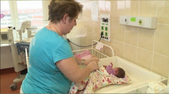
A babát alaposan megvizsgálták a kórházban