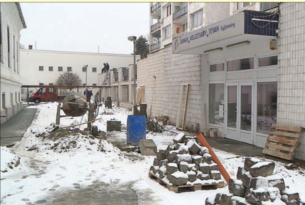
A műemléki épületet és a Jankay-gyűjteményt köti majd össze az új rész

Falakat bontanak, összekötik az épületeket, és közben új állandó kiállítást terveznek