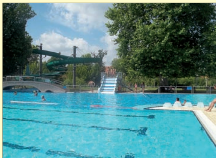
A csúszda használatáért nem kell külön fizetni

Az Árpád fürdő új élményelemmel gazdagodott: a strand élménymedencéjében családi csúszdát adtak át június 19-én. Másnap, a magyar úszás napján – amikor mintegy ezren éltek a fürdőben a délelőtti ingyenes belépés lehetőségével – sokan ki is próbálták az új eszközt.