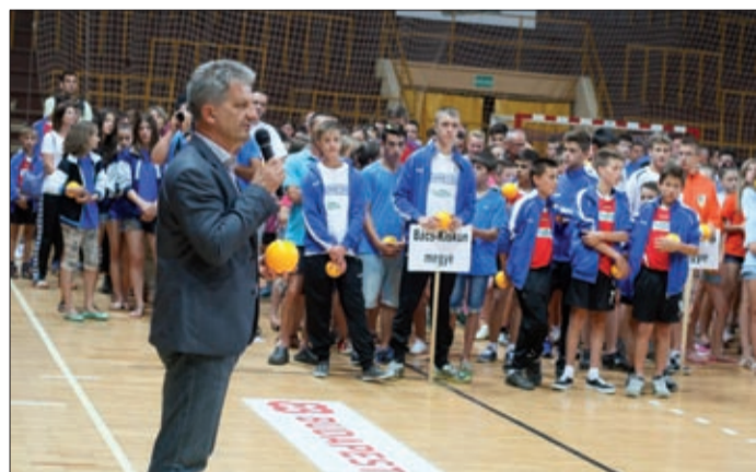
Közel kilencszáz diák vett részt a megmérettetésen