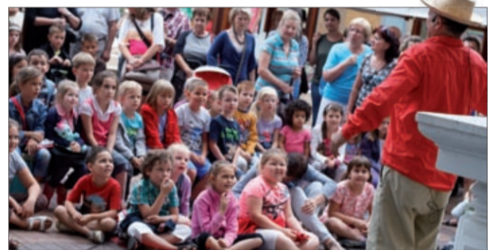
Három napon át 27 előadást láthattak a nézők