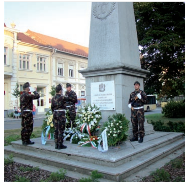
1914. augusztus 2-án indultak a háborúba a 101-esek, akiknek emlékét obeliszok őrzik városunkban

A magára maradt gyerek ezután sok helyen megfordult, de legtöbbit Csabán tar-