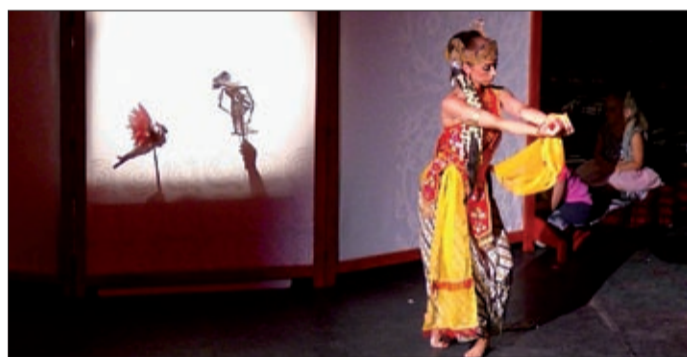
Még Indonéziából is érkeztek bábművészek