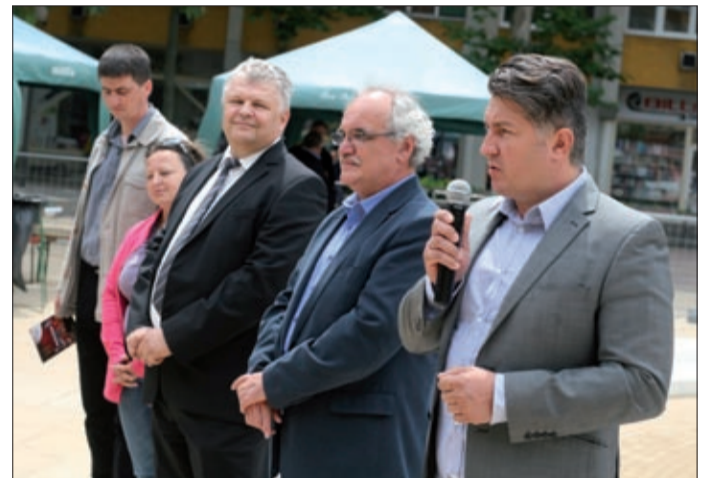
A megújult belváros átadása június 26-án volt