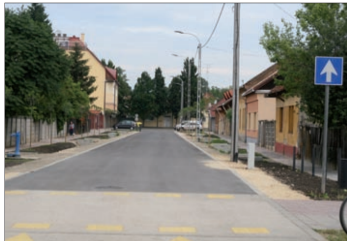
Az eddig sáros, poros Knézich utcát is leburkolták