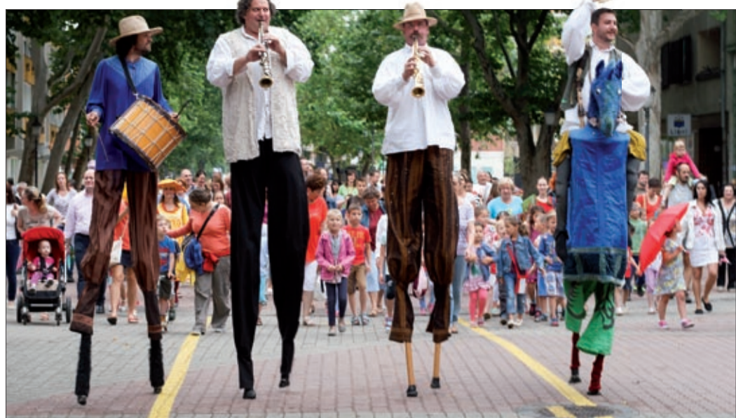
Langaléta Garabonciások és mögöttük a népes „kurta lábú publikum”

Valóban fantasztikus volt az, amit a Békéscsabai Napsugár Bábszínház és a közreműködők június 19-e és 21-e között elének tártak a bábfesztiválon, ahol kilenc hazai mellett öt külföldi társulat is képviseltette magát. Összesen 27 produkciót láthatott a közönség, három napon át szinte folyamatosan zajlottak a bábos előadások, amelyekben volt minden a vásári komédiától a báboperáig. A bábéledad-