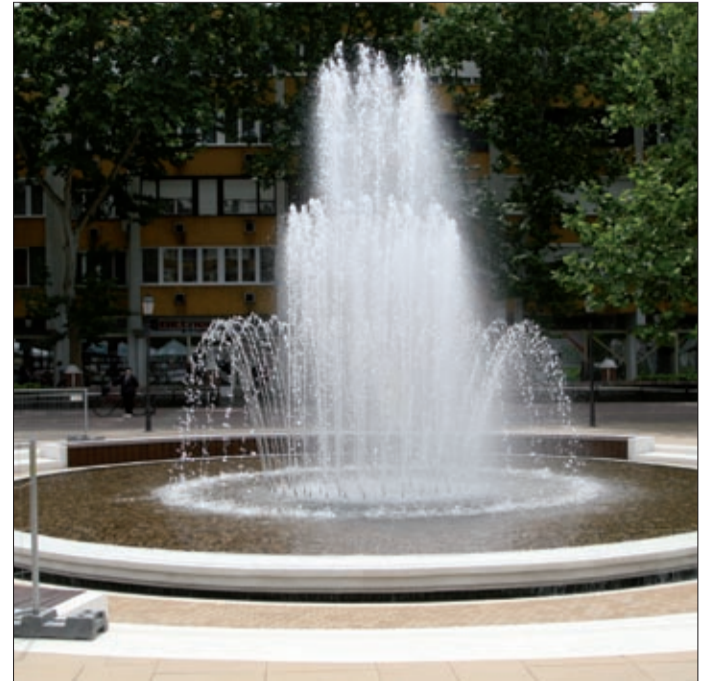
M. E. A Korzó téri szökőkút zenél, és új a vízképe is

Mint azt a jelenlevők kiemelték, a belváros felújítása az itt élők kényelme és jó közérzete mellett turisztikai célokat is szolgál.