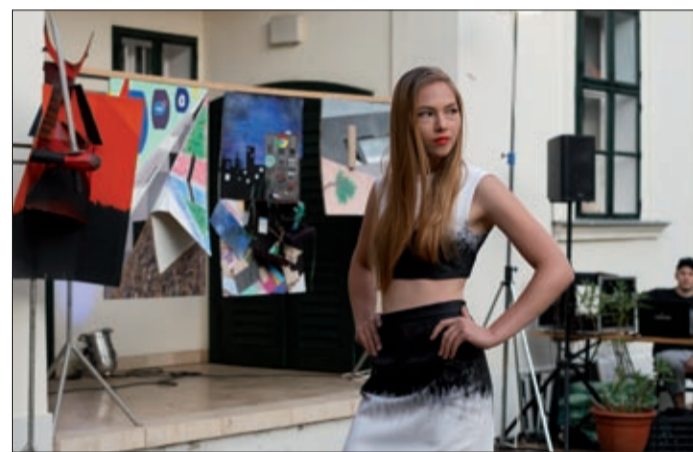
Divatbemutató az emlékház udvarán