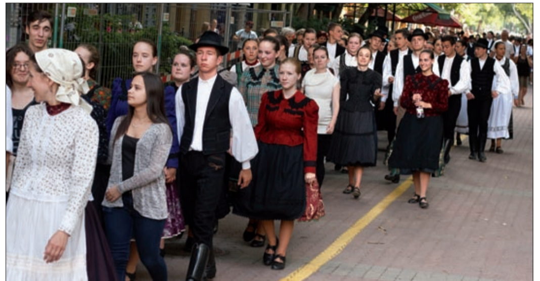
A táncosok felvezetésével a menet végigvonult a frissen felújított belvárosban