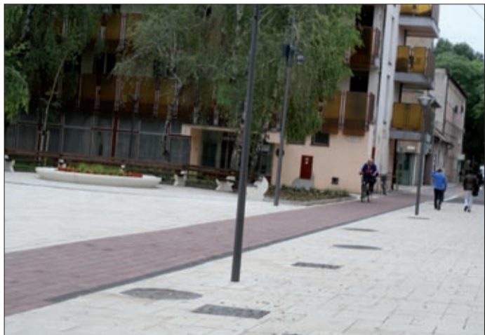
A Nagy Imre tér és a Csaba utca is megújult