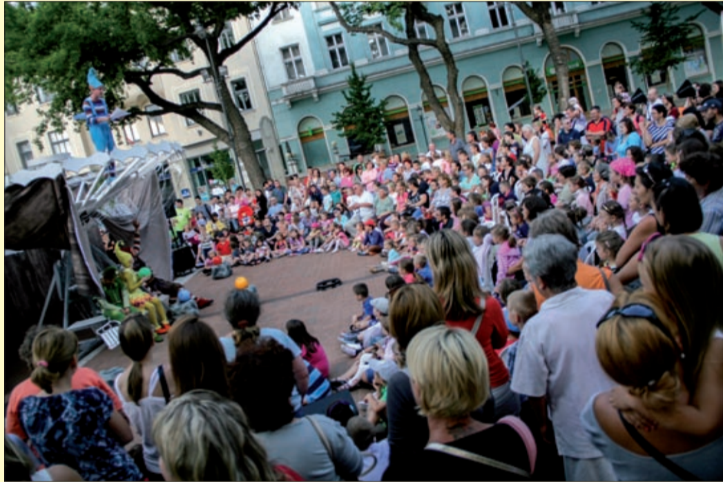
A fotóteren idén is egész nyáron válogathatunk a programok között

nyarat. A Csabai Nyár 96 rendezvényből álló programsorozata minden korosztálynak élményeket kínál, hisz a szervezők a színpadra varázsolnak táncot, könnyűzenét, komolyzenét, komédiát, krimi, prózát – fogalmazott Szarvas Péter, aki az idei Csabai Nyár külön értékének nevezte a XVI. Békéscsabai Nemzetközi Bábfesztivált.