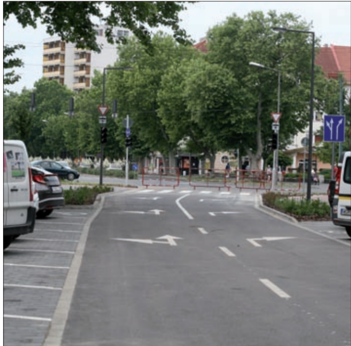
A Csaba Centernél az utat kinyitják majd a Jókai utca felé

A Korzó téri szökőkút zenél és a vízképe is programozható