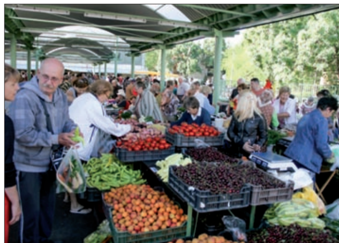
A Békéscsabai Járásbíróság döntése szerint az Agórának át kell adnia az ingatlanokat a vagyonkezelő részére

Június 5-én jogerőre emelkedett a Békéscsabai Járás-