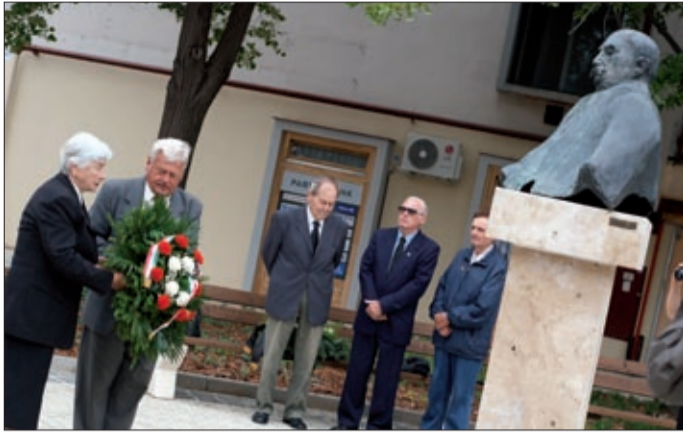
A Nagy Imre Társaság Békéscsabai Szervezete koszorúzott

A Nagy Imre Társaság Békéscsabai Szervezete tartott megemlékezést a mártírháltalt halt miniszterelnökről elnevezett téren június 16-án délelőtt.