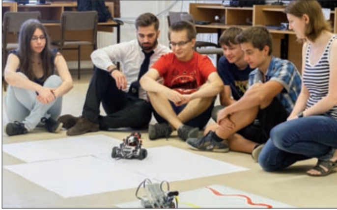
A Lego robotokkal ismerkednek a gimnazista diákok

A tanulókat megfigyelés, illetve dokumentumelemzés alapján válogatták be a programba. Az informatikatanár, valamint a szaktanárok, osztályfőnökök megfigyelései alapján kerültek a kiválasztott csoportba. A megfigyeléseket a tanulók versenyeredményei is alátámasztották. Mind-