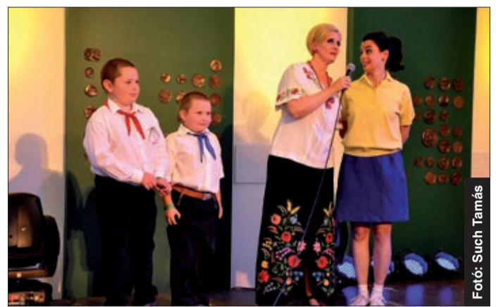
A múzeumban a retro jegyében zajlottak a programok