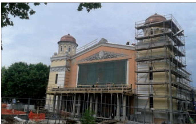
Augusztus második felében megszűnik a felvételi épületen keresztül történő közlekedés

A vasútállomás épületénél a gyalogos-aluljáró szerkezetkész. Augusztus második felében megszűnik a felvételi épületen keresztül történő közlekedés, ekkortól az utasok a C peront már az aluljárón keresztül közelíthetik meg. A C peront június 22-én adták át az utazóközönségnek, a nyár folyamán épül az A és a B peron is. Az állomás előtti téren megkezdődik a P+R parkoló építése, jelenleg a közművek kiváltását végzik. Június 26-ától augusztus 18-áig Békéscsaba és Gyula között vágányépítés miatt vonat-