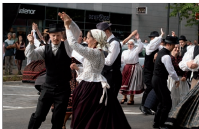
Táncház a Csaba Center előtt

Amikor besötétedett, meggyújtották a máglyát, azt is körültáncolták, és aki szerette volna, még a tűzgrást is kipróbálhatta – fantasztikus és egészen különleges hangulatban telt ez az este Békéscsaban.