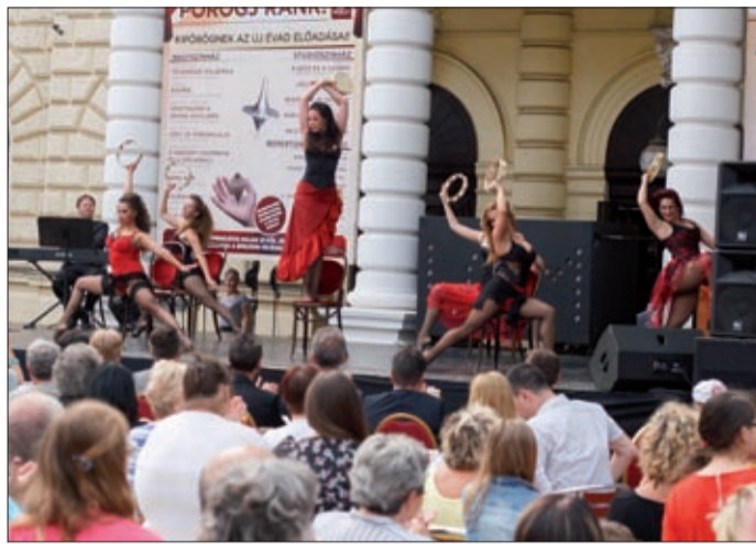
Részleteket láthattunk a Land of Music produkcióból

A Gálfy László színművész, a teátrum egykori igazgatója emlékére, a családdal közösen létrehozott díj, a Gálfy Gyűrű-díj odaítéléséről a hagyományoknak megfelelően szakmai bírálóbizottság döntött. A kitüntetettre az elmúlt évadban bemutatott darabok rendezői tettek javaslatot, ebből a zsűri választotta ki a legérdemesebbet. A szak-