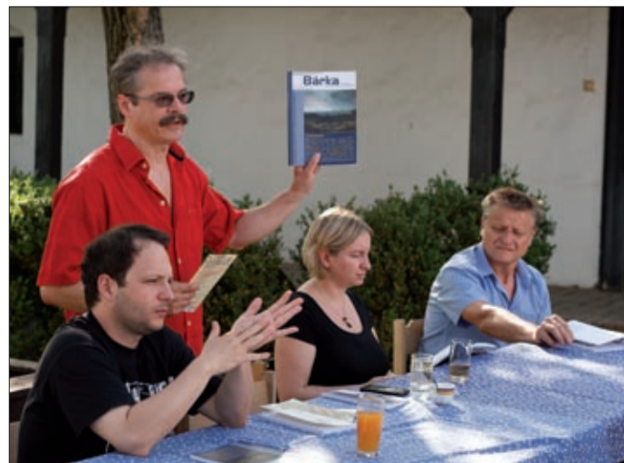
A Bárka irodalmi, művészeti és társadalomtudományi folyóirat legfrissebb számát is bemutatta