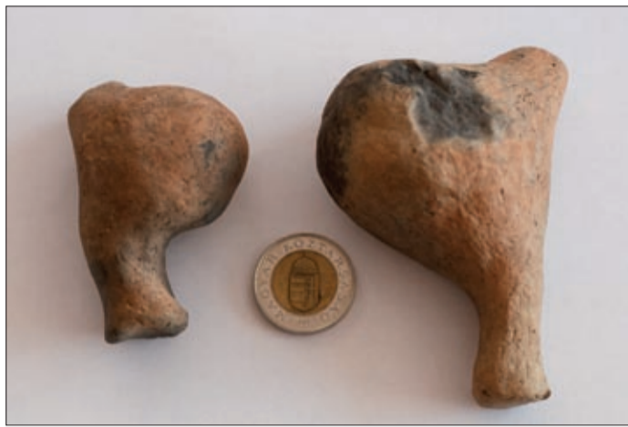
Az apró műalkotás fennmaradt darabja

– 2012-ben, Sarkad külterületén, egy épülő kerékpárút nyomvonalán végeztünk régészeti feltárást. Már akkor tudtuk, hogy a helyszín érint egy régészeti lelőhelyet, és ez a későbbiekben beigazolódtott, sikert hozott a munka. A 2 méter széles nyomvonalon, egy gödörben, melyet a 8 ezer évvel ezelőtt itt élt elődeink az agyag kitermelése után hulladékok tárolására használtak, érdekes tárgyat találtunk. A föld alól, úgy 1–1,5 méter mélyről került elő egy istenanya-szobor töredéke – mesélt a feltárást részleteiről Bácsmegei Gábor , a Munkácsy Múzeum régész-muzeológusa, aki meg is mutatta nekünk a 8 ezer éves tárgyat. A kiégetett agyagszobor alsó részét, a női alak farát és lábait őrizte meg számunkra a föld, a felső rész nem került elő. A közel 10 cm-es torzóról jól kivehető, hogy a női test egyfajta termékenység szimbólum lehetett. Igen érdekes, hogy több részből állították össze készí-