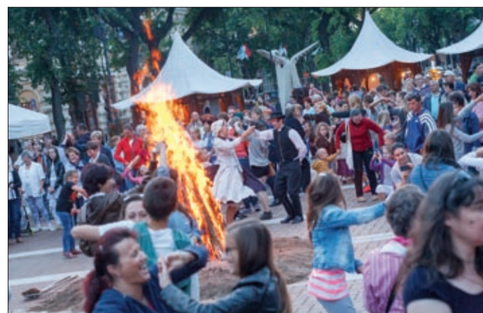
Este máglya körül táncoltak és a tűzgrást is kipróbálhatták