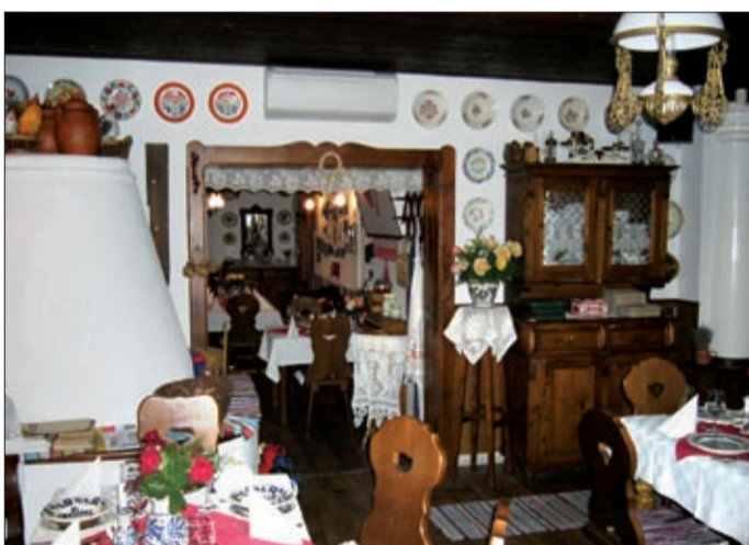
A kézzel készült berendezések is különlegessé teszik

dezések, székek, függönyök, festett tányérok is különlegessé teszik. A kisvendéglőt a szakma is többször elismerte, 2003-ban az Ígyenc túsók, majd az Ízutazás ajánlotta gasztronómiai úti célként, aztán bekerültek az ország száz legjobb vendéglőjét felvonultató kiadványba, a Vendég és hotel című nemzetközi szaklap Harmónia és dizájn a vendég szemével című versenyén országos első helyezettek lettek, s most a 25 legjobb magyar kisvendéglő közé kerültek.