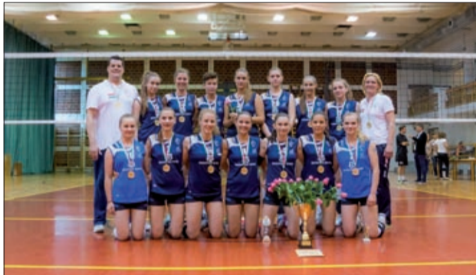
A csapat nyert az Országos Ifjúsági Kupa döntőjében

Hatalmas csatában sikerült megvédenie tavalyi elsőségét a BRSE ifjúsági korosztályú csapatának a Békéscsabán rendezett Országos Ifjúsági Kupa döntőjében. A csabai lányok, csakúgy, mint egy éve, az örök rivális Vasas Óbuda ellen léptek pályára, és egy közönségszórakoztató csatában, a döntő szettben sikerült nyerniük.