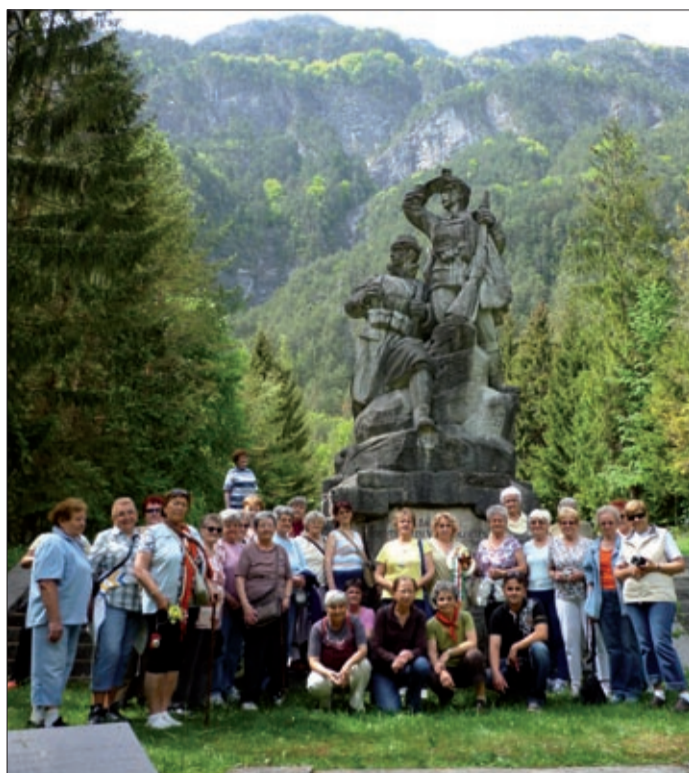
Bejárják a Békéscsaba történetéhez is kötődő helyszíneket

A klub tagjai ezután jártak Lendván, ahol a Makovec Imre által tervezett Magyar Nemzetiségi Művelődési Házat nézték meg. Ljubjanában