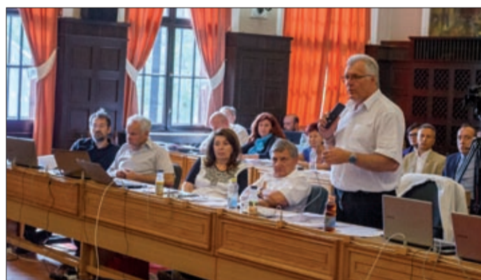
A fiatalok életkezdesét, itthon tartását rejti a program

Az idei költségvetésben ötmillió forintot különítettek el a Békéscsaba hazavár! ösztöndíjprogram első támogatási időszakára. Elkészült az ösztöndíjprogram koncepciója, amelynek alapján a rendelet kétféle támogatást különböztet meg: a felsőoktatási hallgatói ösztöndíjat és az életkezdesi, munkába állási ösztöndíjat.