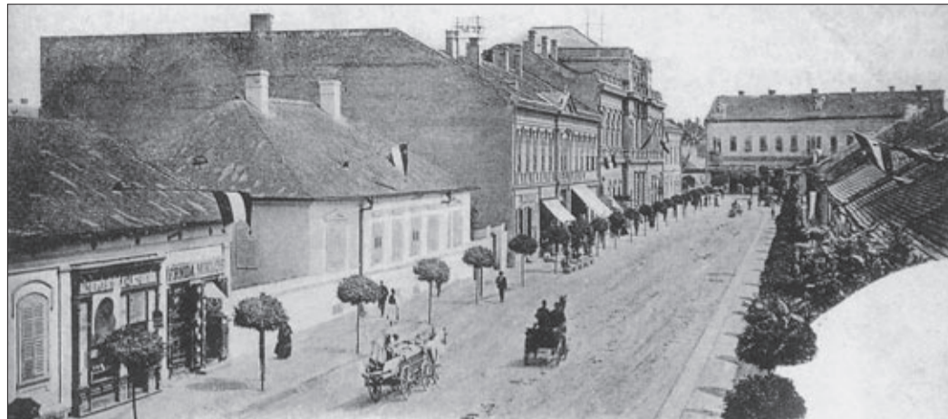
Innen idultak és ide tértek vissza a korzók

A Magyar–Holland Kultúrgazdasági Rt., valószínűleg a csabai korzó hírnevének köszönhetően határozta el, hogy filmet forgat róla. A forgatás idejét, 1929. november 3-át a Békésmegyei Közlönyben tették közzé, a lakosság figyelmébe ajánlva a 11–12 óra közötti forgatást. Továbbá tudatták, hogy a felvételeket még novemberben a Csaba Mozgóban levetítik.