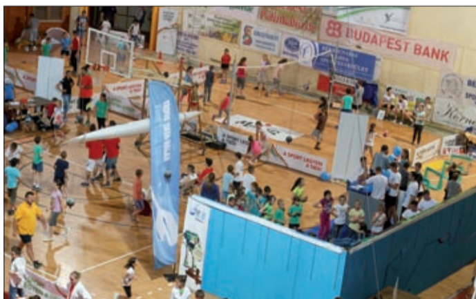
Mindent kipróbálhattak az iskolások