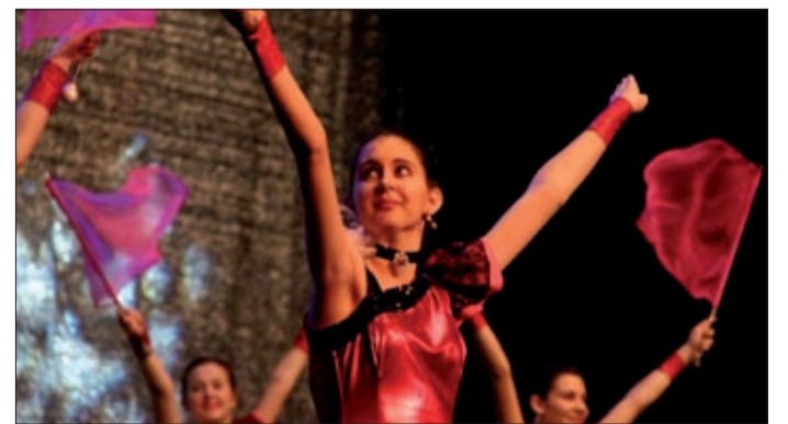
A tizedik Mikulás táncgála is a Csabagyöngyében volt