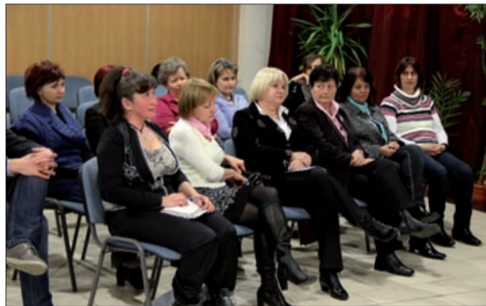
A Csabagyöngye továbbra is számít az önkéntesekre

Egy húszfős, civilekből álló kis csapat segíti jelenleg is a Csabagyöngyében dolgozók munkáját. A lelkes önkénteseket december tizenegyedikén köszöntötték a kulturális központ munkatársai.