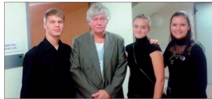
Tehetséges zongoristanövendékek Kocsis Zoltánnal

Az ideai filharmoniai évad legrangosabb koncertjére került sor december tizedikén: Kocsis Zoltán és a Nemzeti Filharmonikus Zenekar fellépése megtöltötte a Csabagyöngye Kulturális Központ hangversenytérmet.