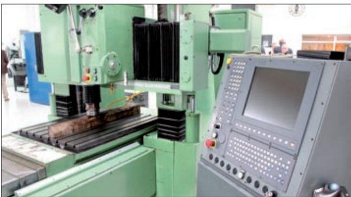
A csarnokban korszerű gépekkel dolgoznak