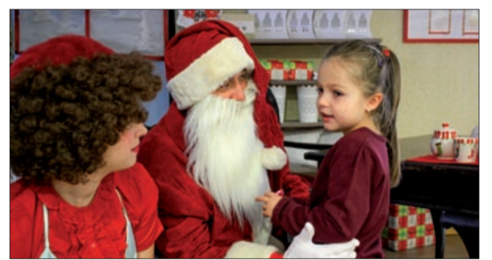
A Mikulással fotózni is lehetett