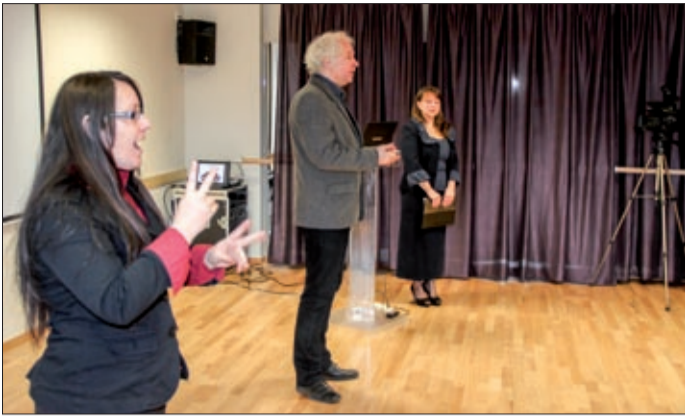
A konferencián jelnyelvi tolmács is segített

A Békés Megyei Család, Esélyteremtési és Önkéntes Ház (CsEÖH) Esélyegyenlőség a jó gyakorlatok tükrében címmel rendezett konferenciát december hatodikán a Csabagyöngyében.