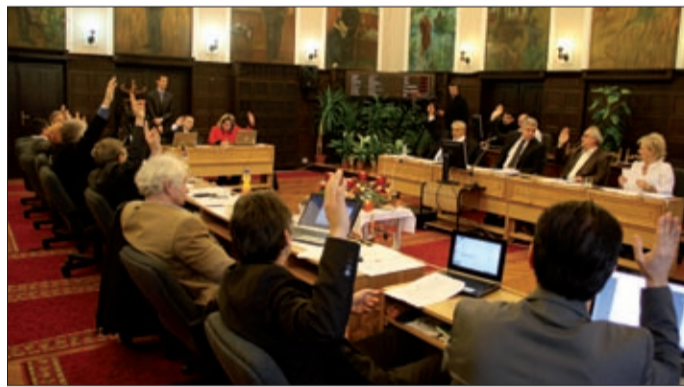
Péntek 13-án kézzel szavaztak: elromlott a szavazógép

A közgyűlés idején utolsó ülésén döntött több utca és közterület át-, illetve elnevezéséről.