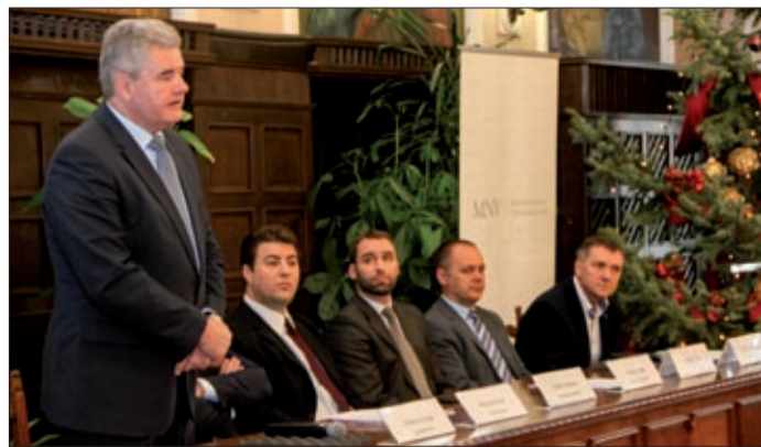
A szakmai esemény megnyitója

A Magyar Nemzeti Vagyonkezelő (MNV) Zrt. Országos Vagyongazdálkodási Roadshow-t indított, amelynek keretében december tizenegyedikén a Békéscsabai városházán találkoztak a szakemberek.