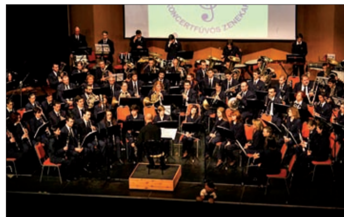
A jubileum alkalmával nagy sikerű hangversenyt adtak a Pécsi Vasutas Koncert Fúvószenekek közreműködésével