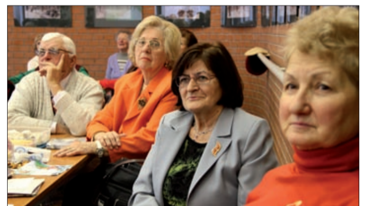
Az idősök körében népszerűek az előadások, kirándulások

Idén ünnepli működésének harminc éves jubileumát a Lencsési Községi Ház Nyugdíjas Klubja. A jubileum kapcsán egész héten át tartó programsorozatot tartottak.