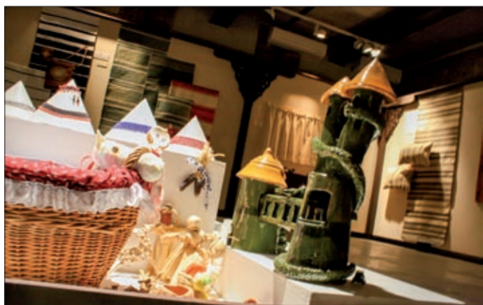
A kis kézművesek éppolyan ügyesek, mint a nagyok