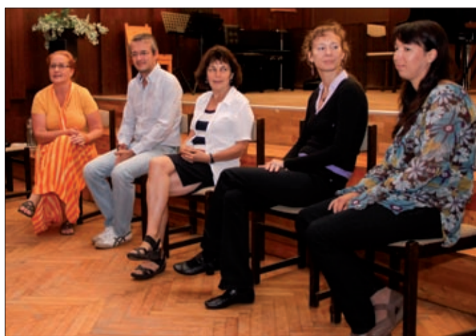
Számos külföldi zenész is eljött a kurzusra