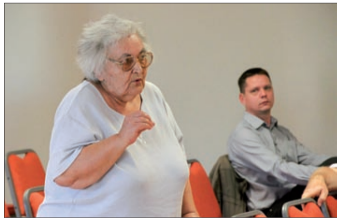
A lakosság felvetései egyeznek az önkormányzat terveivel