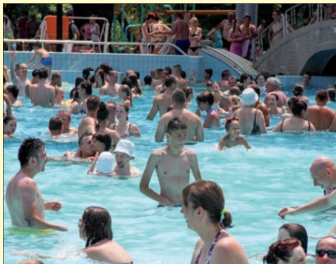
Termálenergia szolgálja a medencék fűtését

Jelentősen kisebb lesz a gázfogyasztás, ezzel csökkennek a közüzemi költségek is, s javul a szolgáltatások színvonala, így például a víz minősége az Árpád fürdőben. Mindez a most befejeződött fejlesztés eredménye.