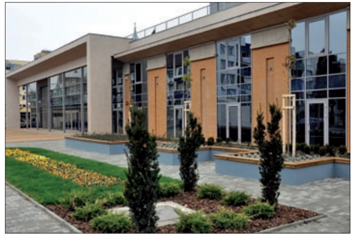
A Csabagyöngyében versenyek, programok követik egymást

Ugyancsak 10 órakor veszi kezdetét a Csabai szárazkolbász-kiállítás, helyi őstermelők és a Csabai Kolbászklub bemutatkozása. Délután egy órakor indul a kolbászgyűrés, melyben csapatok versenyeznek. Városunkat Koppány csapata – Békéscsabai Jókai Színház, a Munkácsy csapat – Munkácsy múzeum, a női ké-