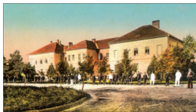
Az egykori méntelep emlékét már csak néhány fotó őrzi