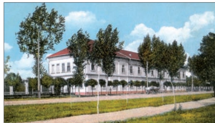
120 éve hozták létre a méntelep a mai Kazinczy utcában

A hazai lótenyésztés előmozdítása céljából hozták létre százhusz éve, 1893-ban a Magyar Királyi Állami Méntelep a Kazinczy utcában. A telep 43 850 négyzetméteres nagy területen, egészen a vasútállomásig húzódott. Az épületet Tattál Károly, a mezőhegyesi ménésbirtok mérnöke tervezte, a kivitelezést Wagner József csabai építész vállalata végezte. A hatalmas, sárgára festett, haragoszöld színűre mázolt ablakú, emeletes épületben közel 300 főnyi katonai legénység látta el a szolgálatot. Az emberek az emeleti legénységi épületben, a kényelmes fekvőhelyekkel, kánnal, konyhával, őrsozával és szertárral rendelkező részben kaptak elhelyezést. 80-