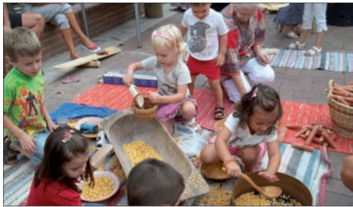
A kicsik élvezettel kukoricáztak a főtéren

Az Ibsen Ház udvarán a családi napok, a Szent István téren Vasárnapi fagyizó címmel különböző programok várták az apróságokat egész nyáron. Augusztus végén a gyermekprogramok sorát a Lencsési Községi Ház „kincsei” zárták a főtéren.