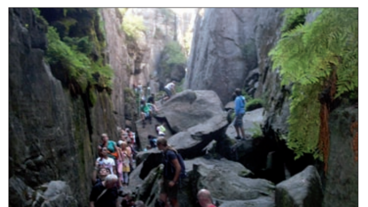
Gyalogtúra a Góry Stolowe hegységben

A Magyar-Lengyel Baráti Kulturális Egyesület és a Lengyel Nemzetiségi Önkormányzat az „Ismerd meg Lengyelországot” című program keretében, augusztus 14-19. között a Dél-Szudétákra – Duszni Zdrój – gyógyüdülő központba szervezett utazást. A programban részt vevő 43 kirándulónak alkalma nyílt gyógyvízkóstolásra, a történelmi kisvárosok megtekintésére, a homokkő alkotta szép hegyi táj élvezetére. Az alsó-sziléziai kisvárosokban századelős hangulatban érezhették magukat a csoport tagjai. A közös kirándu-