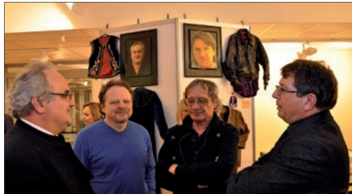
Az 50 év zene kiállítás visszarepít az időben

A nyitohét további programjairól lapunk következő számában olvashatnak.