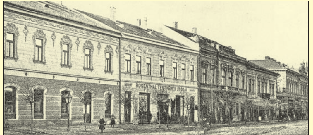
Az egykori Békés-Csabai Népbank épülete (középen) 1900 táján

145 éve indult az első pénzüintézet, a Békés-Csabai Népbank