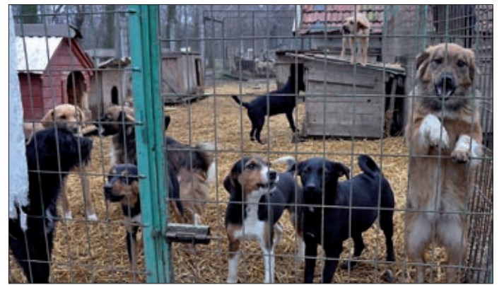
Kikerülni a ketrecből, ez az „álma” minden itt lévő kutyának