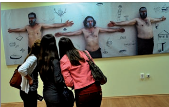
A 3T nem csak a maga valójában, a falon is ott volt

A Jankay galériában nyílt meg a 3T Csoport (NSZK) 50 – 10 című kiállítása, amely már a belépéskor különleges élményekkel várta a látogatókat: a padlóra vetített feszes víztűkrön át léphetett be a látogató a terembe, mintegy szimbolizálva az ősi vízen járás és a megtisztulás folyamatát.