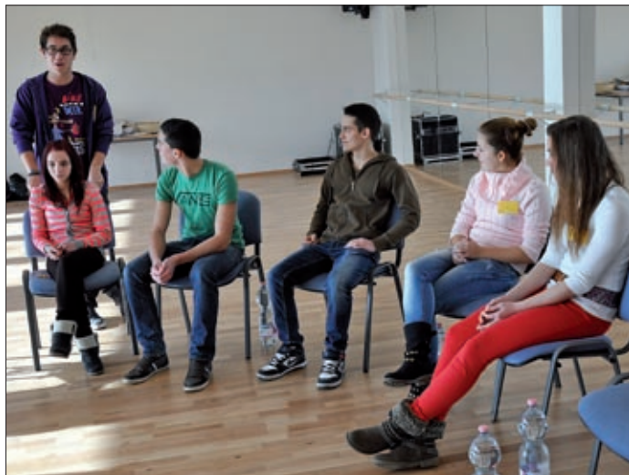
Patent volt a szervezés, a program és Patent az iroda is

A Csabagyöngye Kulturális Központban lelt új otthonra a Patent Ifjúsági és Diákiroda, amelynek átadása január 24-én volt. A SuLink2 (az első tavaly októberben volt a társaskör épületében) program keretében a középiskolások egész napos ügyességi és szellemi vetélkedősorozattal, kódvadászattal vették birtokukba a Csabagyöngyét.