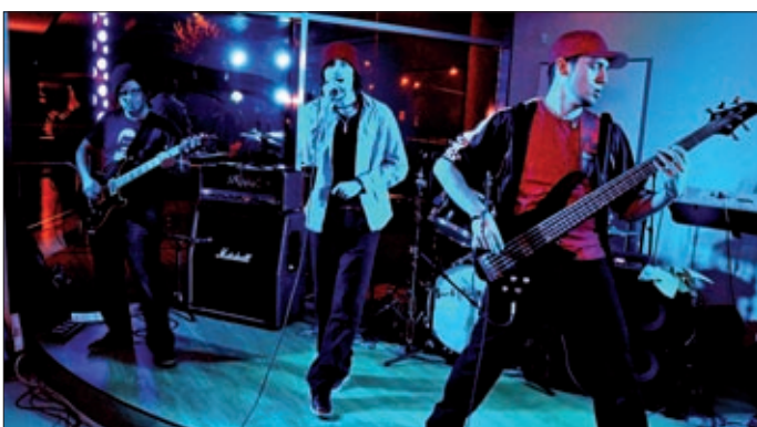
Épp SnailGardN dolgozza meg a régi-új ház falait