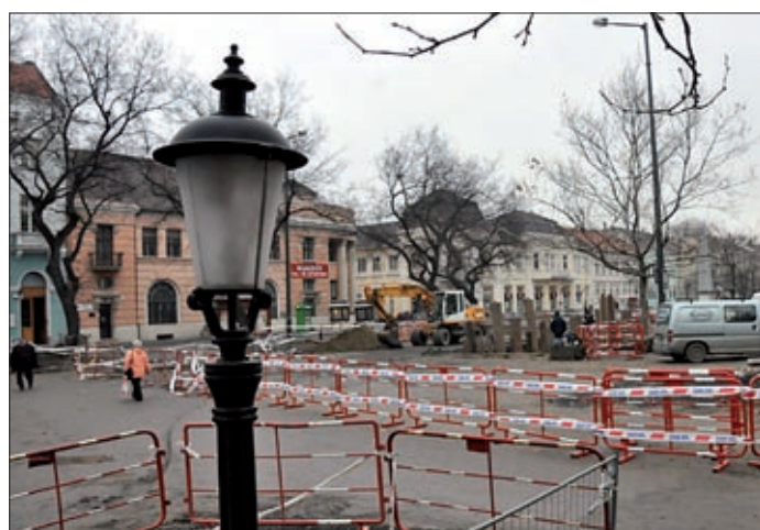
A belváros-felújítás önrészből 130 milliót kapunk vissza

A 2013-as évben az intézmények átszervezése kapcsán jelentősen változik Békéscsaba költségvetése. A jövő évi költségvetésről a legközelebbi, február 22-én tartandó közgyűlésen dönt majd a képviselő-testület.