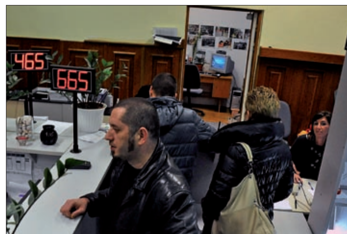
Az okmányiroda hosszított nyitva tartással működik

Ugyancsak a járási hivatalok hatáskörébe tartoznak olyan hatósági ügyek is, mint például egyes szociális ellátások (időskorúak járadéka, közgyógyellátásra, alanyi jogon megállapítható ápolási díjra jogosultság), kommunális igazgatással összefüggő feladatok, menekültügyek, egyes vízügyi, földrendezési, földkiadási ügyek, érettségi vizsgával, oktatással, egyes távhő, villamos energia és földgázellátással kapcsola-