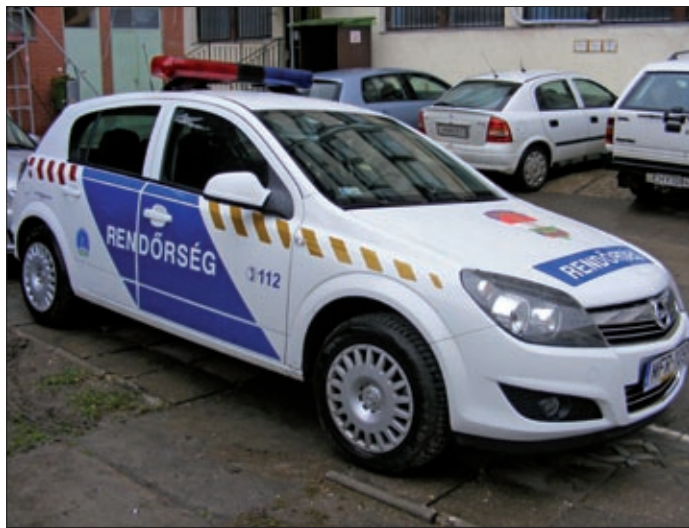
Az új autókat már birtokba vették a csabai rendőrök

A főkapitányság sajtószóvivőjétől megtudtuk, hogy részben amortizációs csere történt, részben pedig a lízingelt autók helyett dolgoznak kollégáik ezentúl ezekkel a gazdaságosan üzemeltethető, jól felszerelt járművekkel. Tehát a szolgálat ellátásához használt autók száma nem változott, de a korszerűsítés a főkapitányság teljes járműparkjának (beleértve a motorokat és egyéb járműveket is) jelentős részét, mintegy egynegyedét érinti.