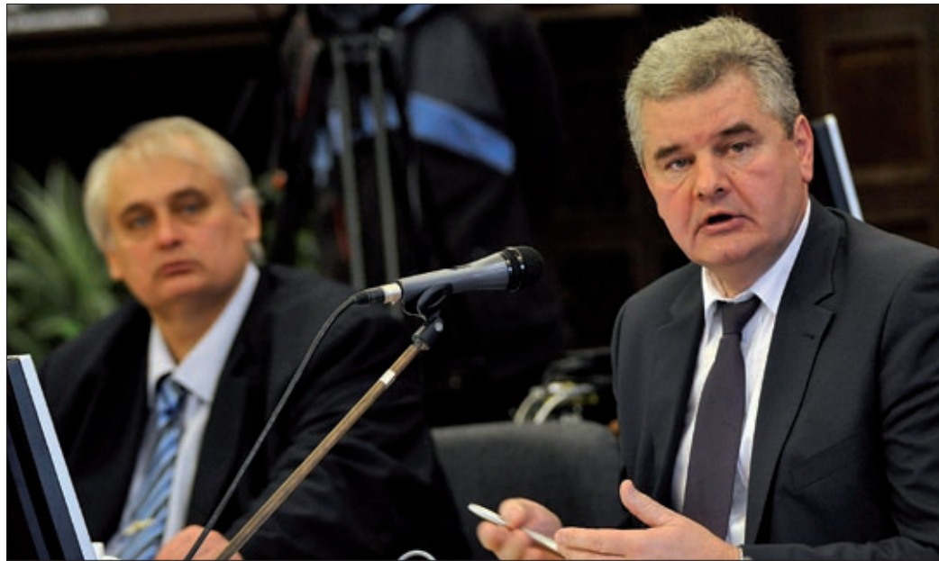
A sportcsarnok és az Előre színház felújítására, valamint jaminai fejlesztésekre pályázunk

Számos fontos kérdésben hozott döntést januári ülésén Békéscsaba képviselő-testülete az idei, első közgyűlésen. Döntöttek egyebek mellett arról, hogy energetikai korszerűsítésre s a jaminai városrész szociális jellegű fejlesztésére nyújt be pályázatot a város.