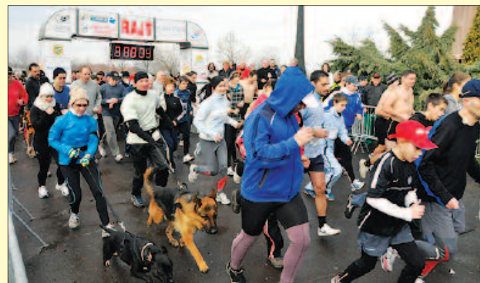
Ismét sikeres volt a szilveszteri futógála