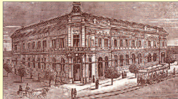
Rajz az egykori szállodáról