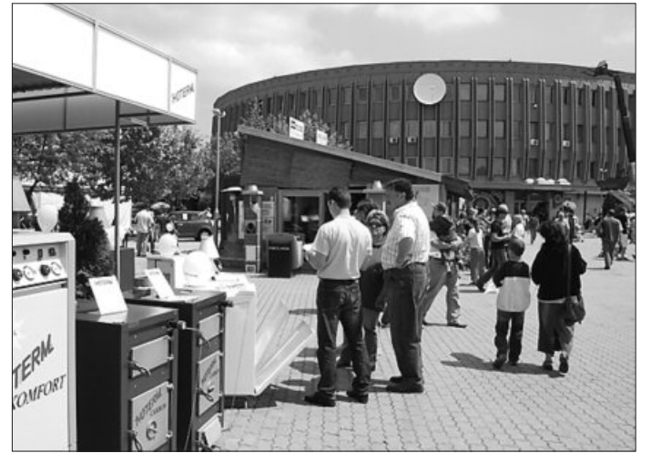
Felvételünk egy korábbi Csaba Expón készült